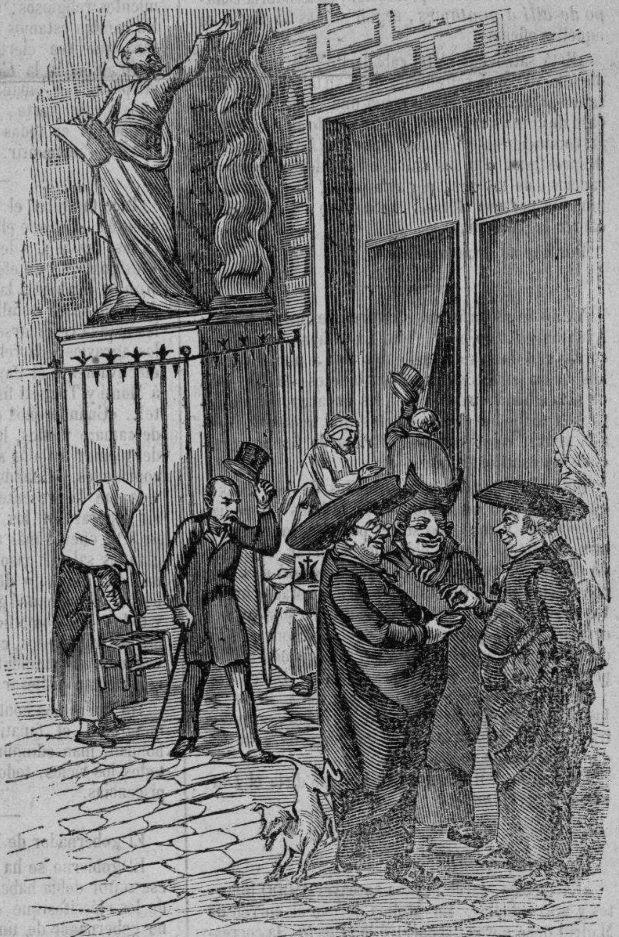
De aquellos polvos nacieron estos lodos.