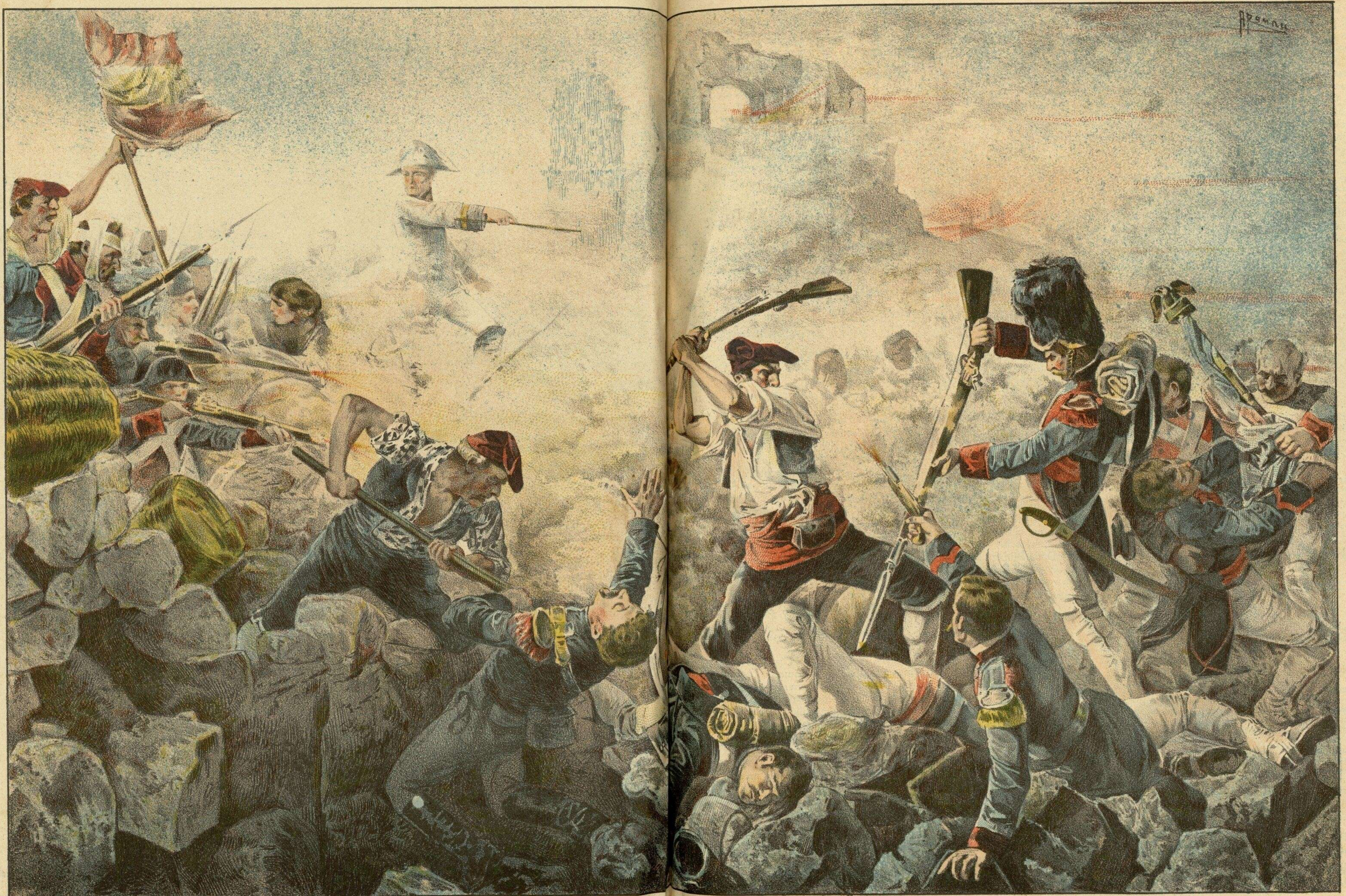
El gran día de Gerona