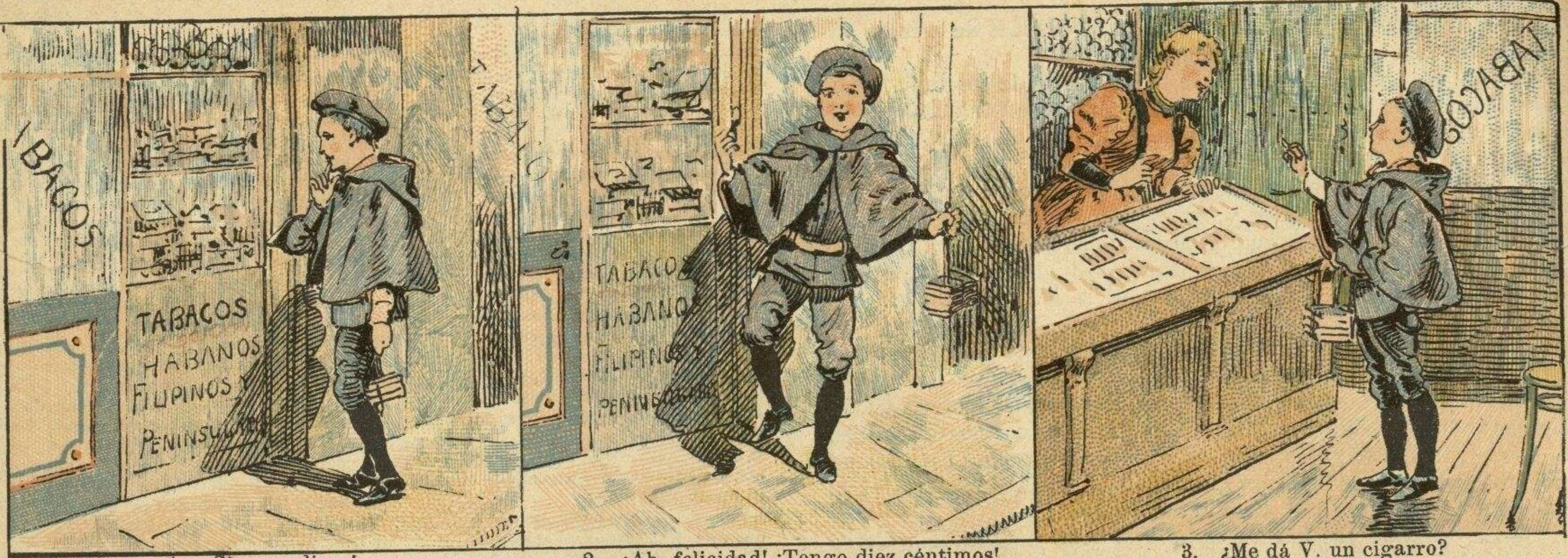
1. ¡Si yo pudiera!...