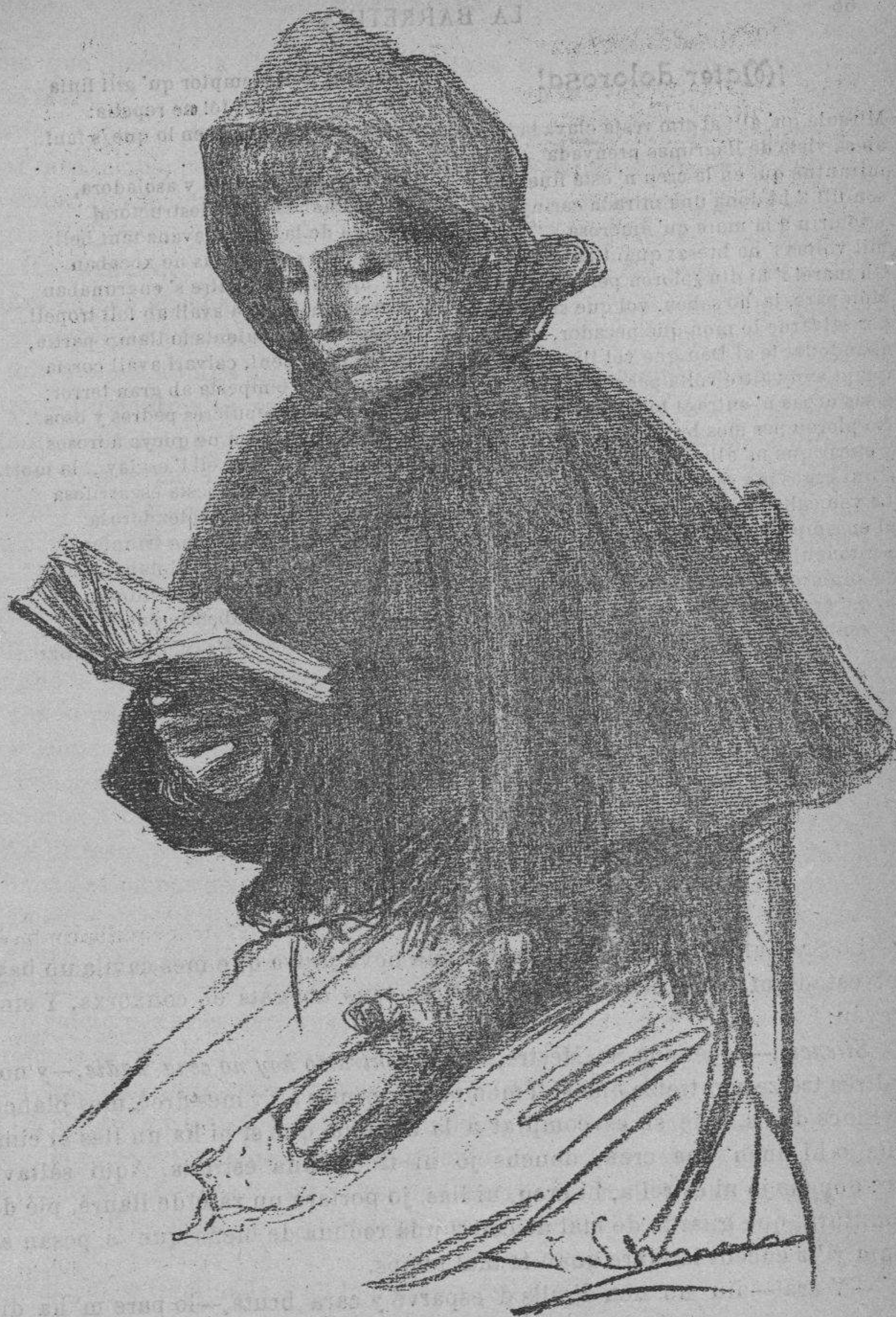
Als Oficis de Setmana Santa.—(Dibuix inèdit de J. Llimona)