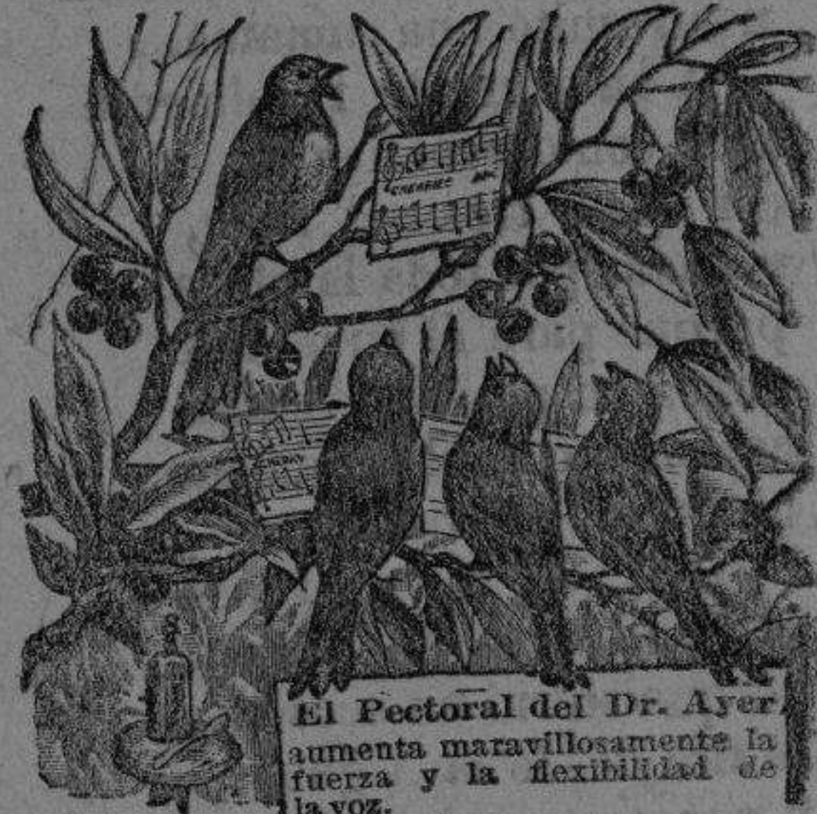
El Pectoral del Dr. Ayer aumenta maravillosamente la fuerza y la flexibilidad de la voz.

Direccion: Sr. Administrador de LA PUBLICIDAD, Granada.