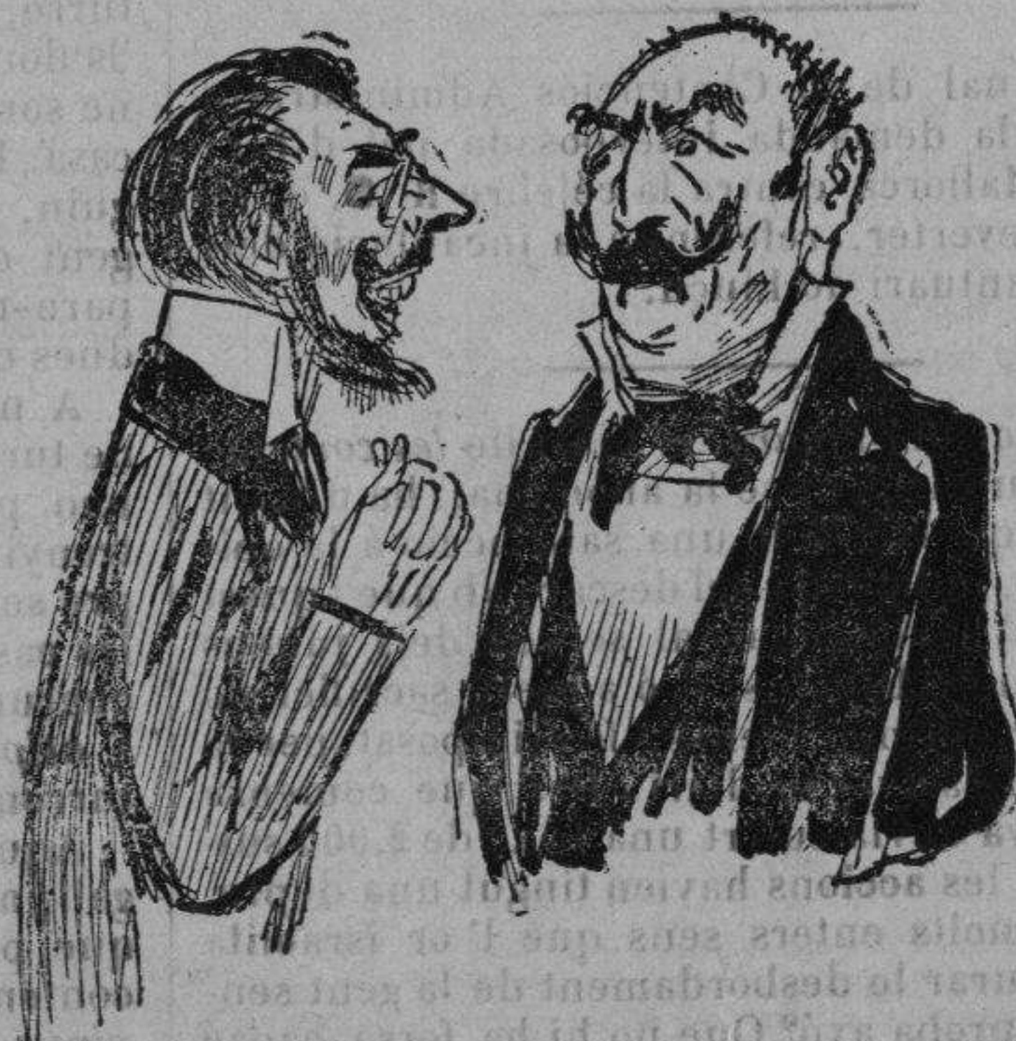
Y 'ls senyors empleats preparantse per tornarhi a clavar altra vegada la dent ab més rabia. Y si hi torna a haberhi insurreccions, ara array que sabem com s' acaben: ¡¡ab sanch y pessetes!!