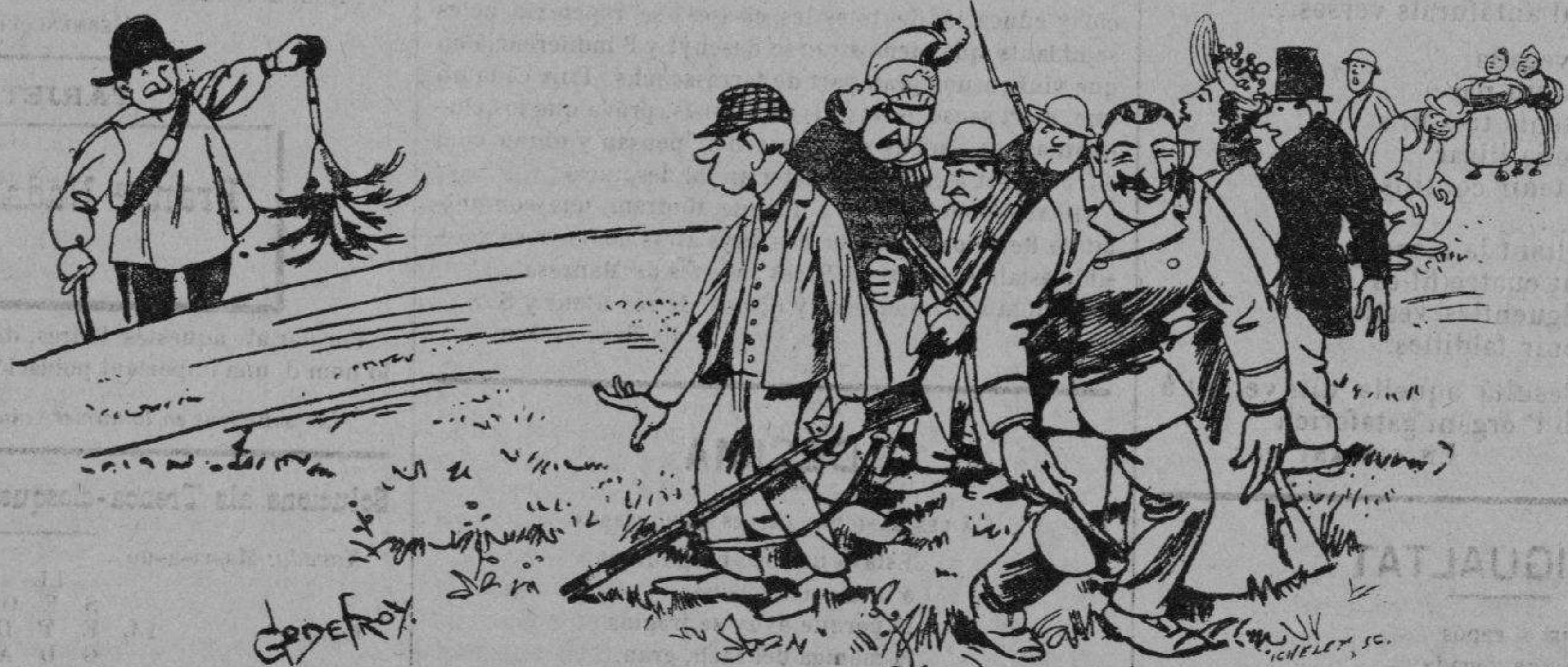
Un plumero dels quatre cantons del Call.