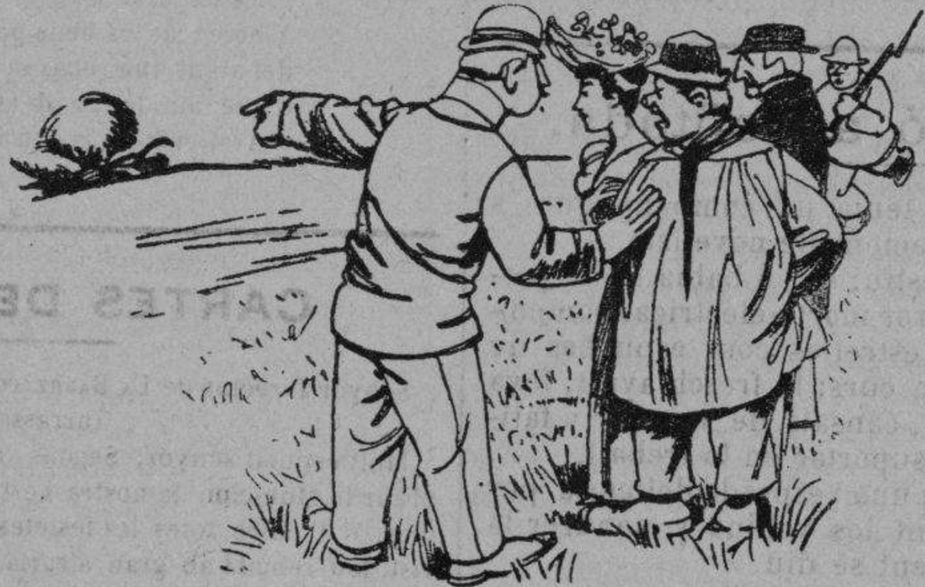
Axó es una fera escapada dels negritos.