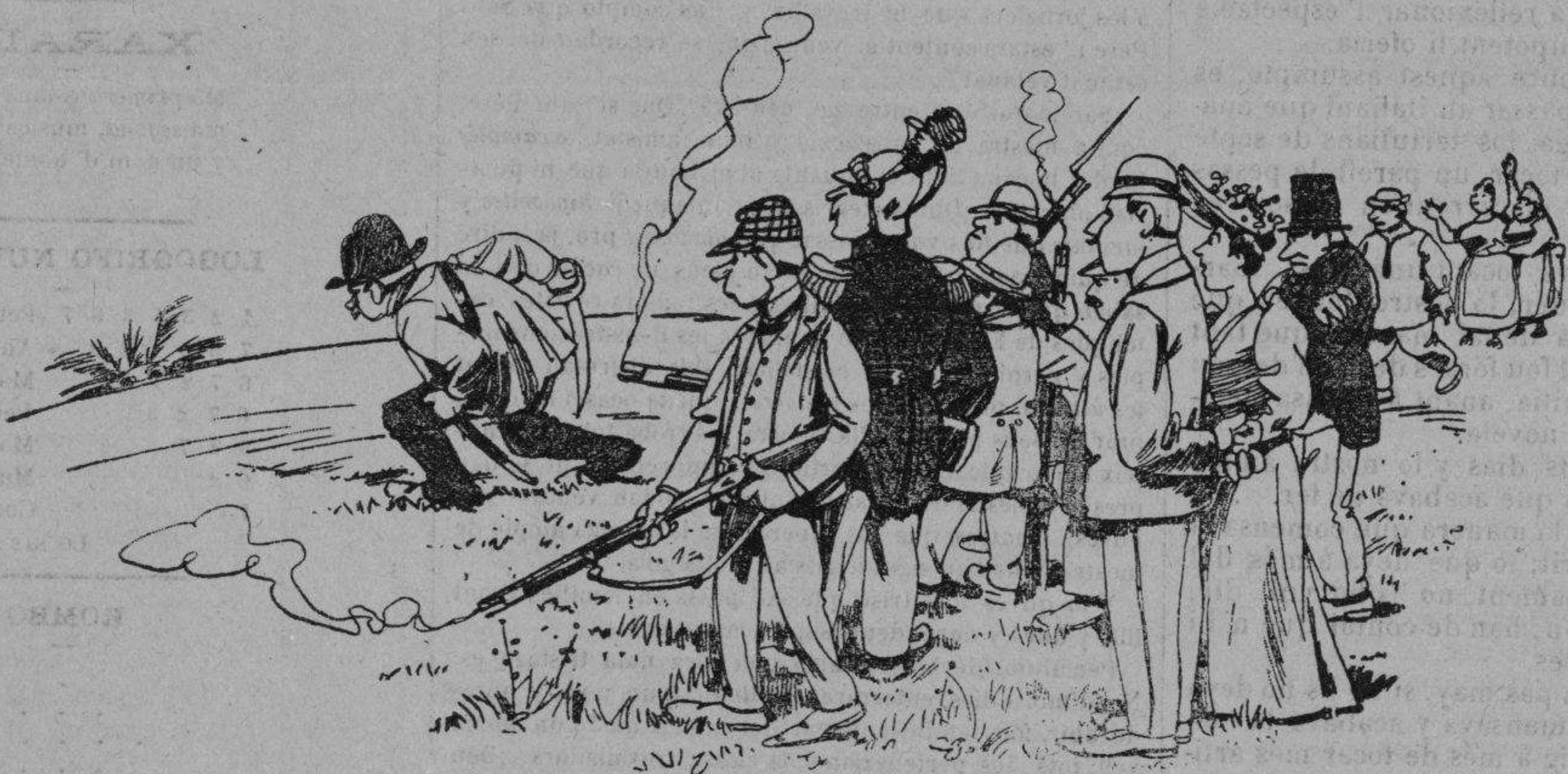
No hay cuidado, que ya es bien muerta.