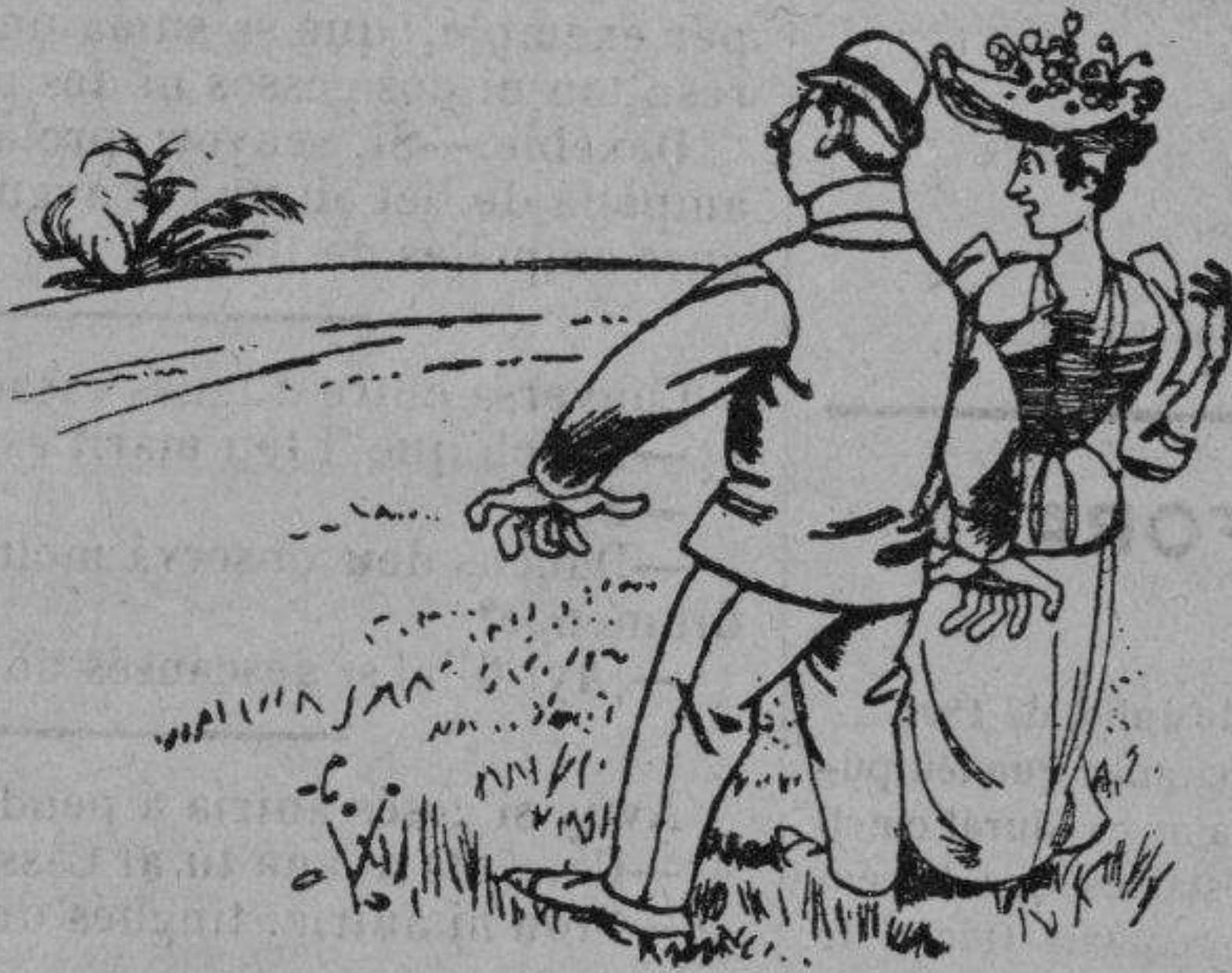
¡Reyna! ¿Qué es allá que 's mou?