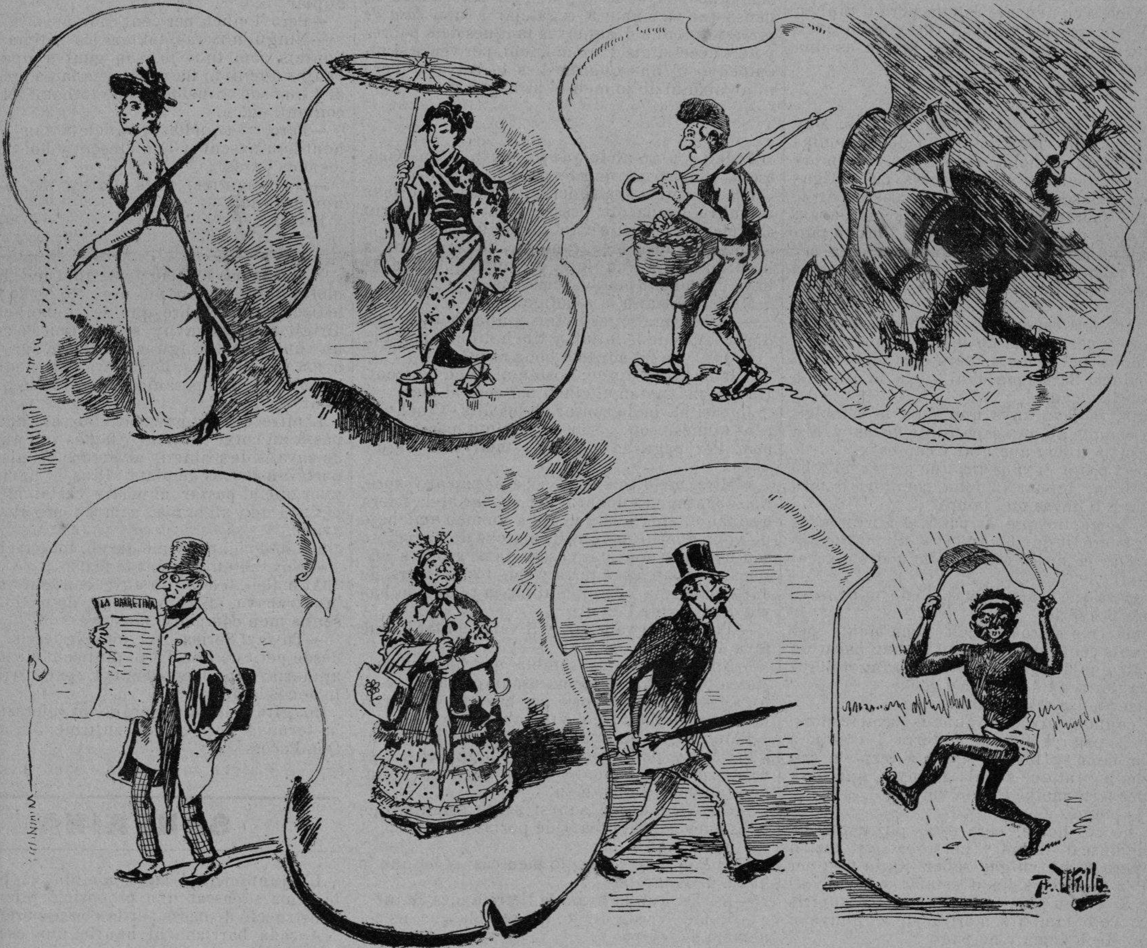
Una de Barcelona. Un sabí.