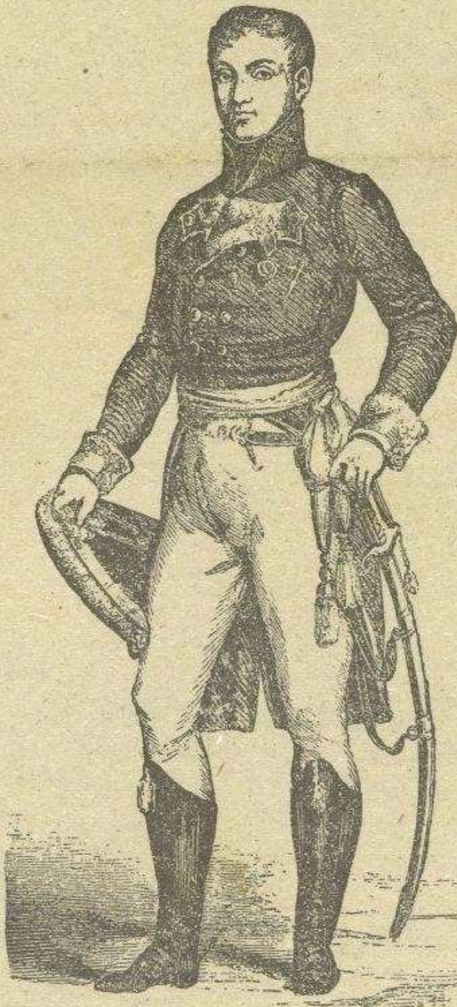
Don Mariano Alvarez de Castro

La ciudad de Gerona celebró el pasado domingo el centenario de la muerte del Excmo. Sr. D. Mariano Alvarez de Castro, López, González del Pino, Troncoso de Lira y Sotomayor, Señor de Cogollos. Caballero del hábito de Santiago, Teniente General de los Reales Ejércitos, Comandante del primer Batallón de Reales Guardias de Infantería Españolas, Gobernador militar y político de la plaza de Gerona y sus fuertes, Subdelegado de Rentas Reales, Comandante General de la Vanguardia del Ejército de Cataluña y tropas del Ampurdán y presidente de la Junta de Gobierno unida con la de Figueras.