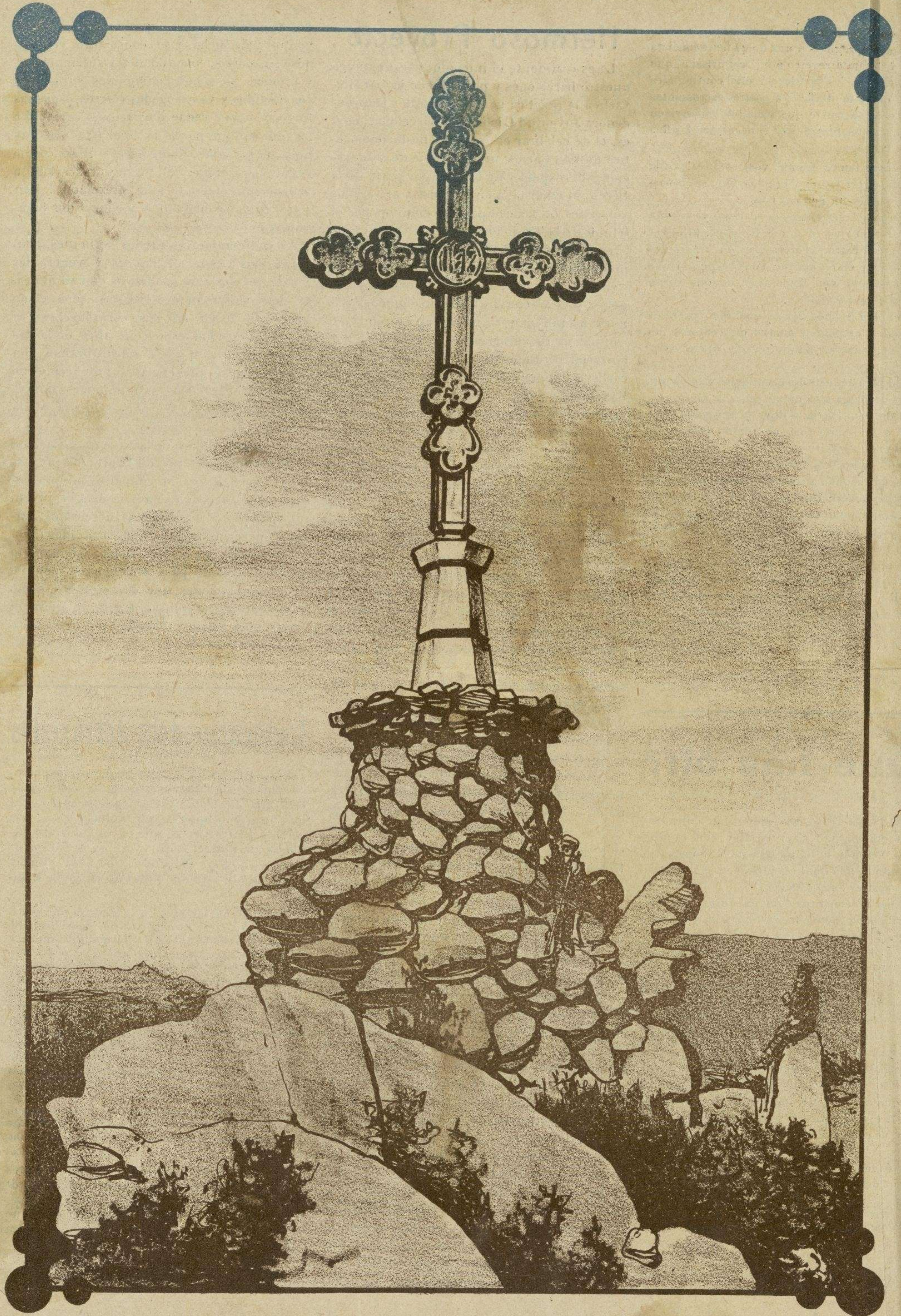
CANET DE MAR - La Creu de Pedra