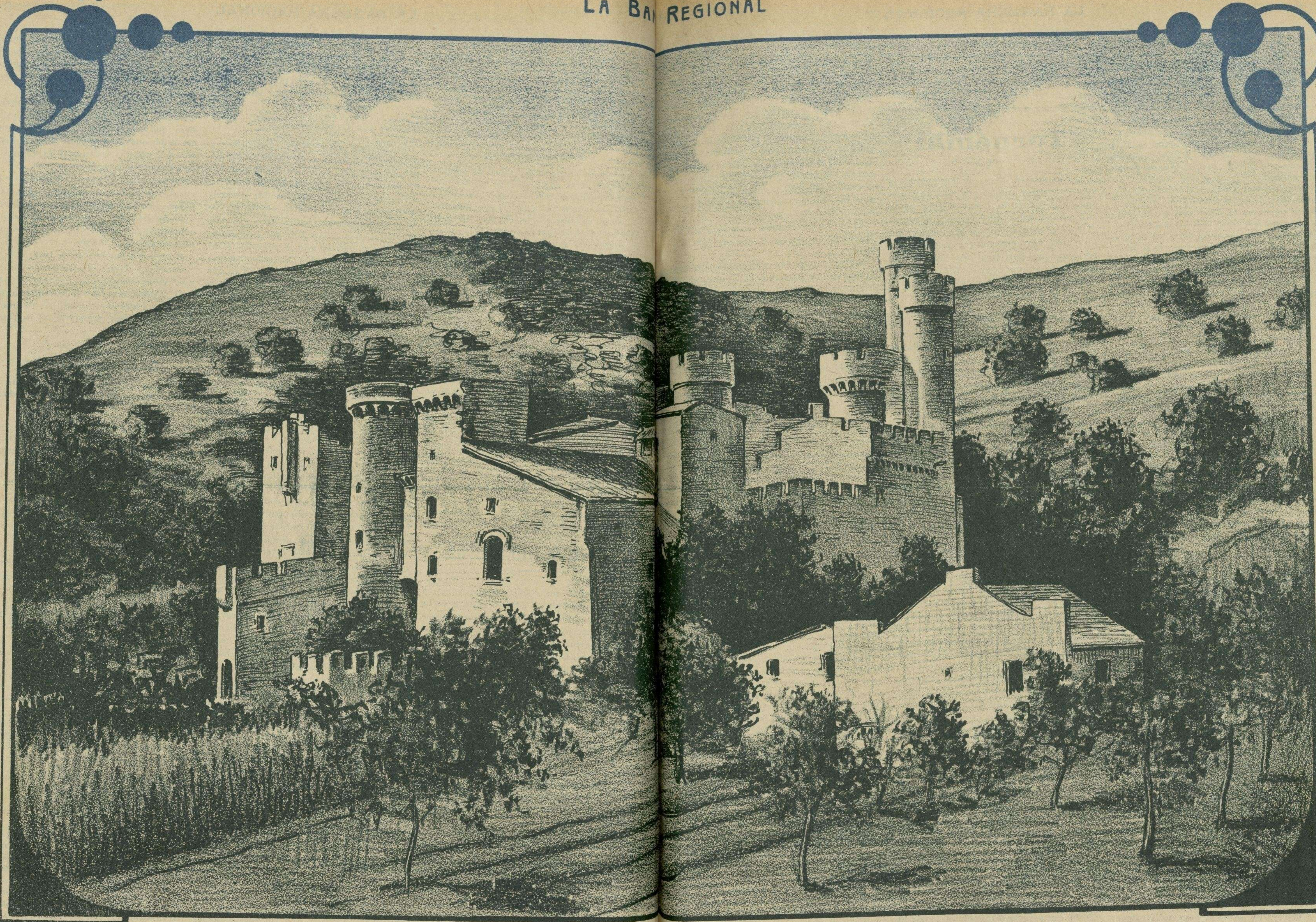
CANET DE MAR - Can de Santa Florentina