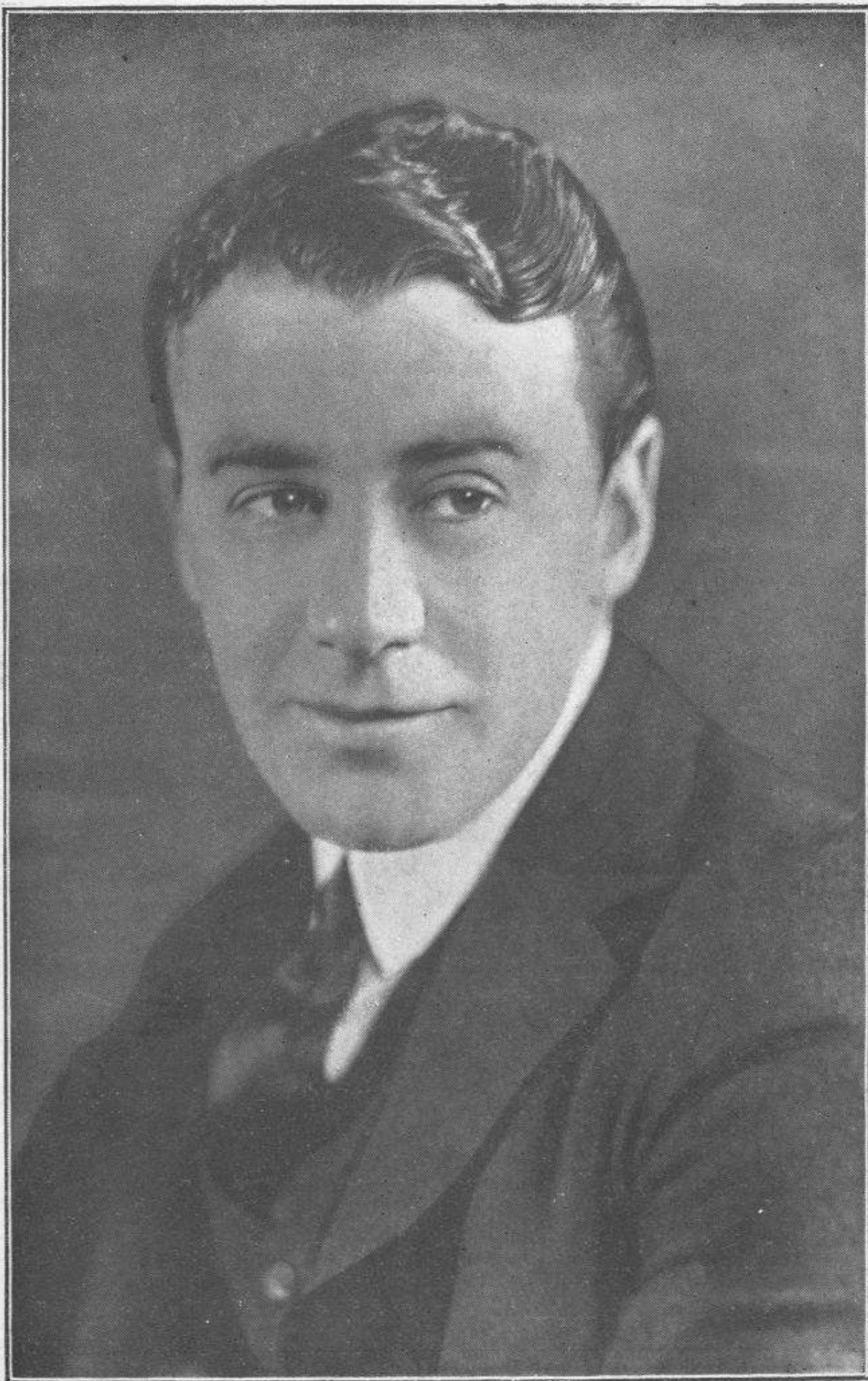
Uno de los últimos retratos de TOM MOORE