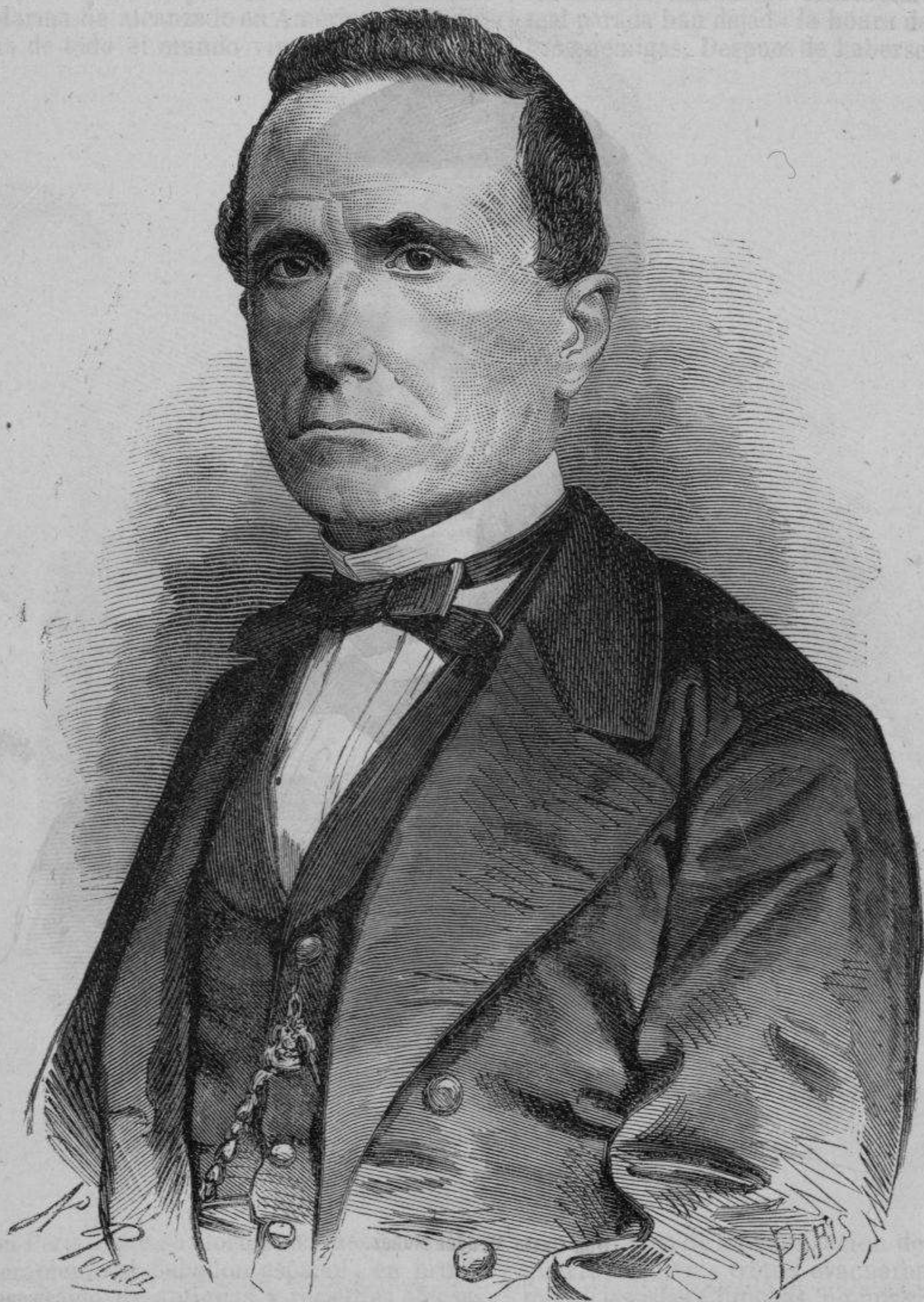
Don Cárlos Valcárcel.

de la fé de los peruanos. El Perú, envalentonado con este acto de cobardía, tuvo la insolencia de declarar la guerra á España, haciendo alarde de una firmeza cómica, de que