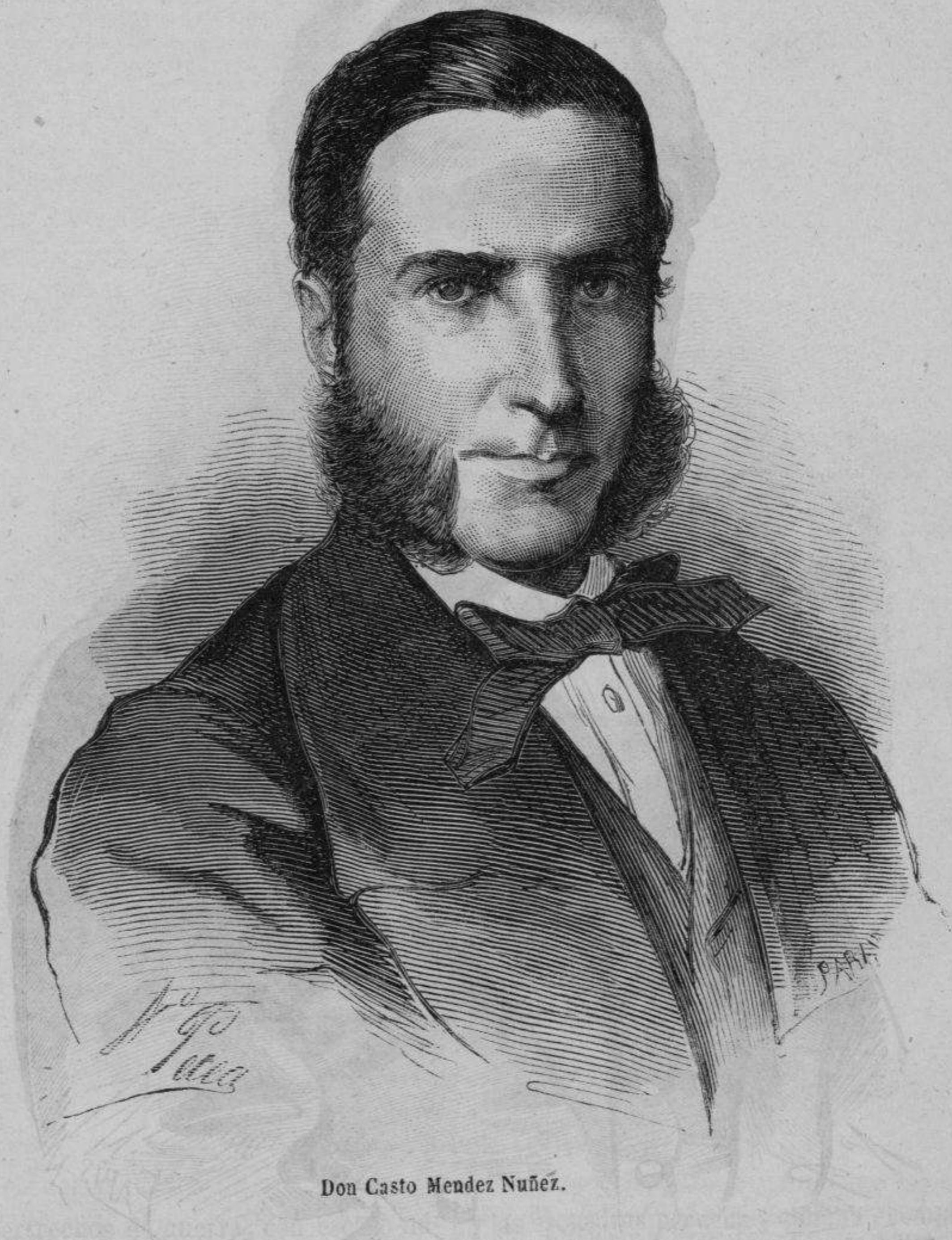
Don Casto Mendez Nuñez.

de la tripulacion, y entre ellos varios oficiales. No habia pasado mucho tiempo, cuando una turba de sicarios se arroja sobre nuestros indefensos marinos, al grito de «mueran los ladrones,» acometiéndolos á pedradas por las ca-