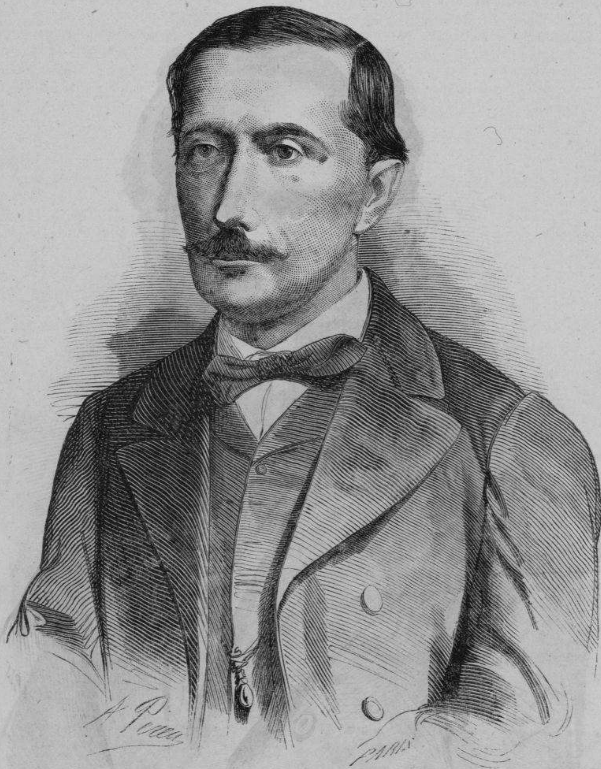
Don Juan Bautista Antequera.

Valparaiso, plenamente justificado, á consecuencia de no haber querido el gobierno de Chile devolver la Covadonga y los prisioneros, i hacer un saludo de 25 cañonazos á la bandera española, al cual debian contestar simultáneamente los nuestros, disparando el primero un fuerte de Valparaiso. La bandera chilena, que tremolaba en el de San Antonio, fue