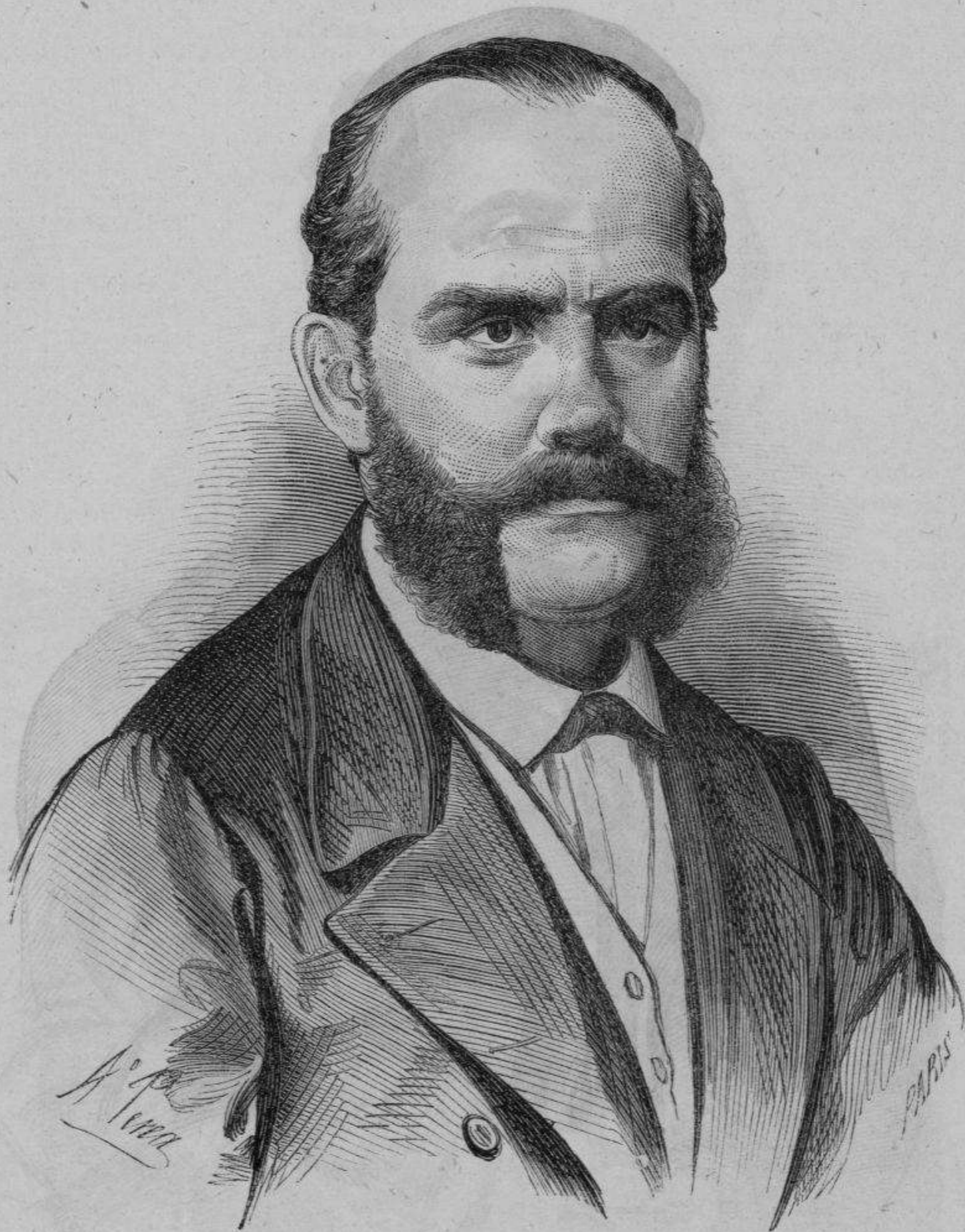
Don Juan Bautista Topete.

importancia de esta victoria de nuestros marinos; recuérdese que se hallaban á miles de leguas de distancia de la madre patria, rodeados de pueblos ú hostiles ó indiferentes, sin vive-