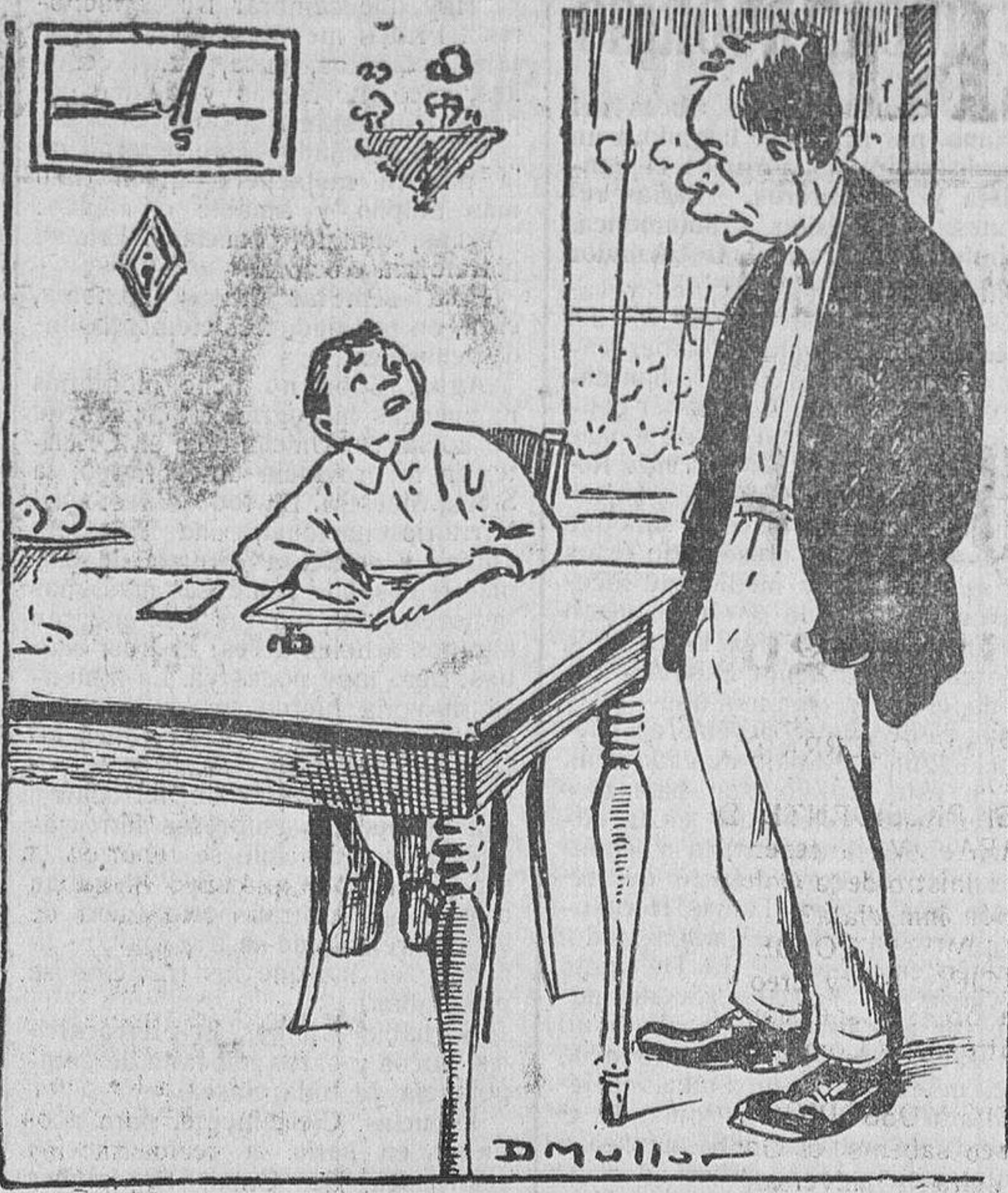
—Papá, ¿cómo se pone cerveza? —Hijo, en todas partes se pone con tapas...

El Ferrol.—Los submarinos "B-2" y "B-3" han comenzado los ejercicios de lanzamiento de torpedos, que durarán cuatro días.