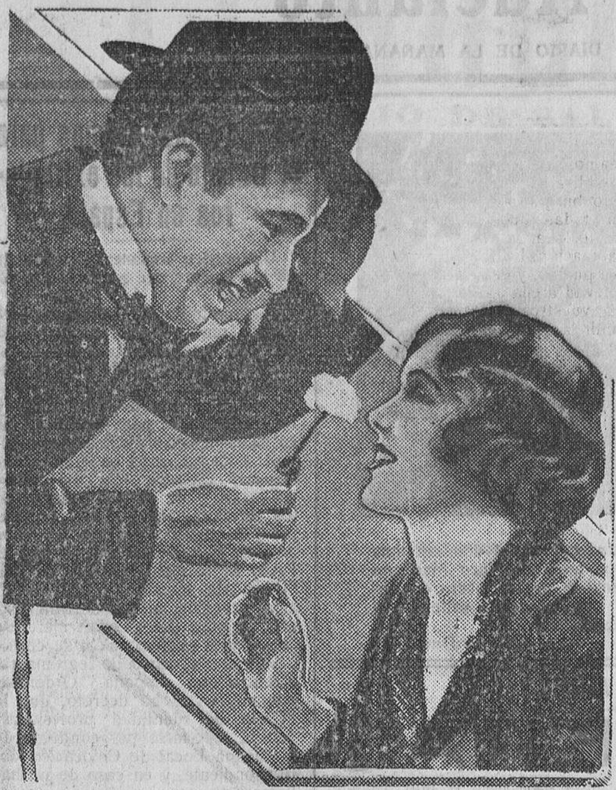
CHARLOT, el rey del humorismo, en una escena de su más portentosa creación 'LUCAS DE LA CIUDAD'...