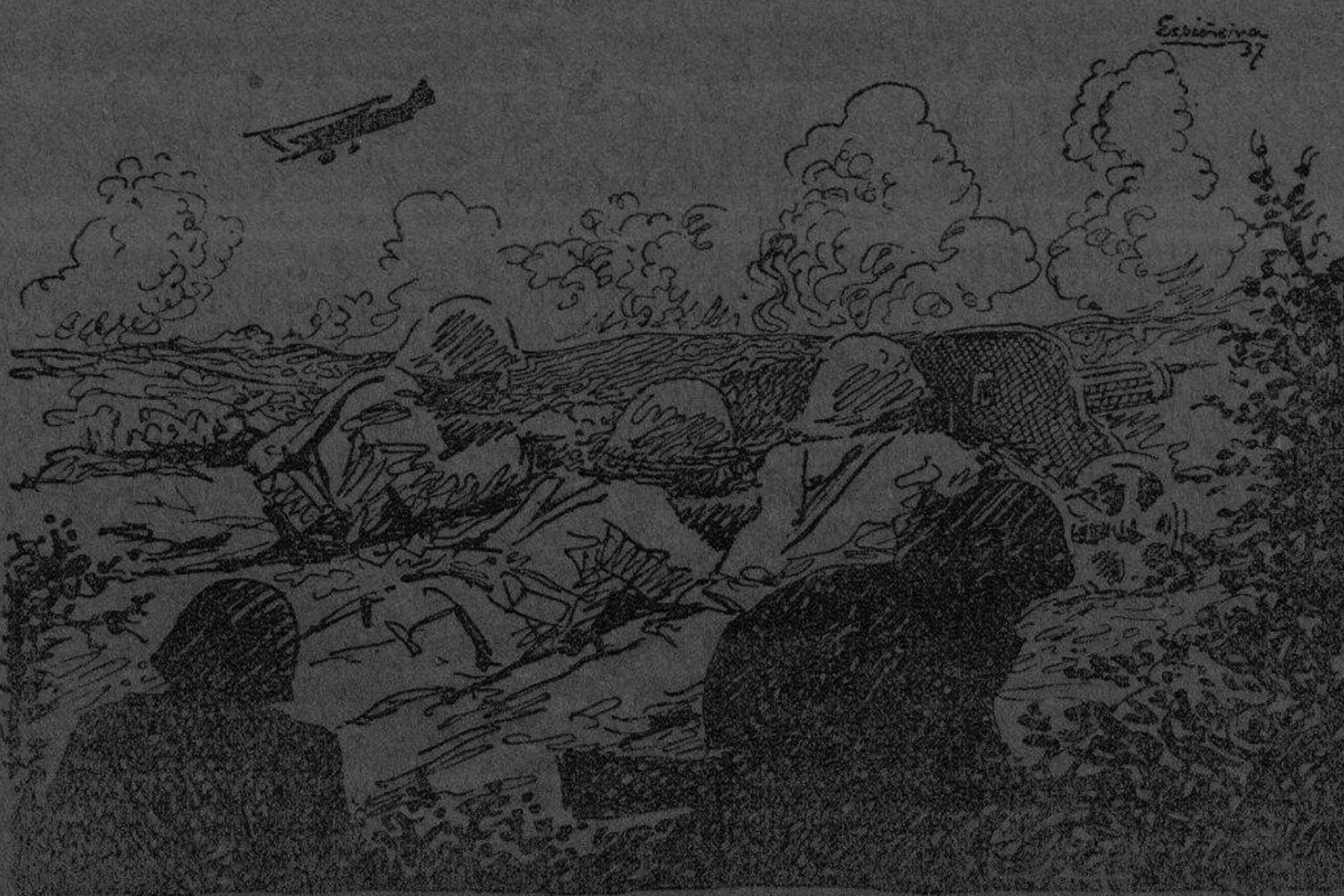
EL EJÉRCITO POPULAR CONQUISTA LA LIBERTAD