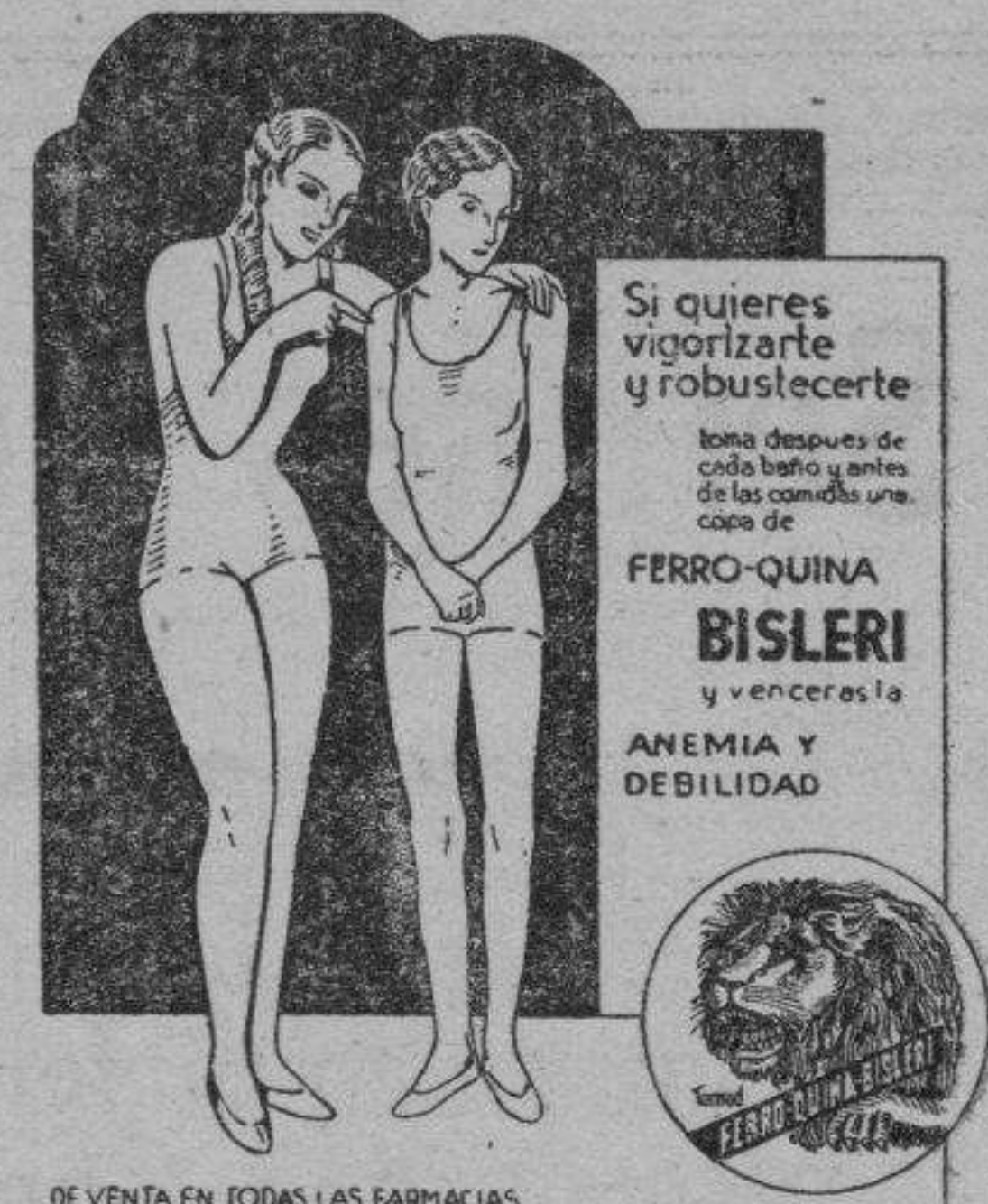
DE VENTA EN TODAS LAS FARMACIAS

Los donativos se reciben en la Mutualidad de Pescadores.