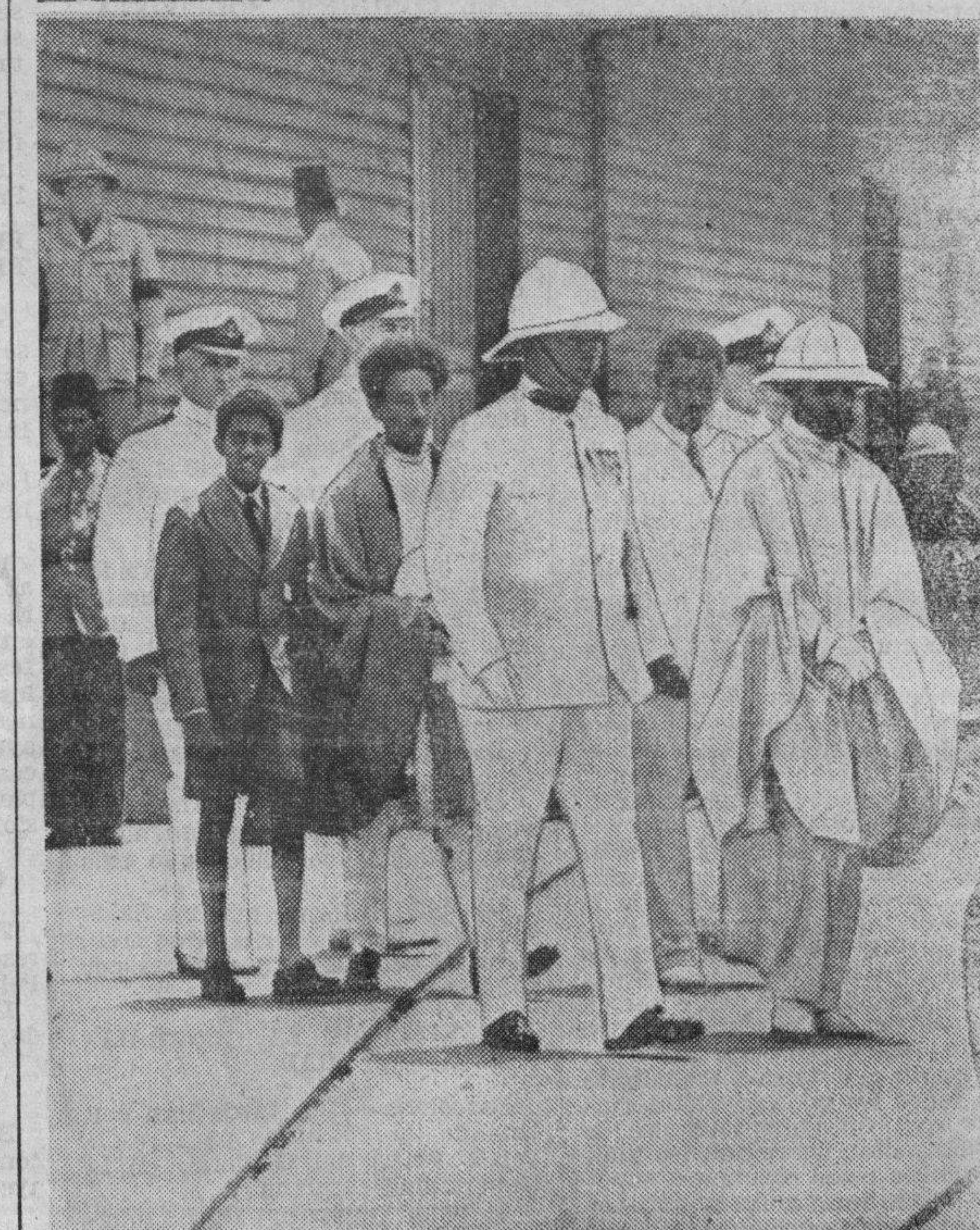
Helie Selassie, el rey sin patria, ni súbditos, fugitivo y triste. Acompañado de sus dos hijos, el duque de Harrar y el príncipe Makonen...