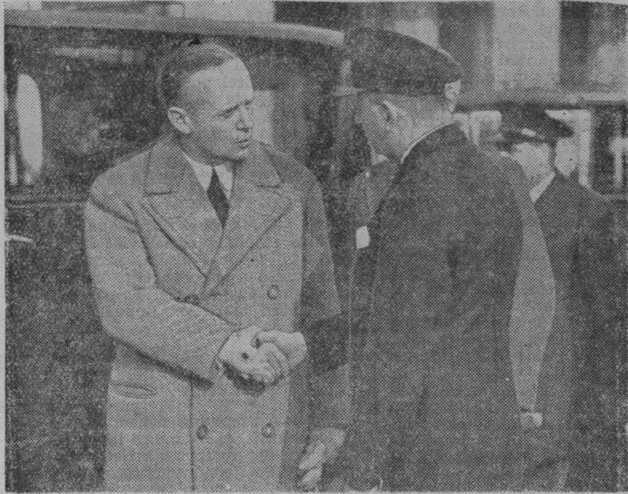
LAS NEGOCIACIONES ANGLO-ALEMANAS

Von Ribbentrop, embajador especial de Hitler, retratado en Londres