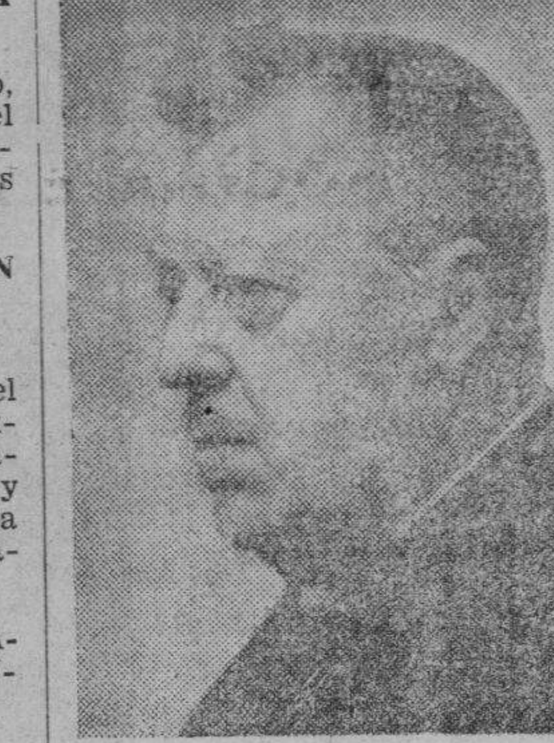
Dr. HUGO ECKENER