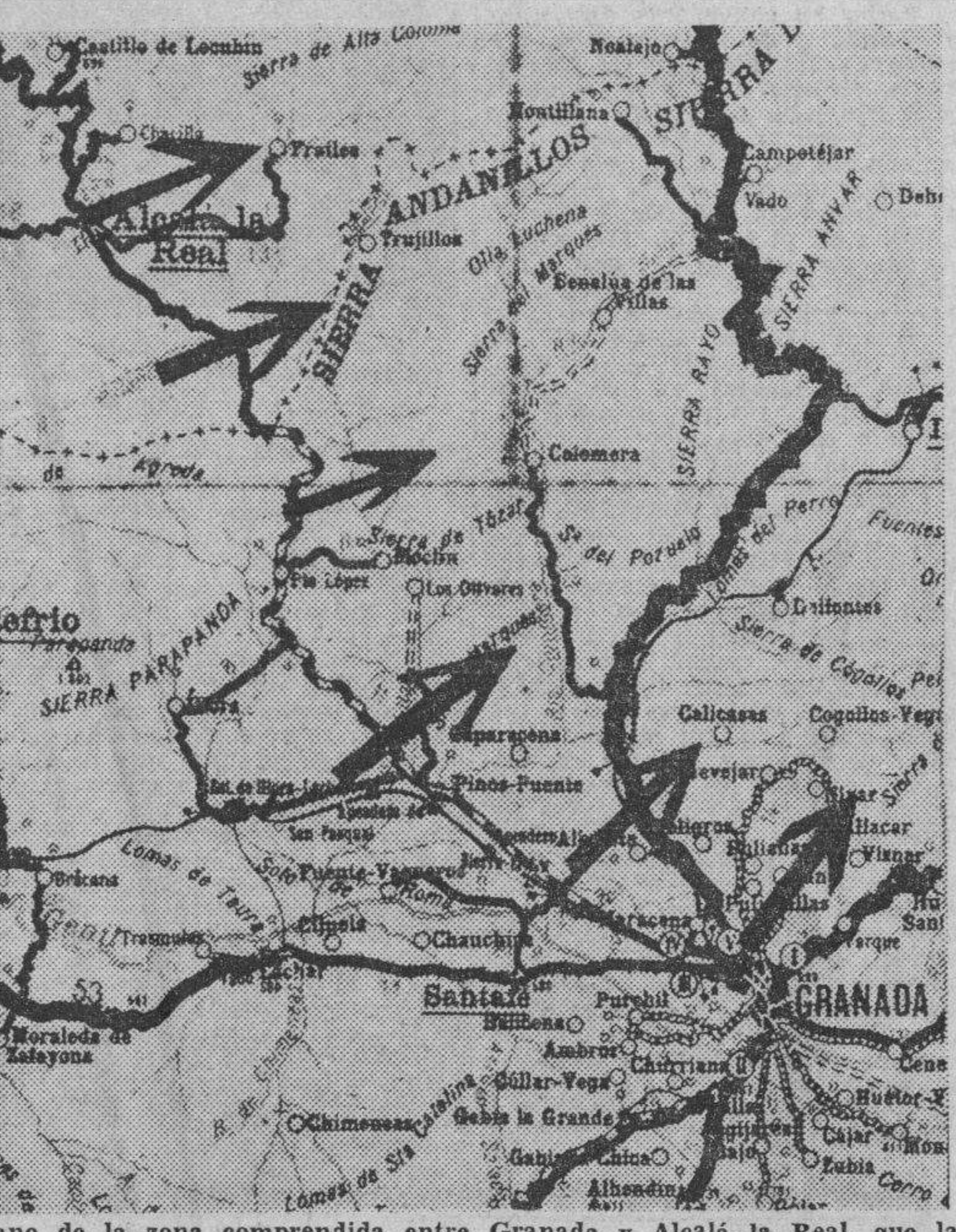
Plano de la zona comprendida entre Granada y Alcáiz de la Real, que la acometida nacionalista ha puesto de actualidad. Al nordeste del pueblo de Alcáiz de la Real, se encuentra el que lleva nombre de Frailes. Se responde a la Sierra de Alta Coloma, y cuyo pueblo ha sido capturado por las fuerzas del Ejército de Andalucía. La primera flecha o superior, señala el pueblo citado, y las siguientes indican la situación aproximada de las fuerzas que mantienen libre el recorrido de Granada a la dirección de Jaén, por la carretera de Alcáiz de la Real. (Véanse «Comentarios de la guerra» en la última página).

Los electores de las regiones de Zara, Zagora y Chaumen debían elegir 47 diputados entre 350 candidatos que estaban inscritos. Los candidatos deben reunir más de un tercio de las votaciones en cada colegio. Los electores mostraron gran entusiasmo, particularmente las mujeres, cuyo voto es obligatorio desde ahora.