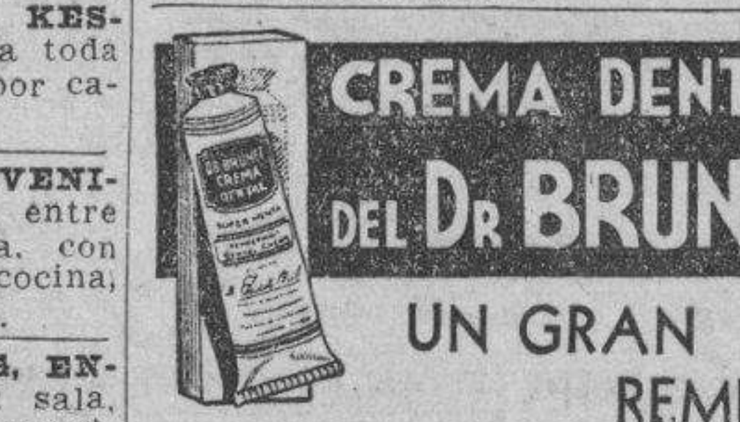
UN GRAN REMEDIO PARA LAS ENCIAS SANGRANTES E INFLAMADAS