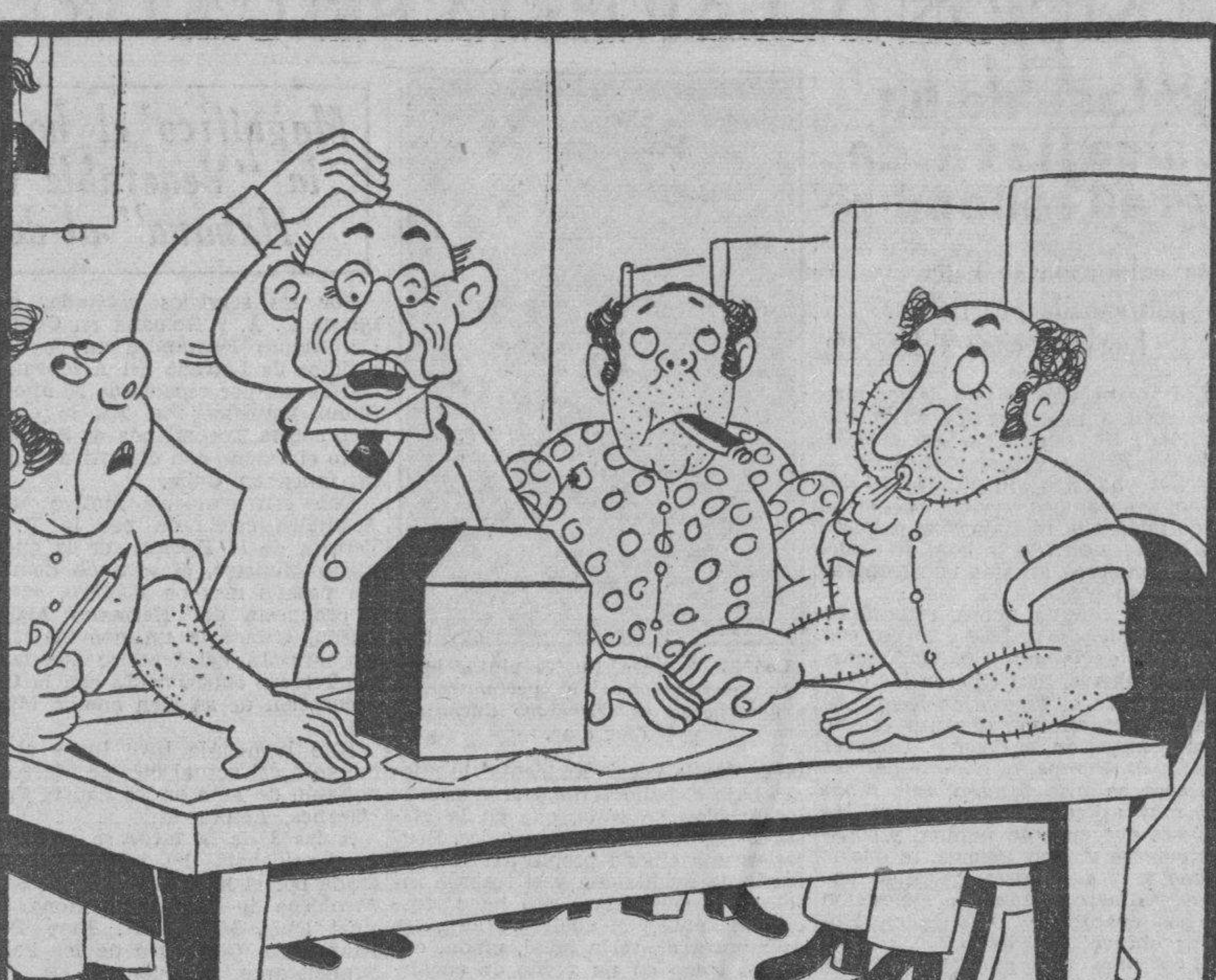
EL PRESIDENTE DEL COLEGIO:—¿No me explico cómo aparece aquí que ha votado el doscientos por ciento de los electores?