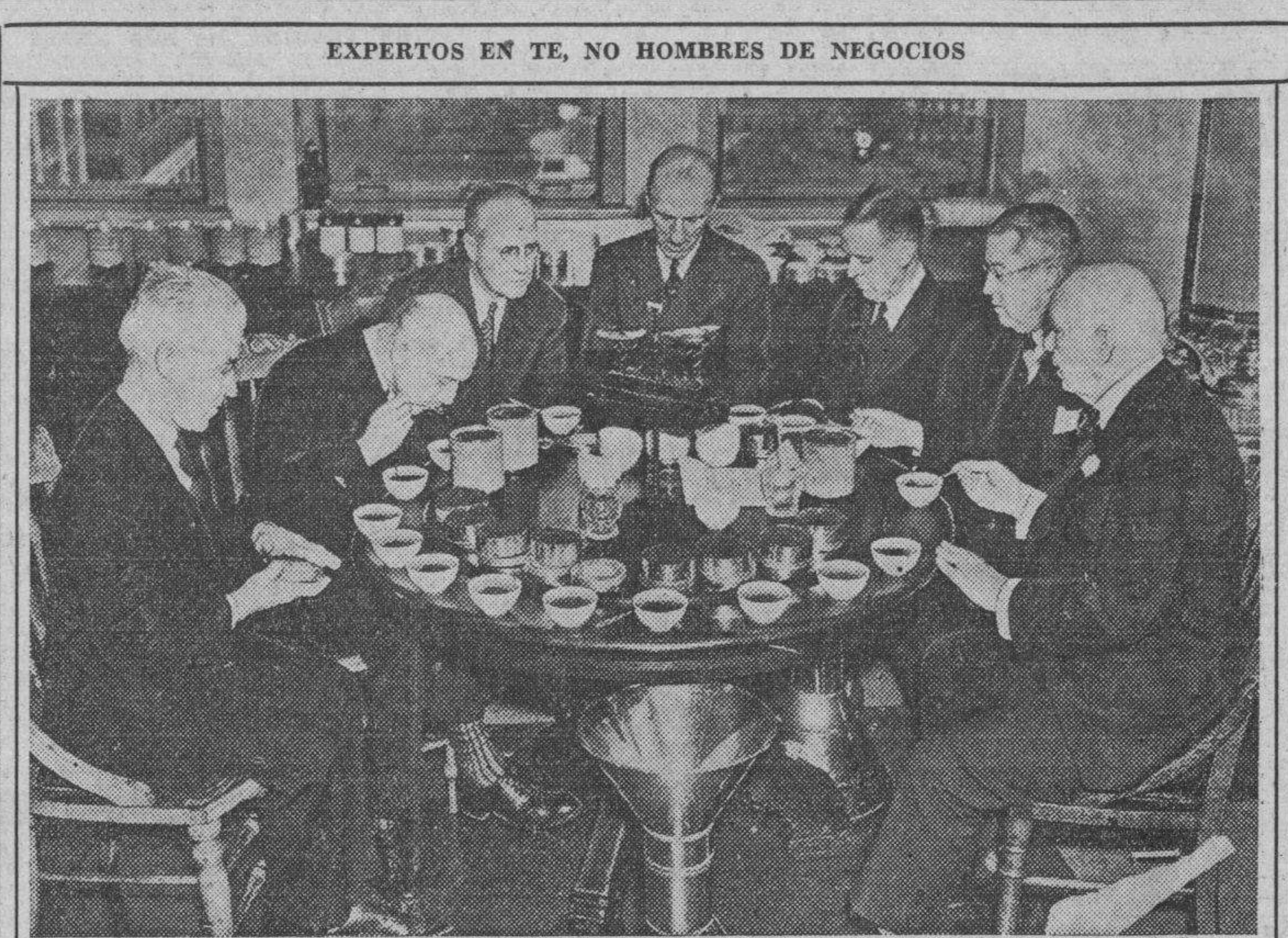
No se trata de una sesión de hombres de negocios discutiendo la crisis económica, sino de una reunión de siete expertos en te que dictaminan en Nueva York las bondades de distintas marcas del célebre producto asiático.

Las reservas, sin embargo, son germanas, y se teme que en caso de invasión se pasen a manos alemanas. «El país es vulnerable desde el aire y se dice que antes de que Checoslovaquia pudiera ser auxiliada por sus aliados, Alemania podría destruir sus bases principales».