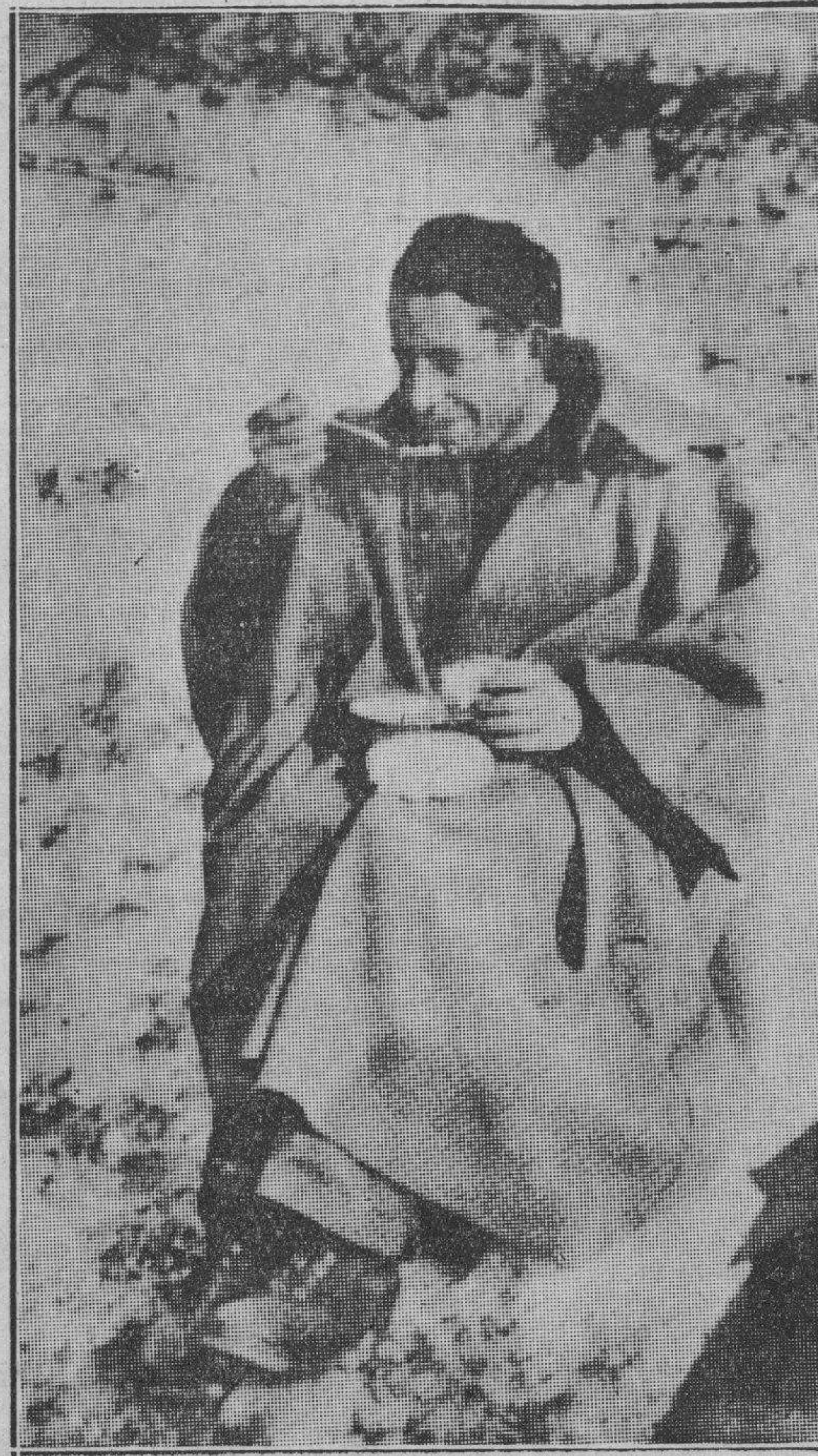
El grueso capote y los recios zapatos no bastan cuando se está sentado sobre la nieve y el fino viento de las altas sierras azota el rostro; por eso la comida sabrosa y caliente es saboreada con fruición por el combatiente español...