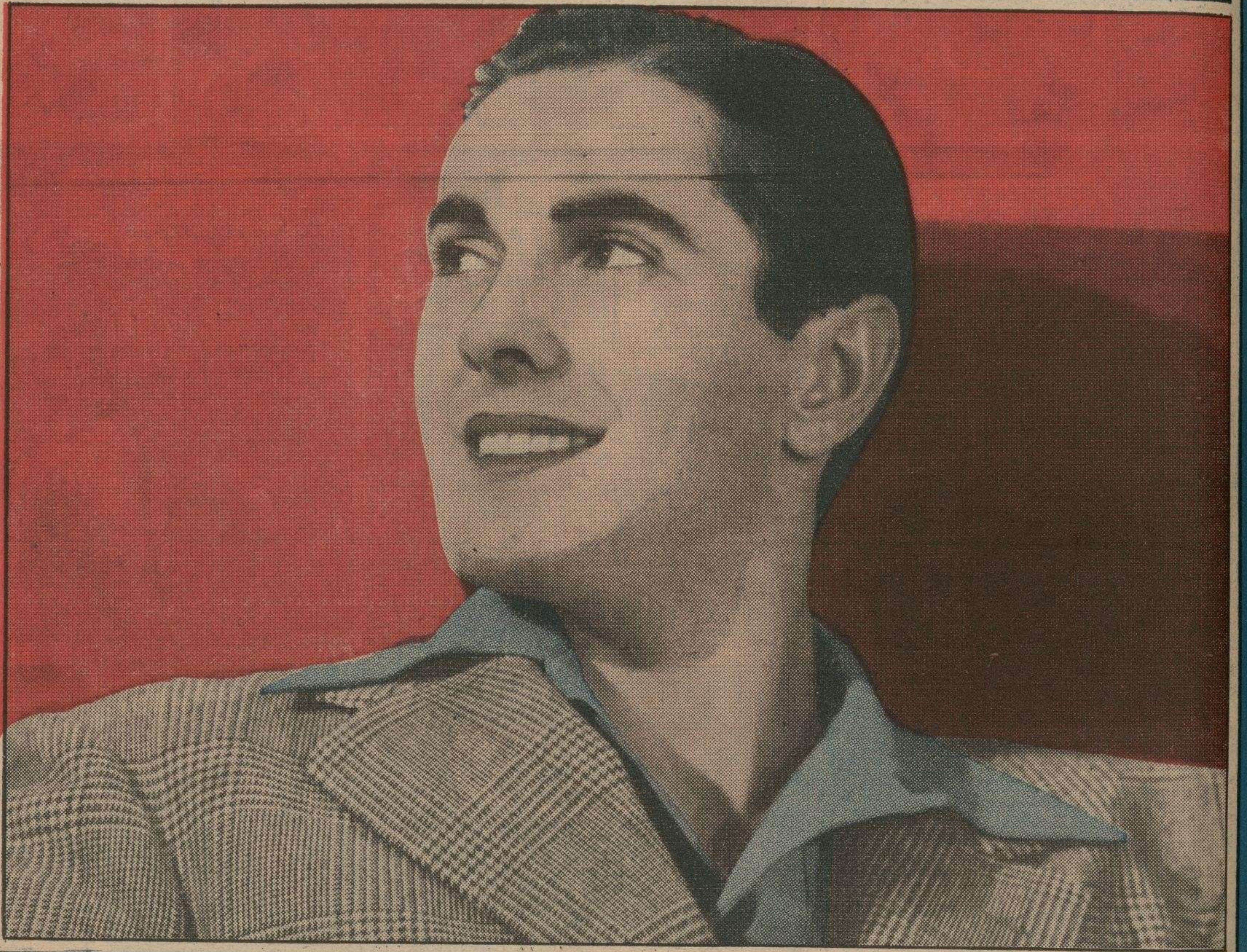
Dos de los galanes que gozan de mayor popularidad entre las mujeres del mundo entero: arriba, James Stewart, de los elencos de Metro, y abajo, Tyrone Power, de Twentieth Century-Fox. Stewart aparece en las cintas "Nacida Para el Baile" y "Séptimo Cielo"; Power brilla a gran altura en la película "Café Metropole".