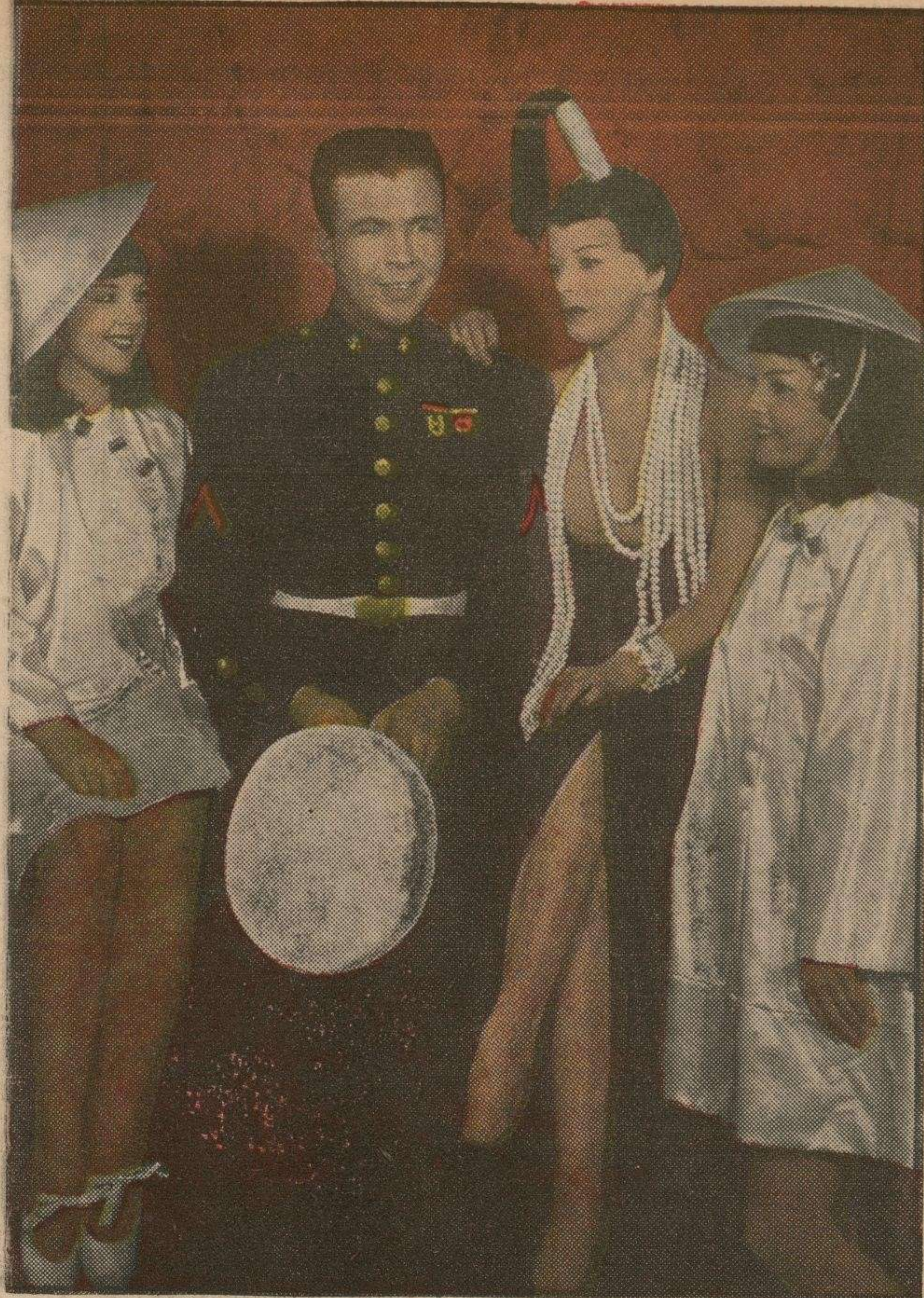
Coristas cosmopolitas de los Estudios Warner que contribuyen al éxito espectacular de la cinta "Marinero Cantante" con Dick Powell en el papel estelar