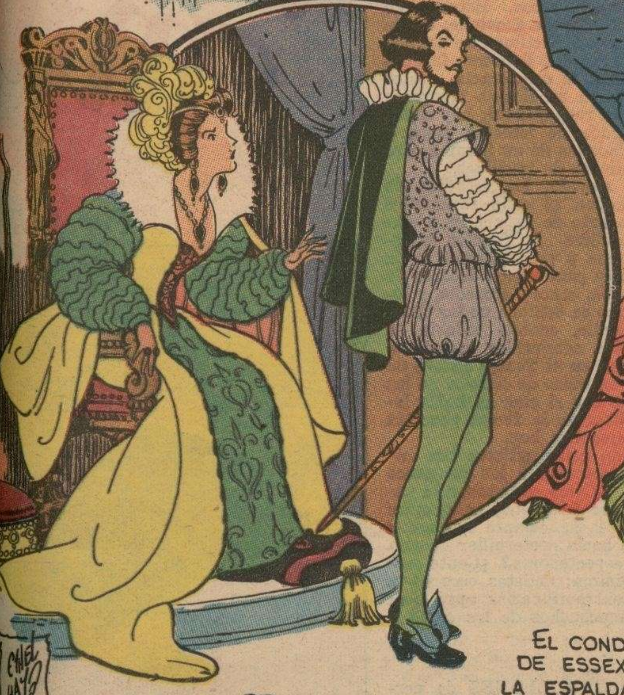
EL CONDE DE ESSEX LE VOLVIÓ LA ESPALDA A LA REINA - Y ELLA LO ABOFETEO.