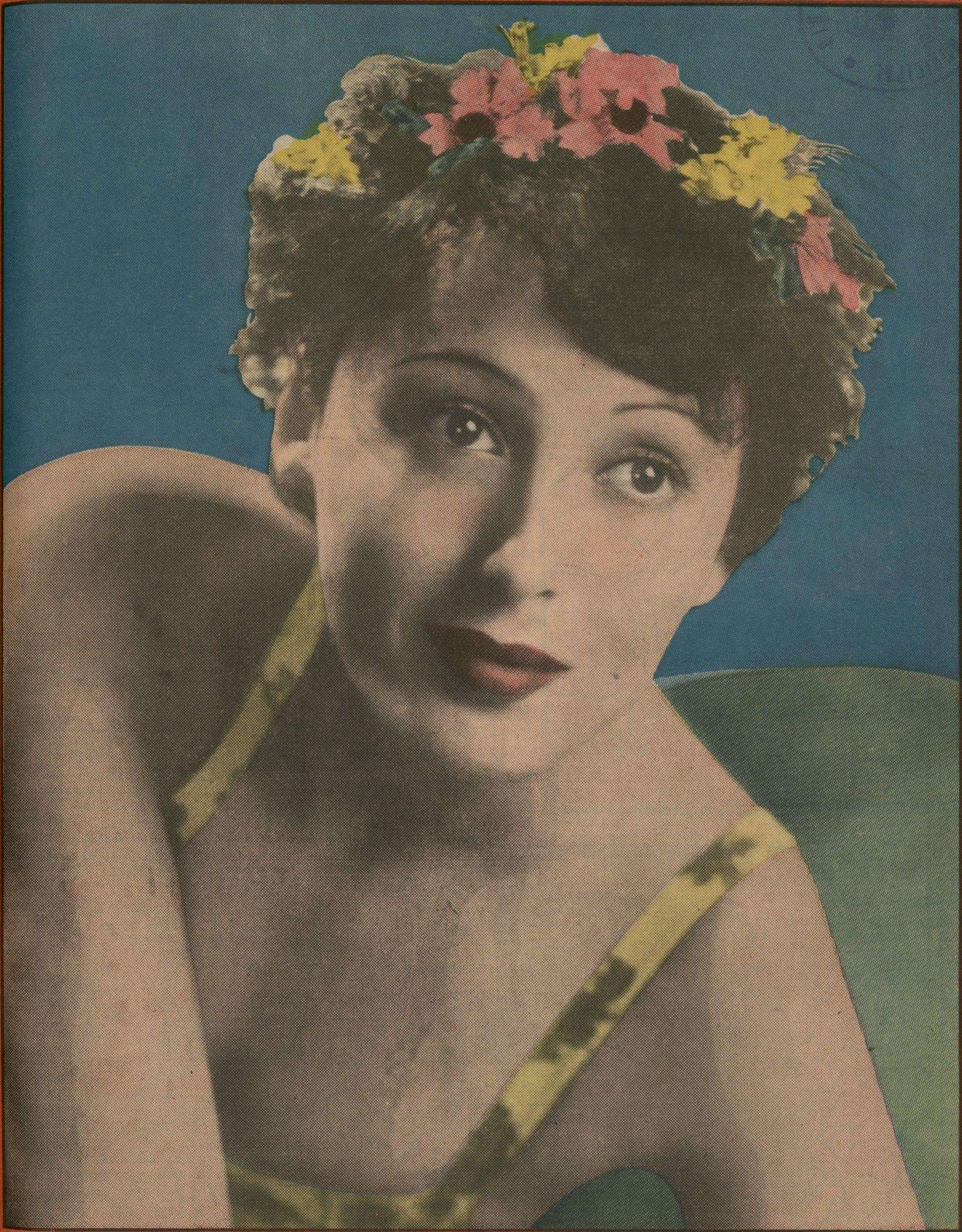
Luise Rainer, brillante actriz austriaca y figura estelar de la película "La Buena Tierra", a quien la Academia de Artes Cinematográficas ha reconocido como la primera intérprete del cinema en el 1936. En la página 8 de esta edición publicamos un interesante artículo sobre la leyenda de la Rainer