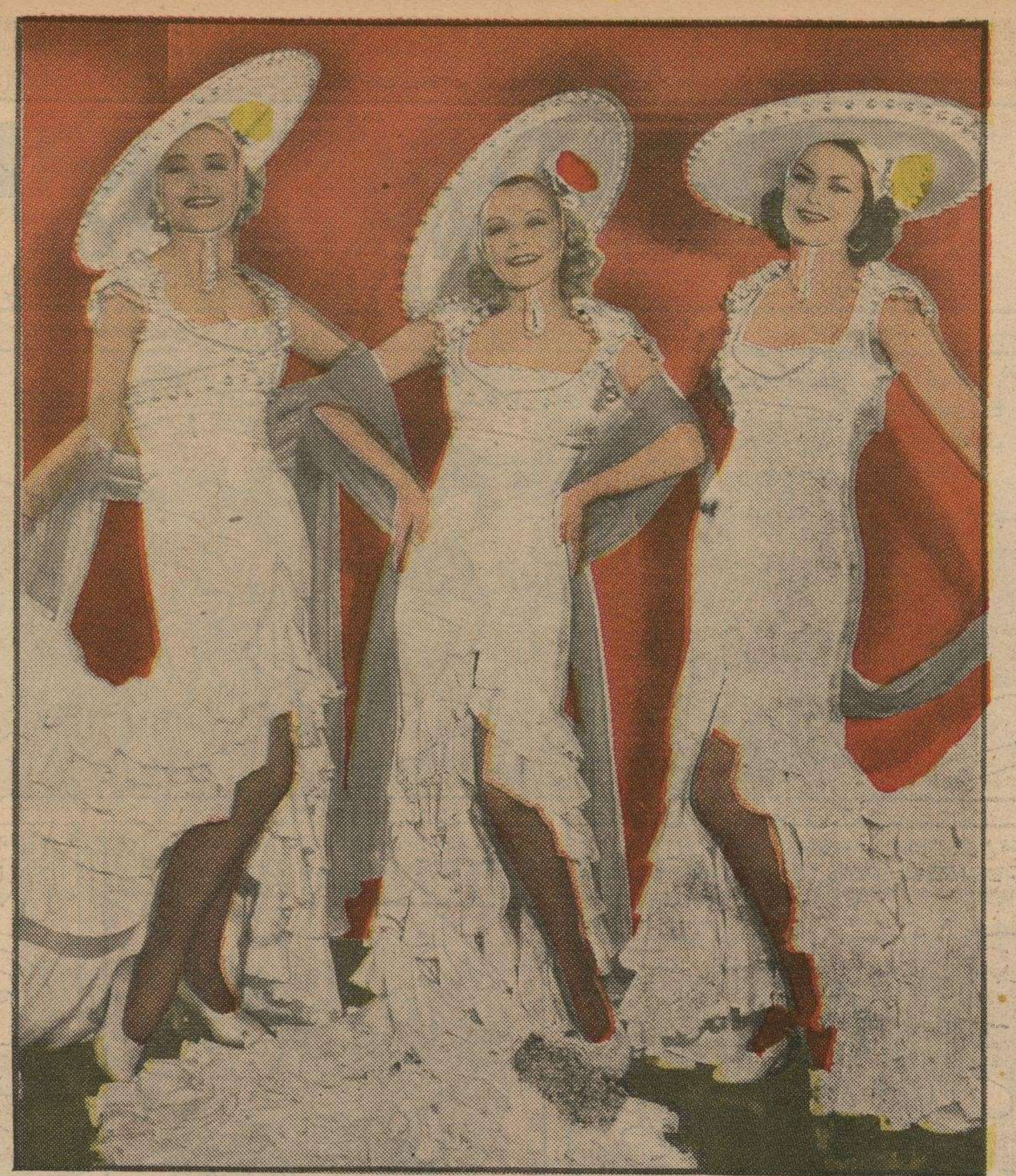
Las ve usted sonrientes y satisfechas en los bailables más fastuosamente presentados, pero les duele el corazón de tanto esperar la llegada de la gloria. Nadie concibe que estas muchachas puedan servir para otra cosa que para bailes de rutina.