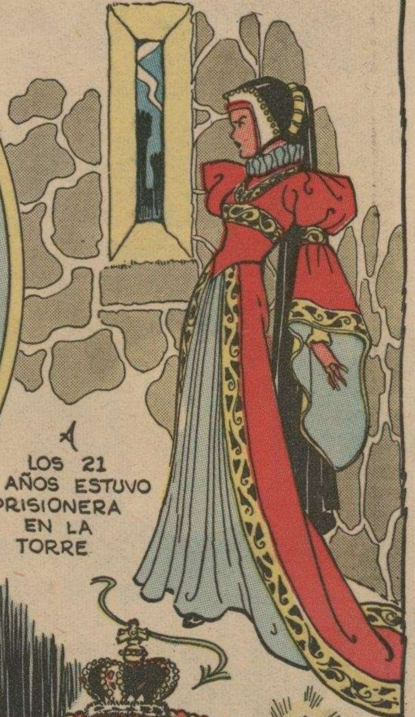
A LOS 21 AÑOS ESTUVO PRISIONERA EN LA TORRE