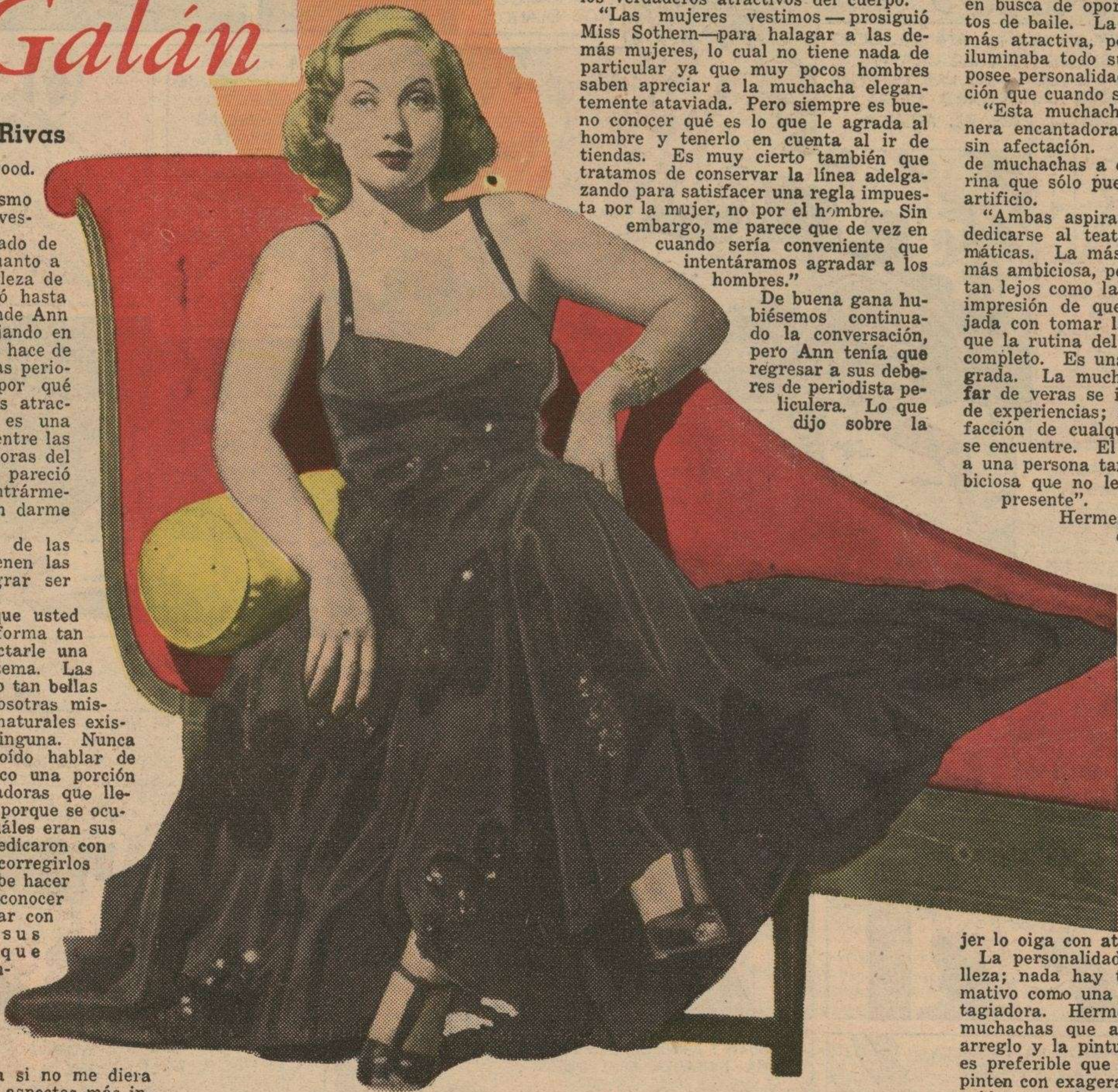
Ann Sothern, una de las estrellas más fascinadoras de Hollywood, recomienda destacar los aspectos interesantes del rostro femenino.

¿Cuántas mujeres están preparadas para que se las analice sin previo aviso? Aún las más jóvenes tienen que estar siempre alerta y cuidarse constantemente de la presencia y de los modales. No basta tener facciones bonitas si se masca chicle desafortadamente; la ropa más elegante puede quedar deslucida por las formas groseras; hay que saber conducirse y aprender a expresarse con soltura y propiedad. ¡En otras palabras; hay que ser armónicas de espíritu y de cuerpo!