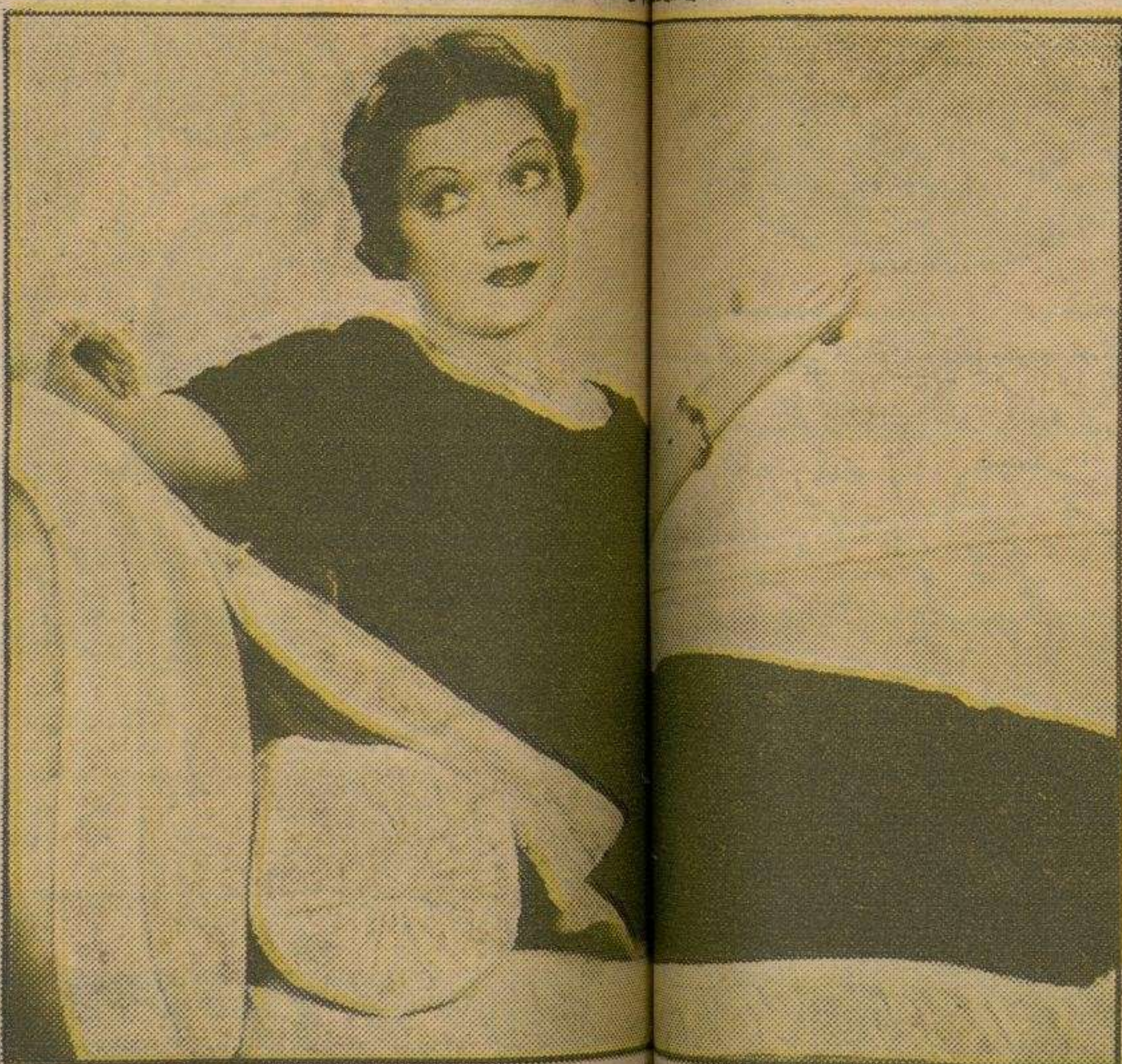
Bill Robinson, maestro del baile, y Geneva Sawyer (arriba) es la mejor bailarina de Hollywood. Robinson conoce a

ría de los ejércitos y las tendencias individualistas de los ciudadanos. Cada día que pasa nacen cientos de personas con aptitudes para las tablas y especialmente para el género de variedades, pero ya no existen teatros que las empleen porque los teatros se dedican al negocio redondo y lucrativo de explotar el cine.