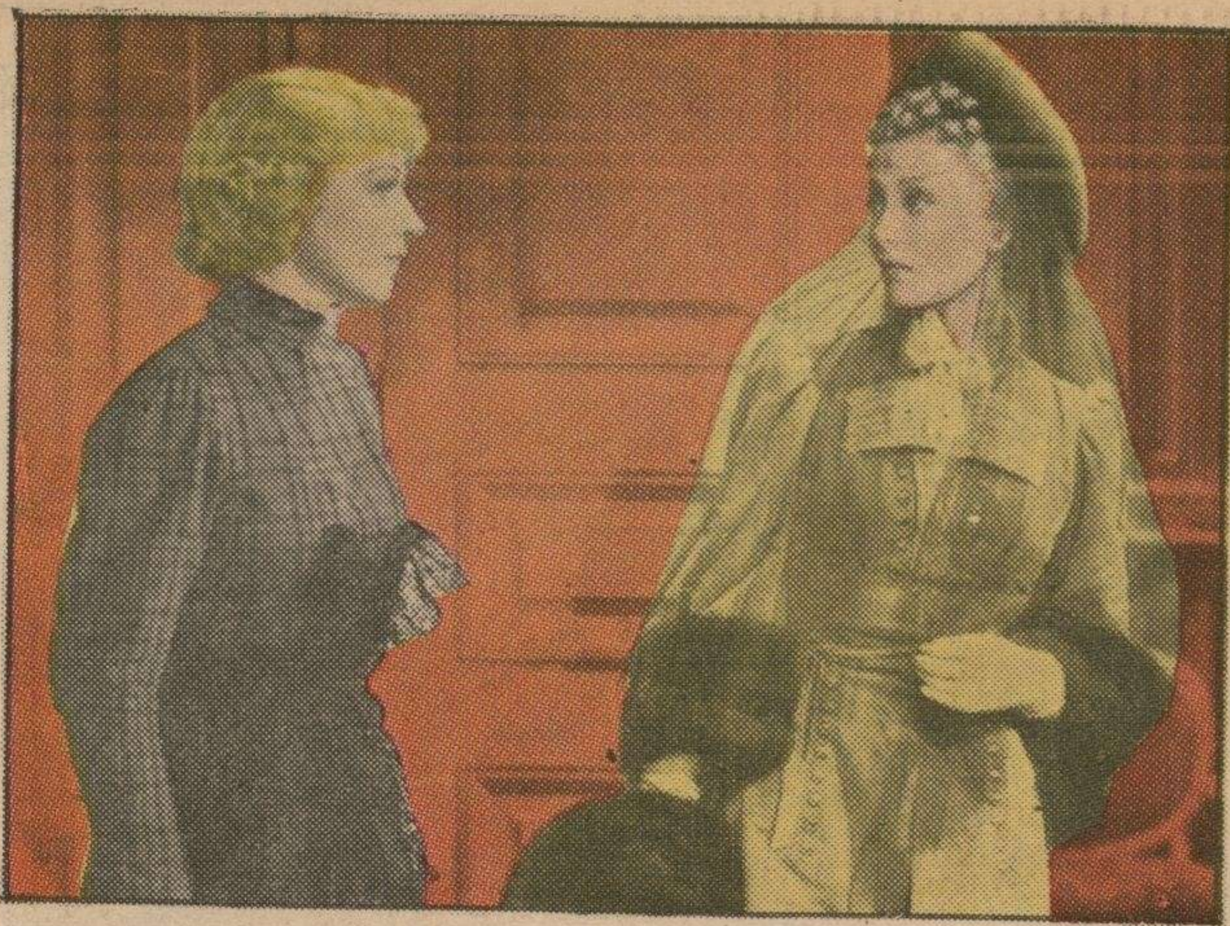
Luise Rainer luciendo el peinado de cerquillos que quería descartar después de diez días de trabajo en una película de la Metro.