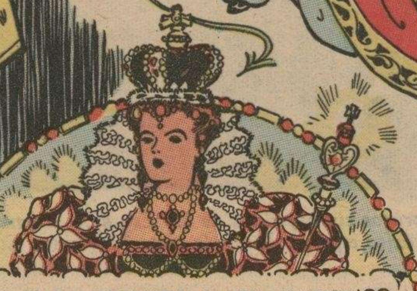
PERO FUE CORONADA A LOS VEINTICINCO