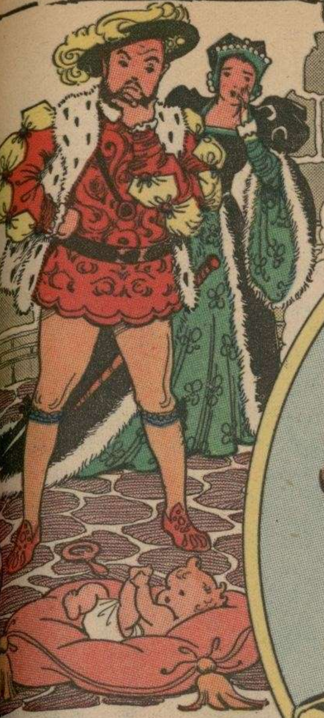
ENRIQUE VIII Y LA REINA ANA SE DISGUSTARON PORQUE SU ISABEL NO FUE HOMBRE.