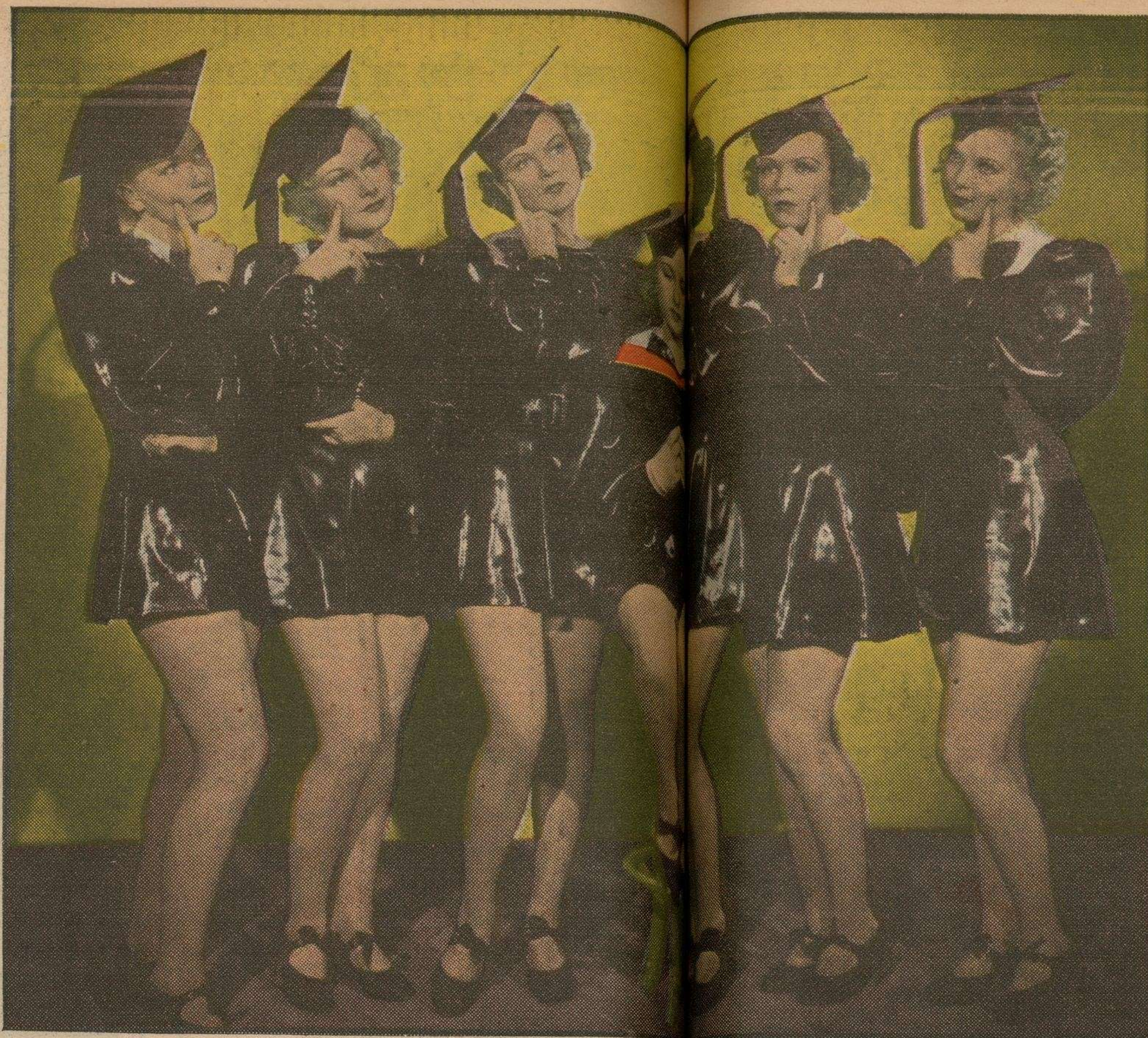
Estas hermosas chicas de la farándula hollywoodiana a ser Garbos o Crawfords en los coros.