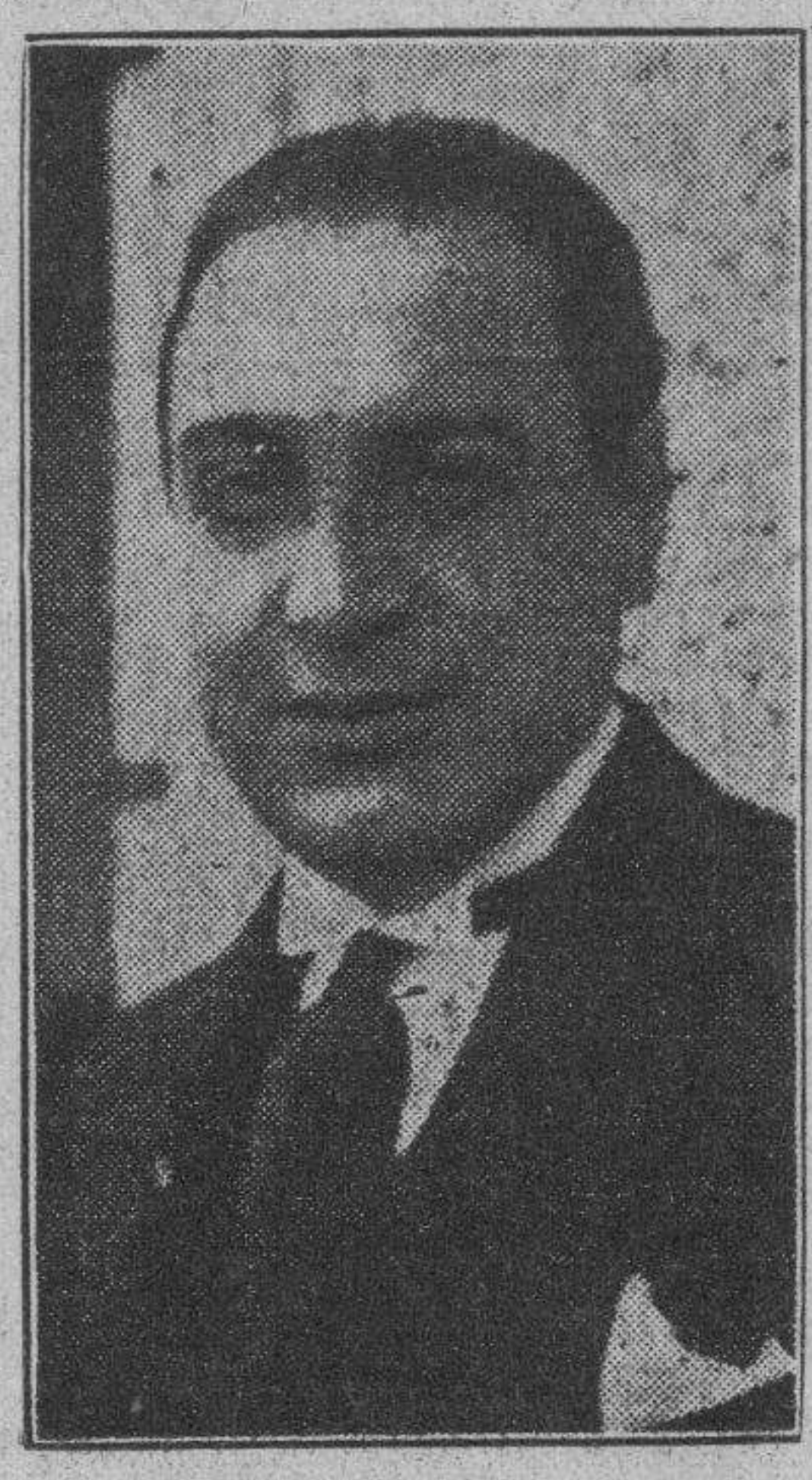
Luis Jiménez Asúa

MADRID, noviembre 29.—S. T.—El catedrático don Luis Jiménez Asúa ha presentado la dimisión de su cargo de vocal del Consejo Superior de Cultura. Al efecto, ha redactado un oficio dirigido al ministro, en el que manifiesta su propósito de dejar dicho cargo y ex-