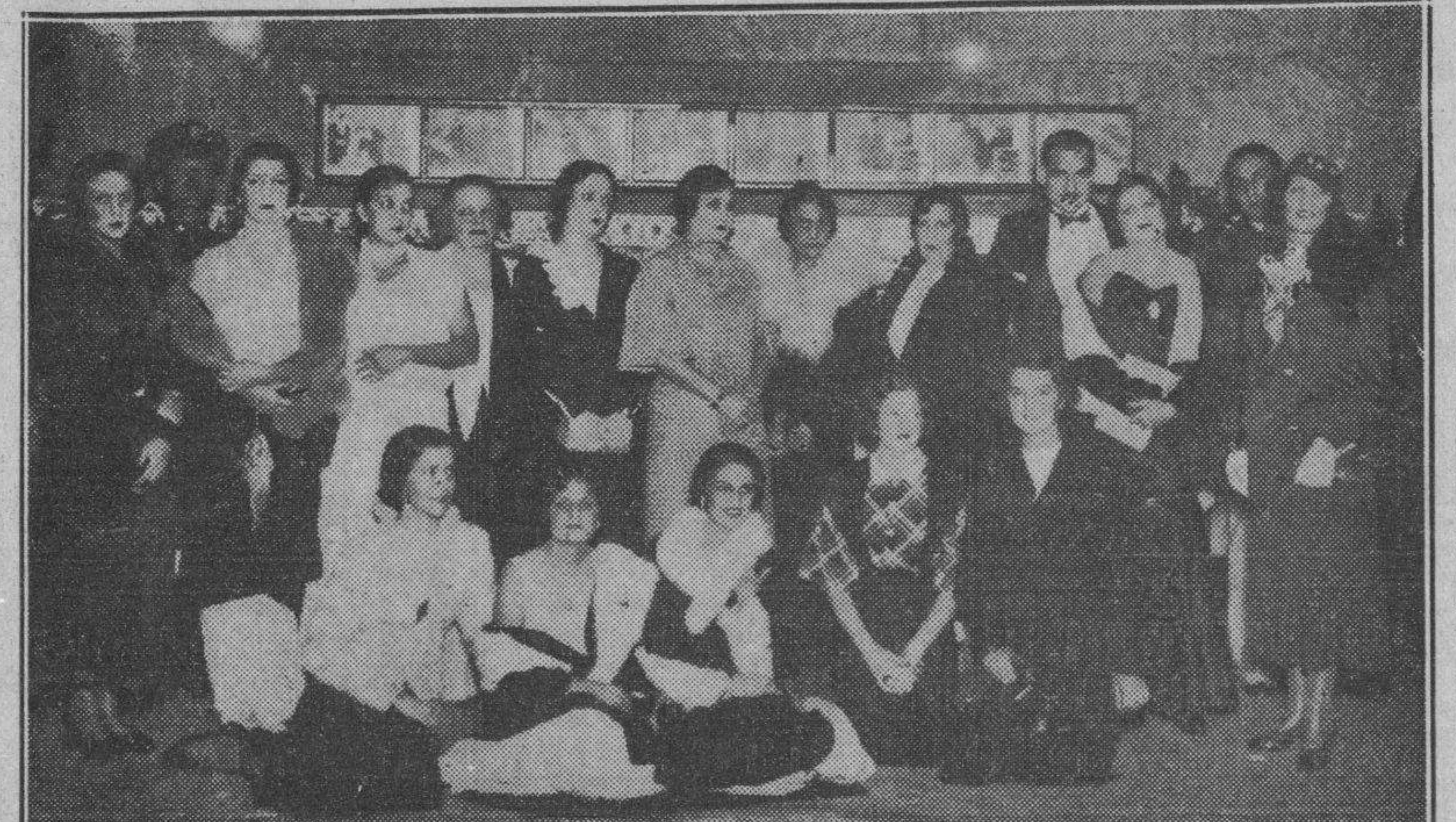
Un aspecto de la concurrencia