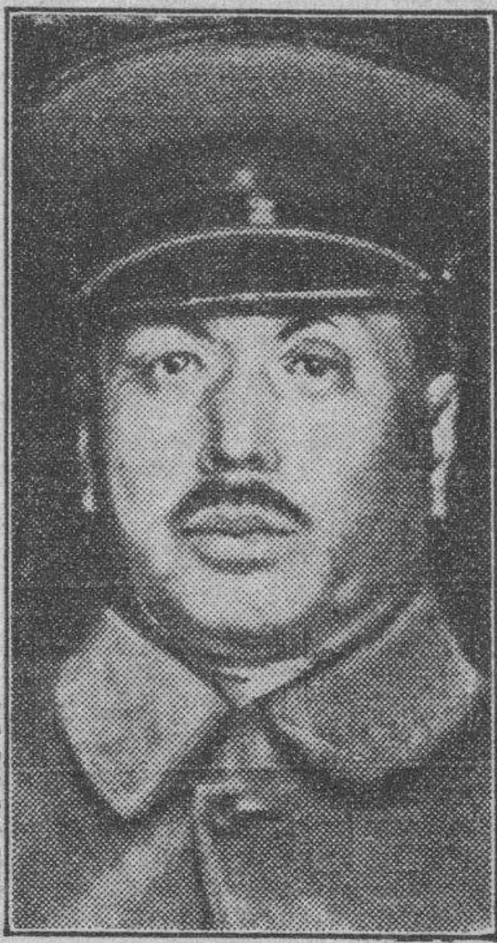
General Hoshinori Shirakawa

SHANGHAI, mayo 23. (US.)—El general Hoshinori Shirakawa, jefe supremo del Ejército japonés, falleció hoy a consecuencia de una hemorragia interna producida por las heridas que recibió el «Día del Emperador» en que hizo explosión una bomba en Hong Kew Park.