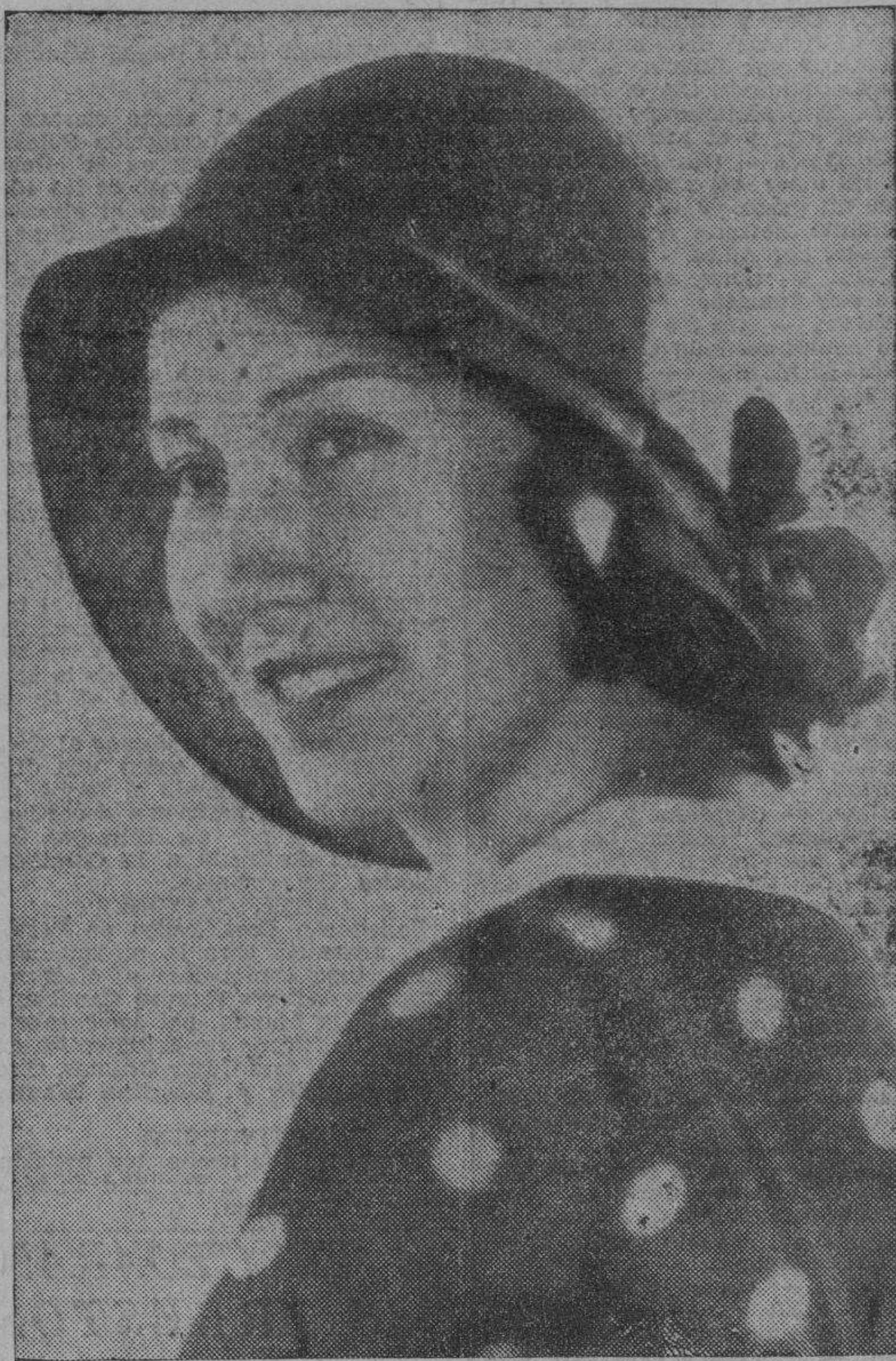
EN LA PLAYA