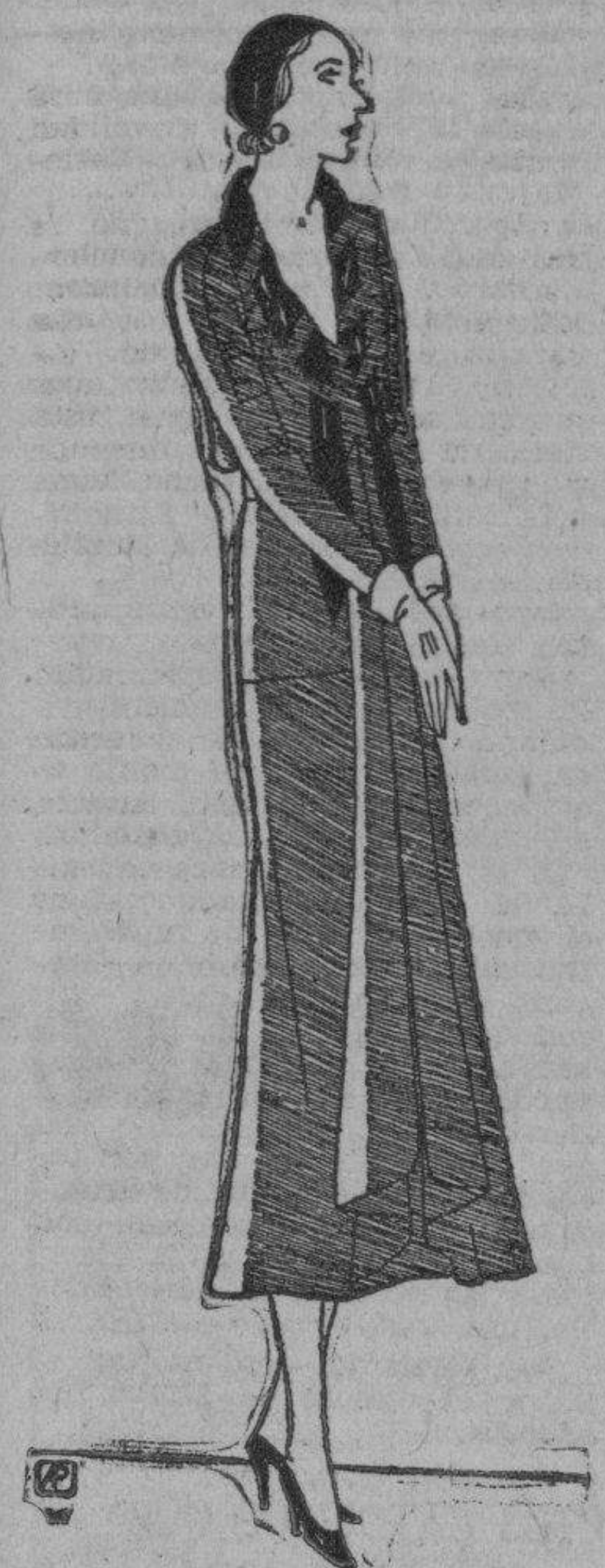
sencillo y elegante modelo de Es. tación.

Secretos de una Parísien :— Conócete a tí misma