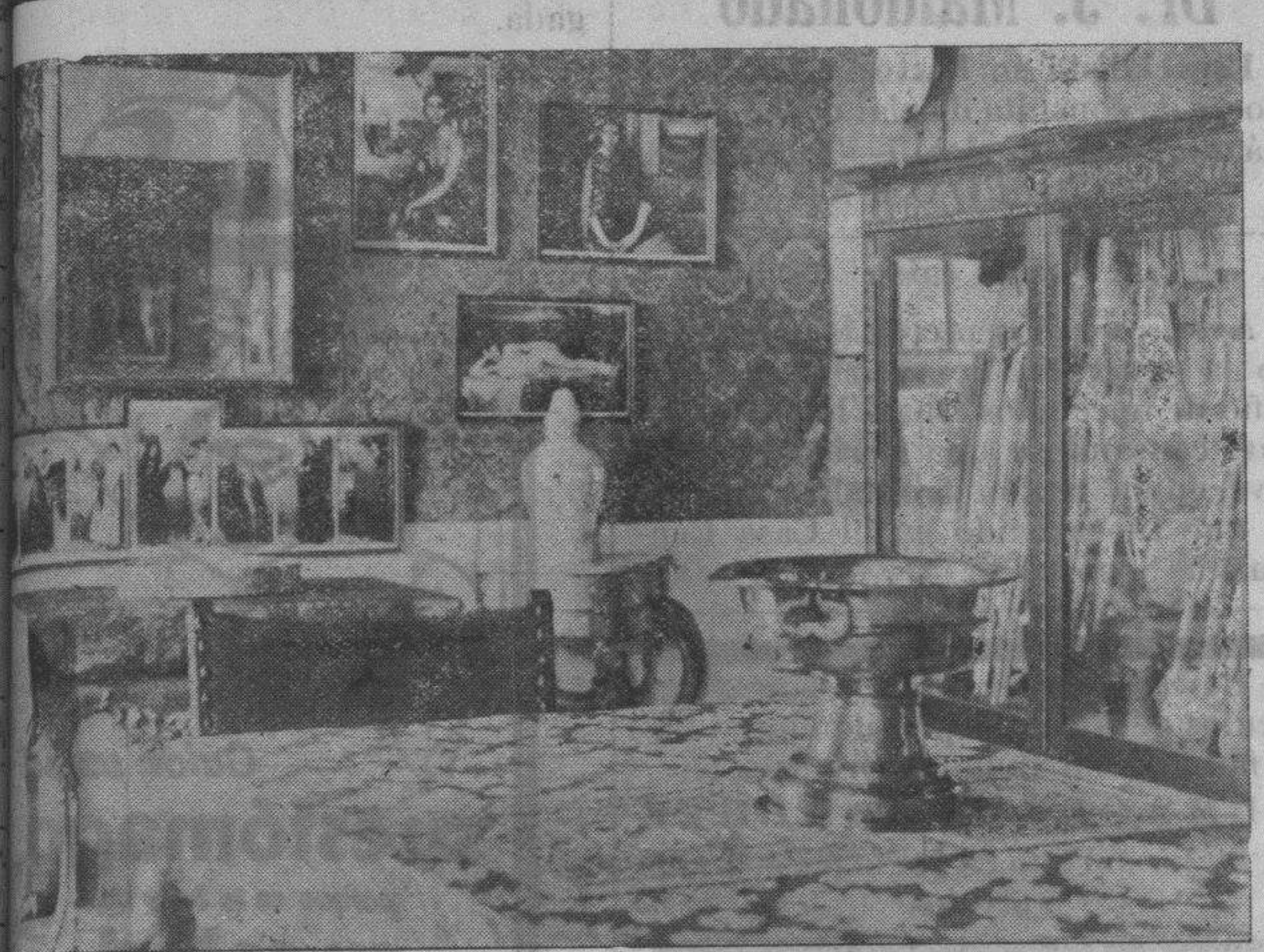
Sala baja del Museo Julio Romero de Torres