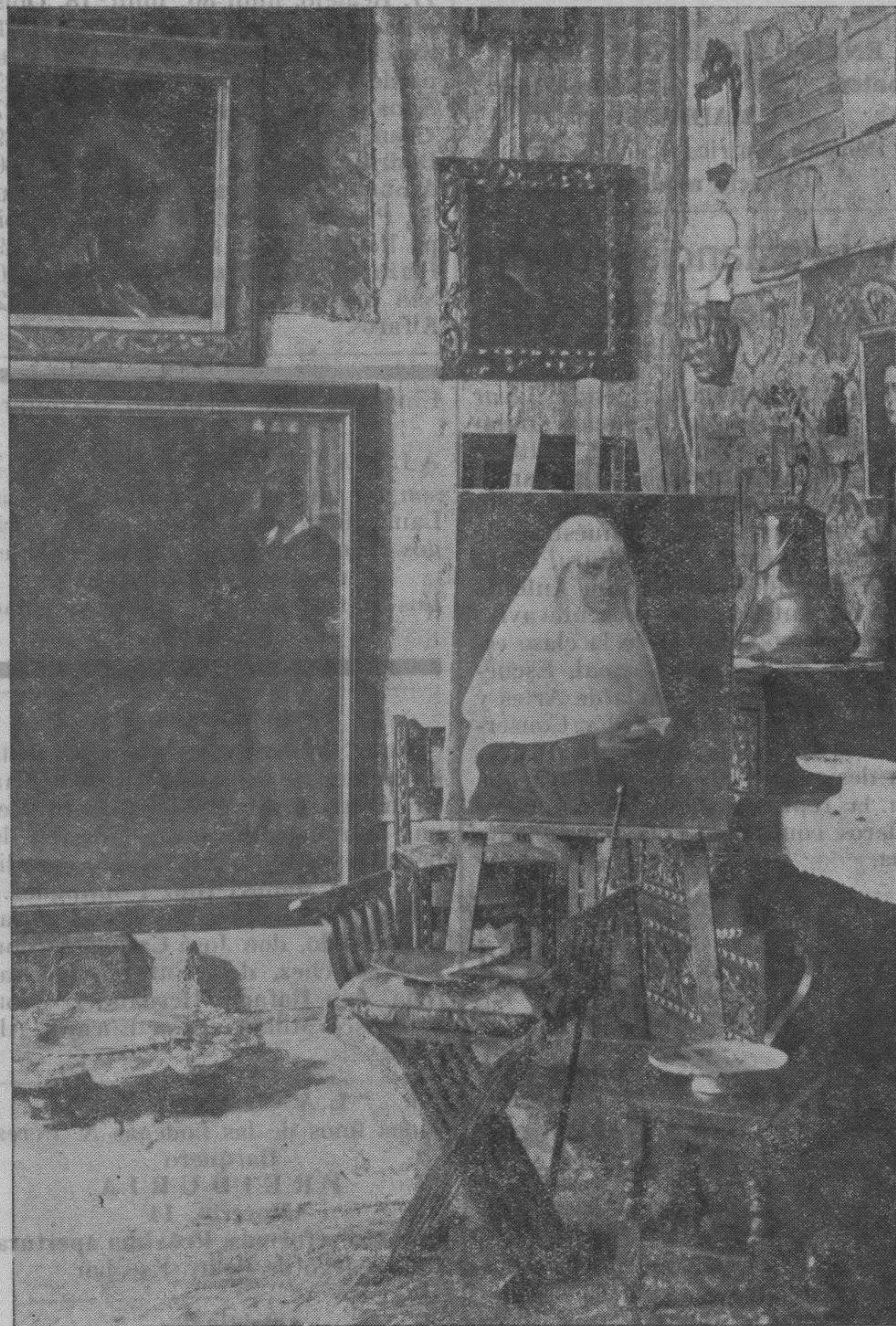
Reproducción del estudio que Julio Romero de Torres poseía en Madrid

Córdoba se siente orgullosa de poseerlo y acaba de contraer una deuda de inmensa gratitud con la viuda, y con los hijos del glorioso pintor, por su magna ofrenda.