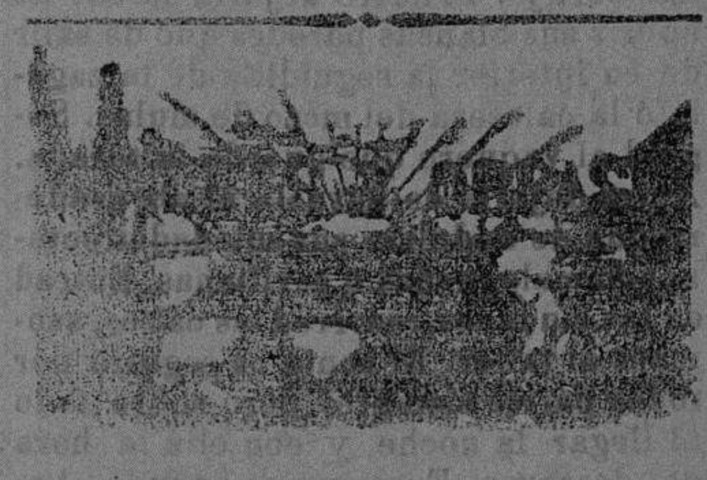
EL ALMIRANTE JURIEN LA GRAVIERE