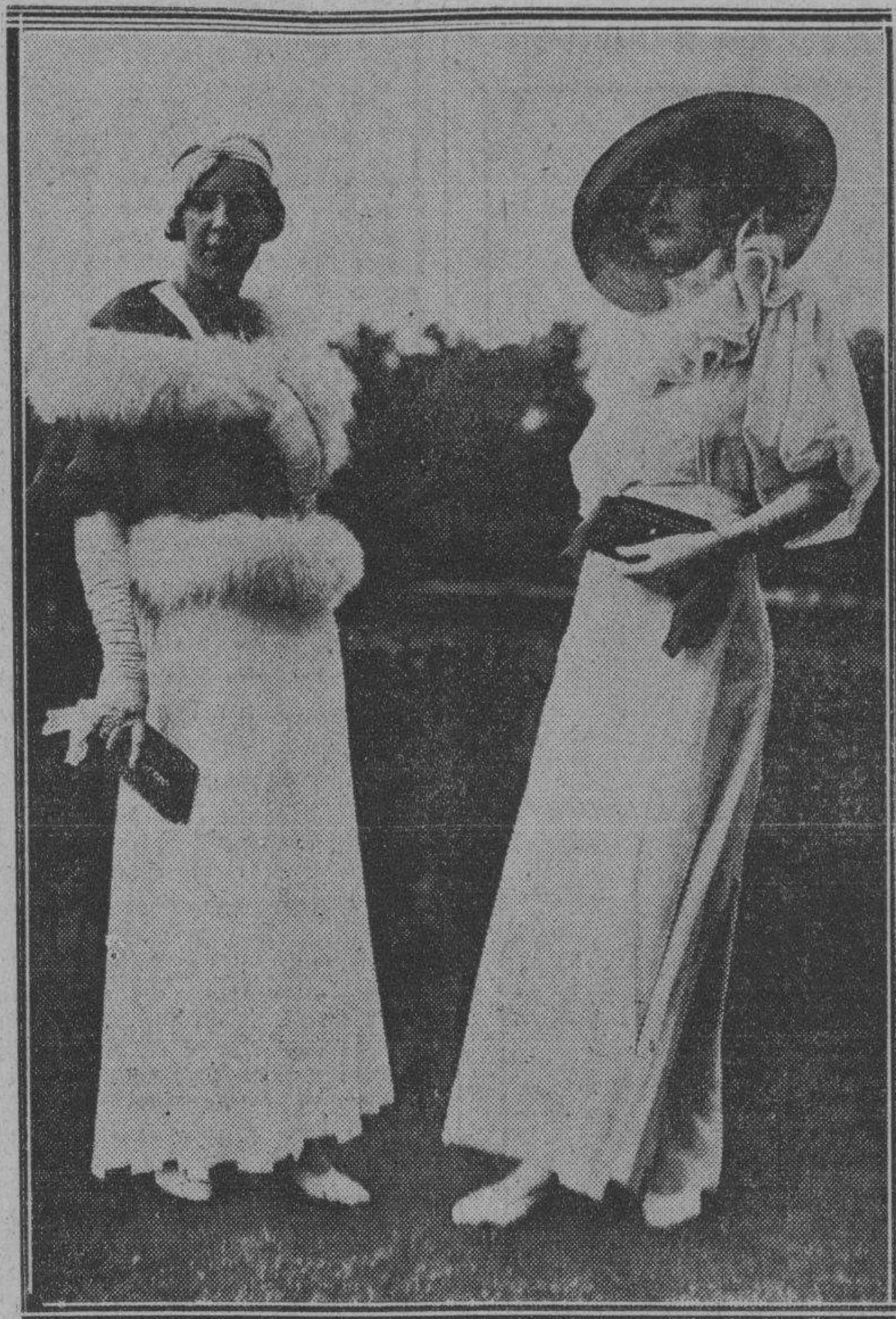
BELLOS MODELOS DE LAS CARRERAS

En la exposición de modelos que presentaron las grandes casas de París, llamaron la atención estas dos, por los detalles de sus trajes y sombreros.