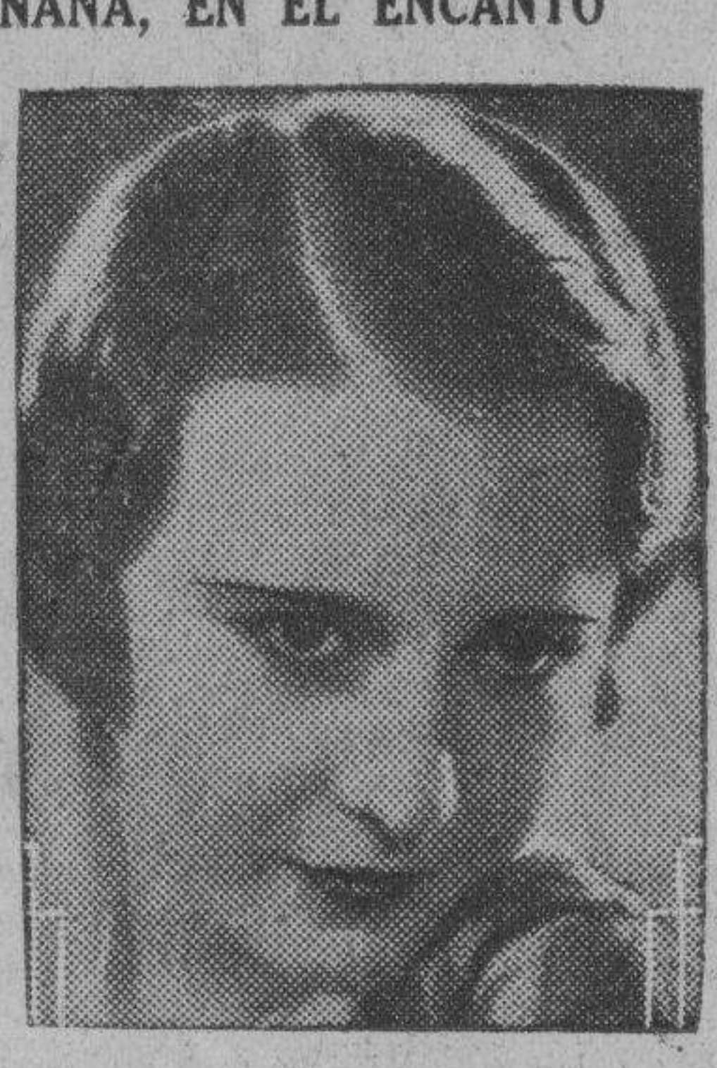
Barbara Stanwyck en «Hacienda de la vida», que se estrena mañana en el «Encanto».