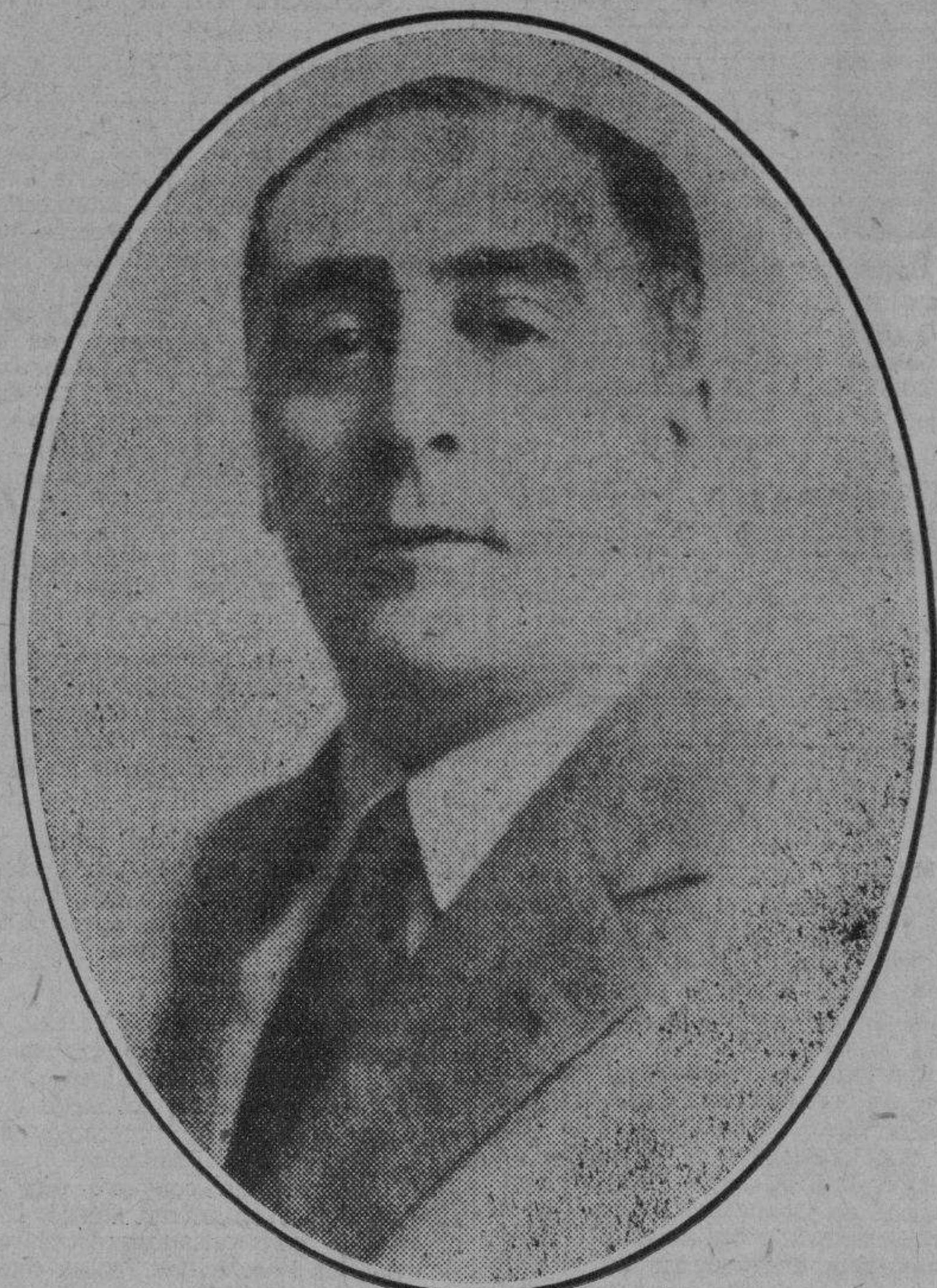
EN PRO DEL TURISMO