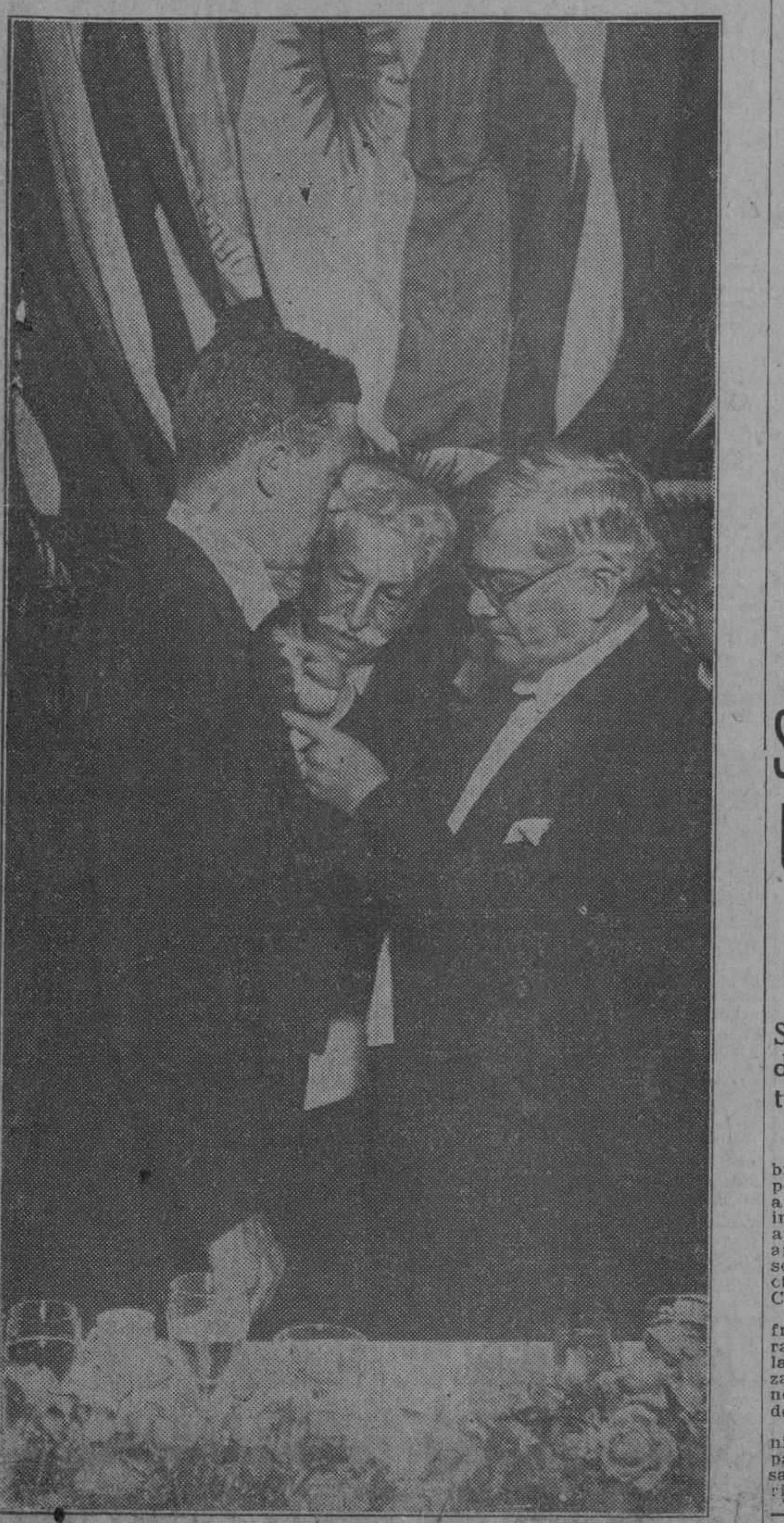
La actualidad gráfica anoche, en el Teatro Nacional.—El Honorable señor Presidente de la República preme en el pecho del Coronel Lindbergh la Gran Cruz de Carlos Manuel de Céspedes.