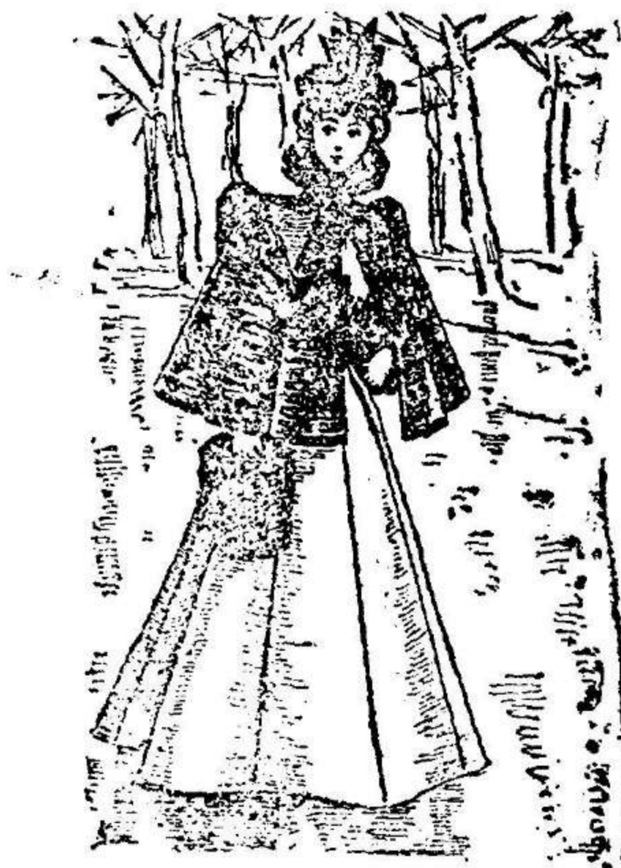
Esclavina para señorita

Modelo exclusivo para nuestras lectoras, de los Grandes Almacenes de El Siglo , Barcelona. (1)