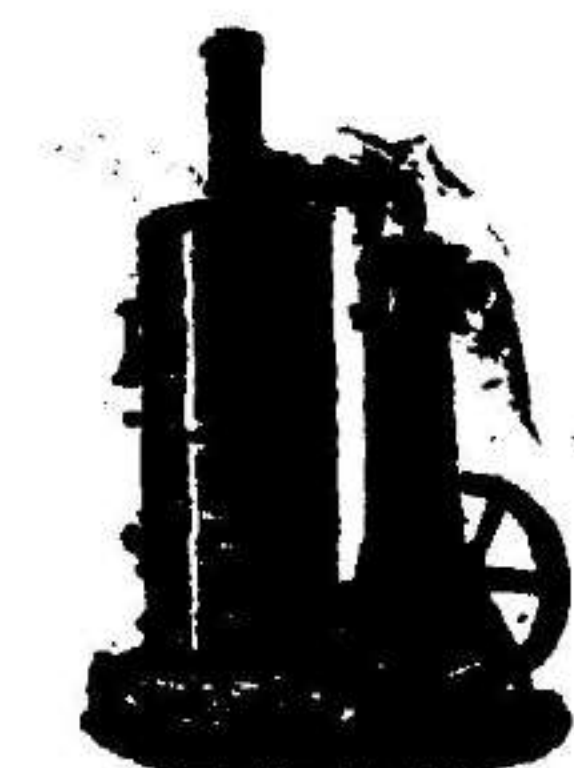
Máquina de vapor vertical.