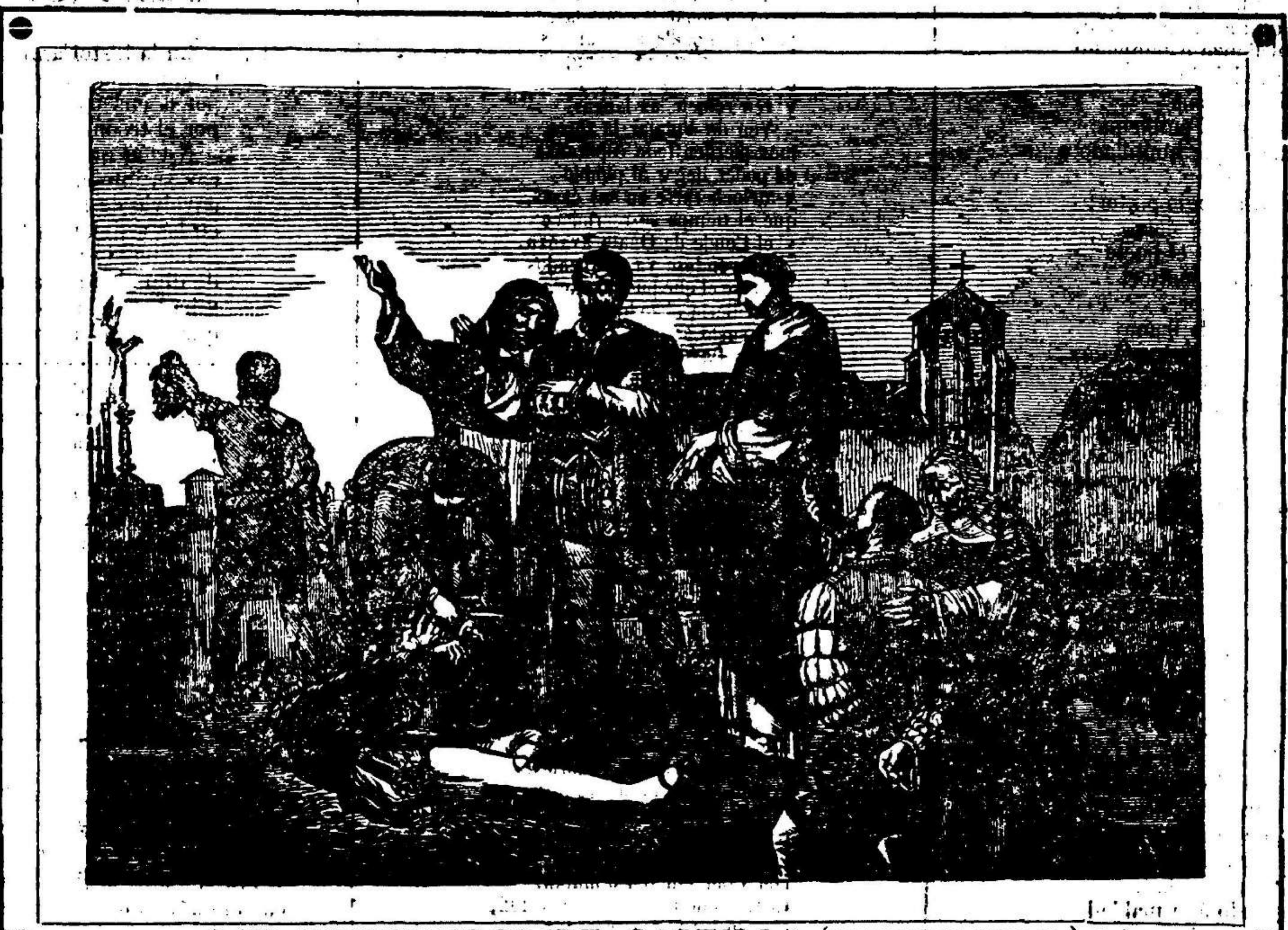
LOS COMUNEROS DE CASTILLA (CUADRO DE GIBBERT)

Con su san- gre, JUAN BRAVO destruyó los gérmenes de la libertad españo- la por espacio de algunos siglos; siendo preciso el sacrificio de nuevos márti- res, para que al fin luciera en el horizonte el es- plendoroso as- tro de nuestra regeneración social, sintetiza- do en el total exterminio de los poderes ab- solutos, hoy del dominio tan solo de los pueblos, que no ignoran cuánto valen y pueden, aunan-