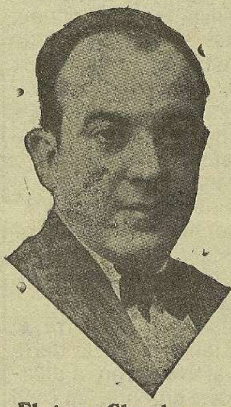
El gran Clown