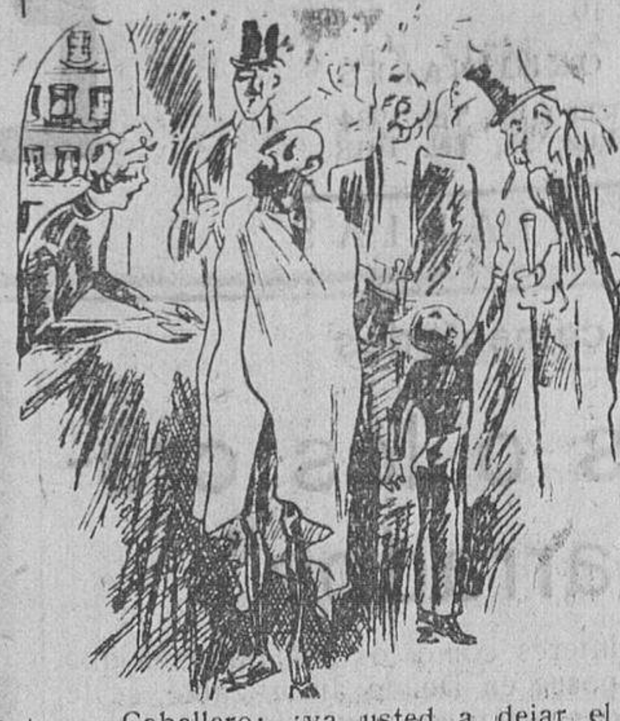
—Caballero: ¿va usted a dejar el capote en el guardarropa?...