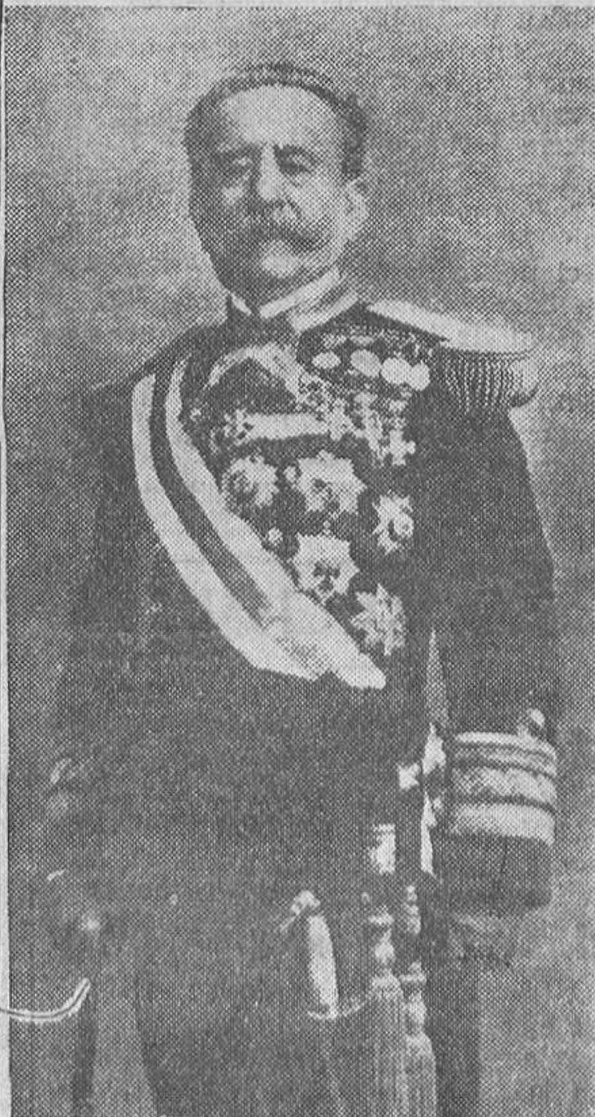
El vicealmirante don Antonio Eulafe, prestigiosa figura de la Armada española, que acaba de fallecer en Barcelona.