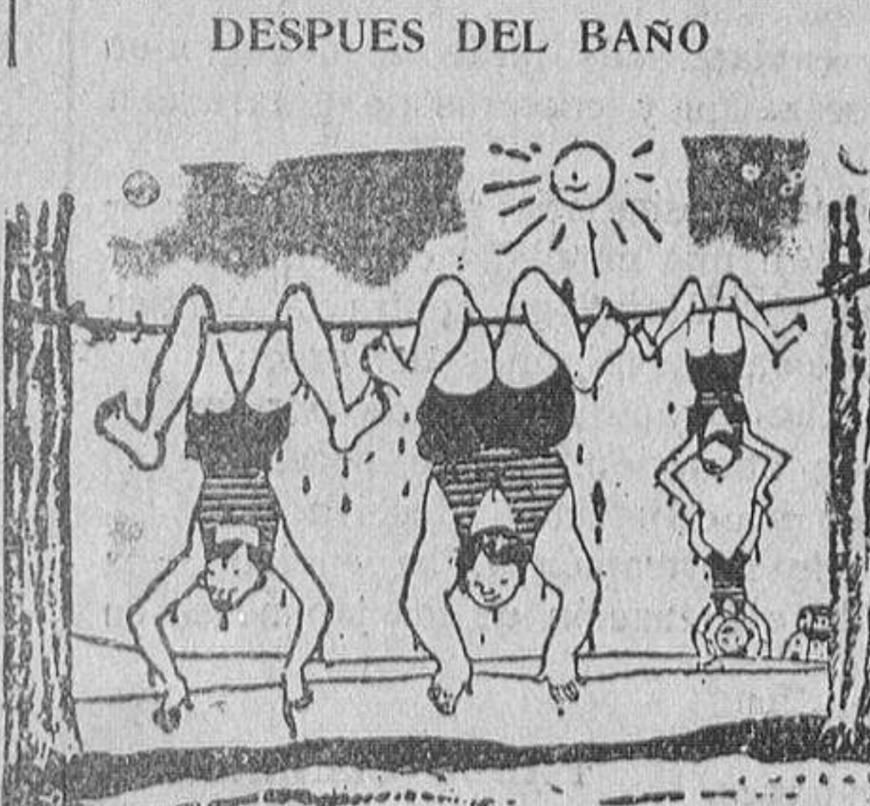
La familia del acróbata está secándose al sol.