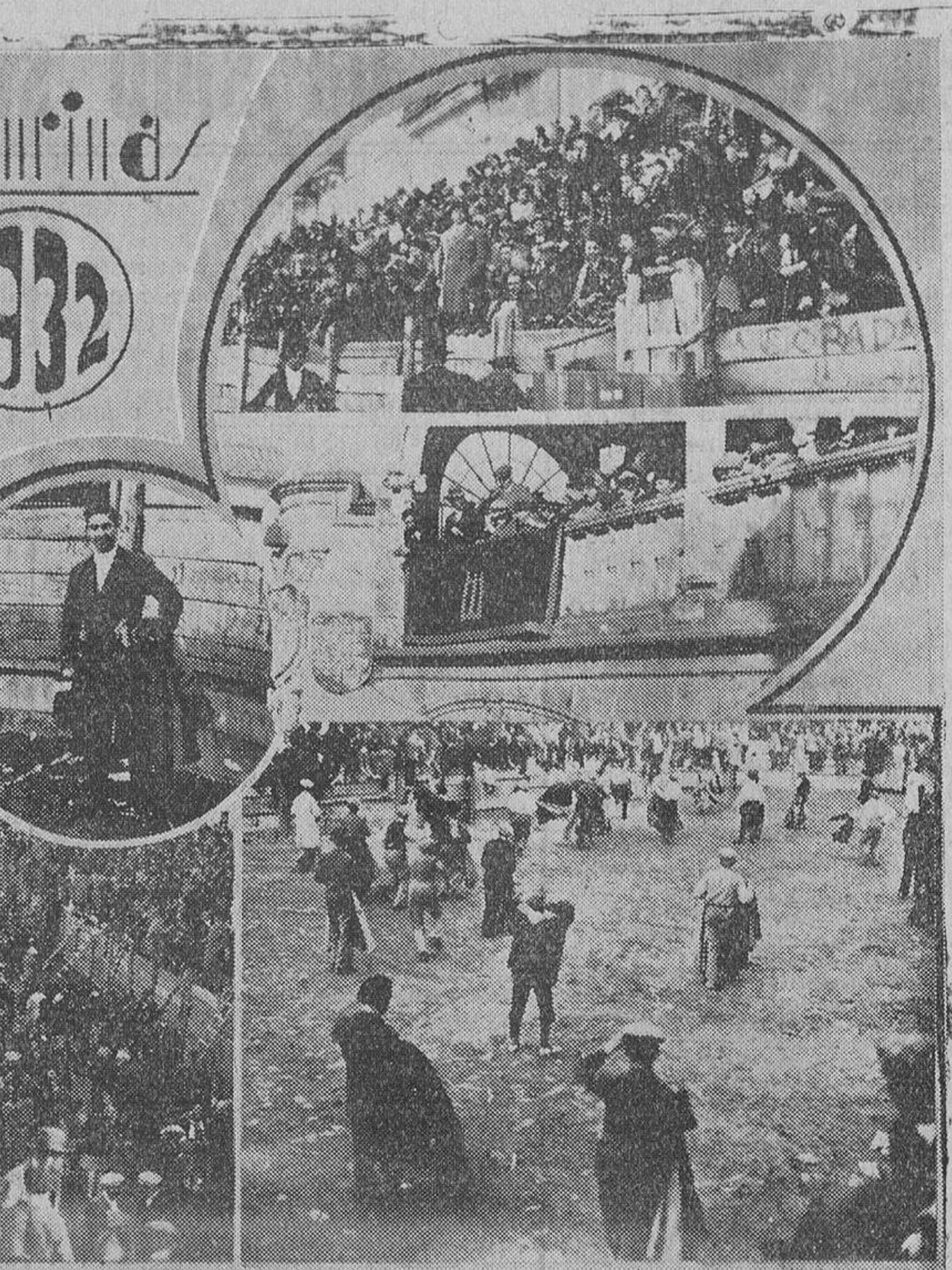
Con la misma animación que en años anteriores se han celebrado en Ciudad Rodrigo las fiestas taurinas tradicionales. Nuestro compañero Almaraz ha sorprendido diferentes momentos de la fiesta: los tendidos cuajados de personas, el palco presidencial—en una de las galerías del Ayuntamiento—, la animación en la plaza, momentos antes de dar comienzo la corrida y un momento interesante y emocionante de ésta. En el círculo, el matador de toros Manolo Bienvenida, que tomó parte en el festival, matando un novillo

Otros bailes En los salones del elegante café de "El Porvenir Mirabrigense", también se celebró por la noche un estupendo baile de sociedad, siendo tal la cantidad de preciosas jovencitas, que llamó la atención poderosamente.