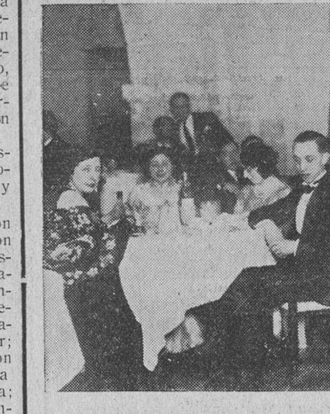
La cena americana en el hotel del Castillo

La "Gaceta" ha publicado a propuesta del ministerio de Justicia, la siguiente ley: Artículo 1.º Los cementerios municipales serán comunes a todos los ciudadanos sin diferencias fundadas en motivos confesionales. En las portadas se pondrá la inscripción de "Cementerio municipal". Solo podrán practicarse los ritos funerarios de los distintos cultos en cada sepultura. Las autoridades harán desaparecer las tumbas que separan los cementerios civiles de los confesionales, cuando sean contiguos. La guarda, administración, conservación y régimen de enterramientos en dichos cementerios corresponde a la autoridad municipal. Los Municipios que por cualquier causa no tuvieren cementerio de su propiedad vendrán obligados a construirlo en el plazo de un año. Este plazo podrá ser prorrogado por el Gobierno, en virtud de causa justificada. Asimismo, los Municipios podrán in-