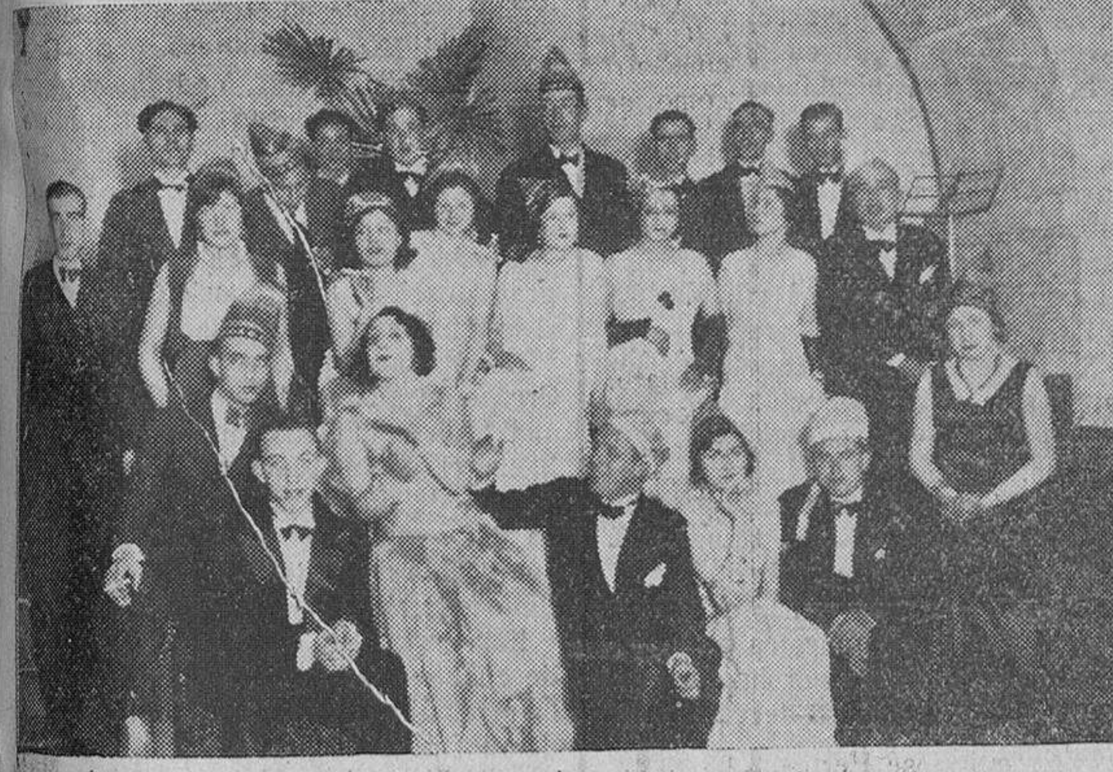
Un grupo de jóvenes que asistieron a la cena americana

Primer día de Carnaval Es verdaderamente desbordante el entusiasmo que existe por las grandes fiestas del Carnaval mirabrigense, cada vez más populares y más conocidas, y ello lo comprueba los miles de personas que con la mayor satisfacción vienen de toda España e incluso del extranjero dispuestas a pasarse tres días felices en continua fiesta y algazara, pues que existe tiempo para aburrirse. A ello contribuye también el espléndido y atrayente programa que se hace cada año mejor, trayendo a tomar parte en las corridas los hermanos Bienvenidas, Laserna y otros valientes matadores, los concursos de carrozas, las fiestas americanas, los grandes bailes, la actuación brillante de la compañía de Camila Quiroga, otros bailes de sociedad y otra serie de festejos, que no numeramos; por eso decimos que no es posible pasarlos mal, ni aun los desdichados de la fortuna; para todos hay diversión. El encierro del ganado El tiempo, aunque frío, se presenta para la mañana espléndido, lo que con-