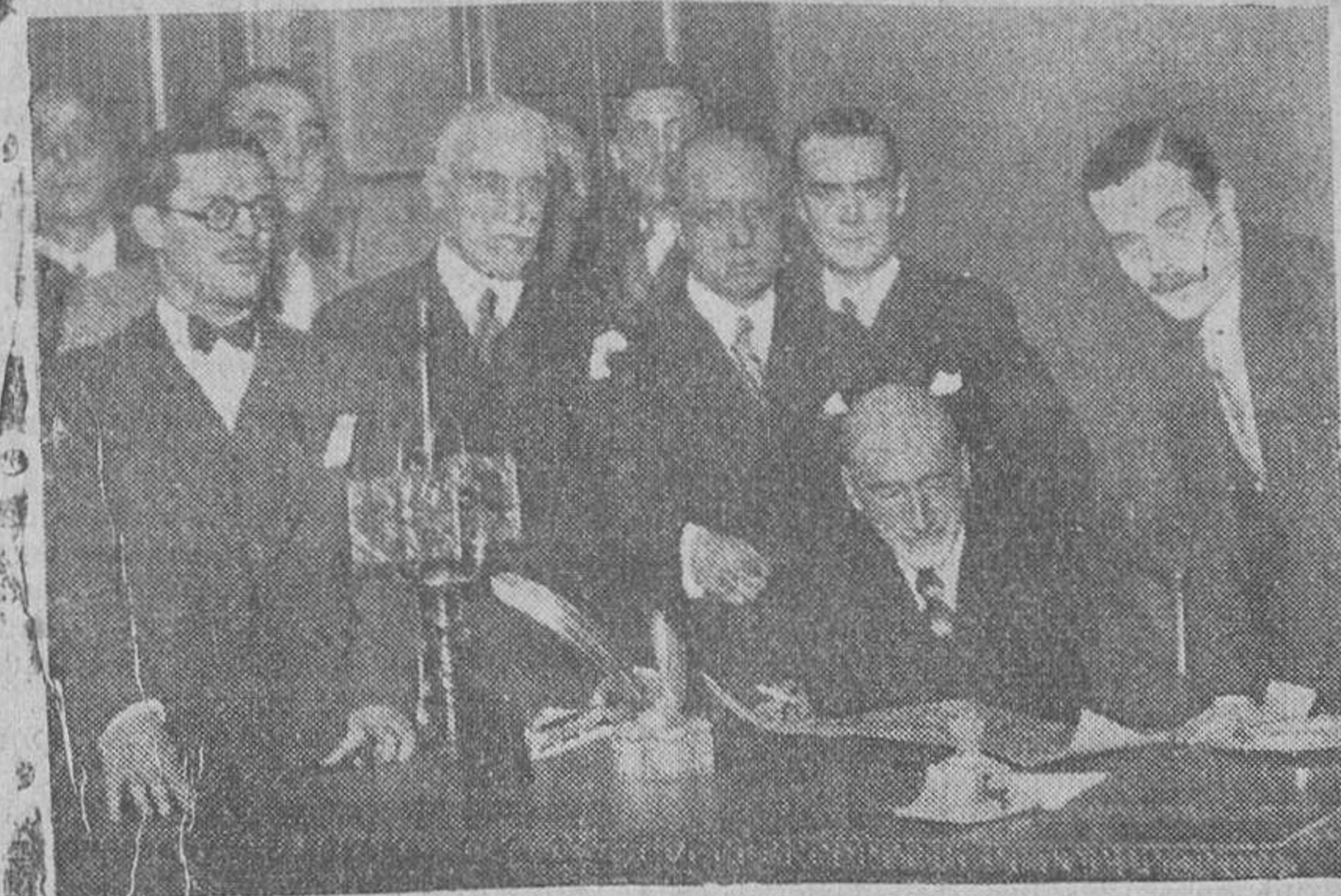
El insigne literato don Jacinto Benavente, en el acto de hacerle entrega del pergamino con el nombramiento Presidente honorario de la "Casa de los Gatos", de Madrid.

Consuelo, 17, SALAMANCA (Próximo a la Plaza Mayor.)