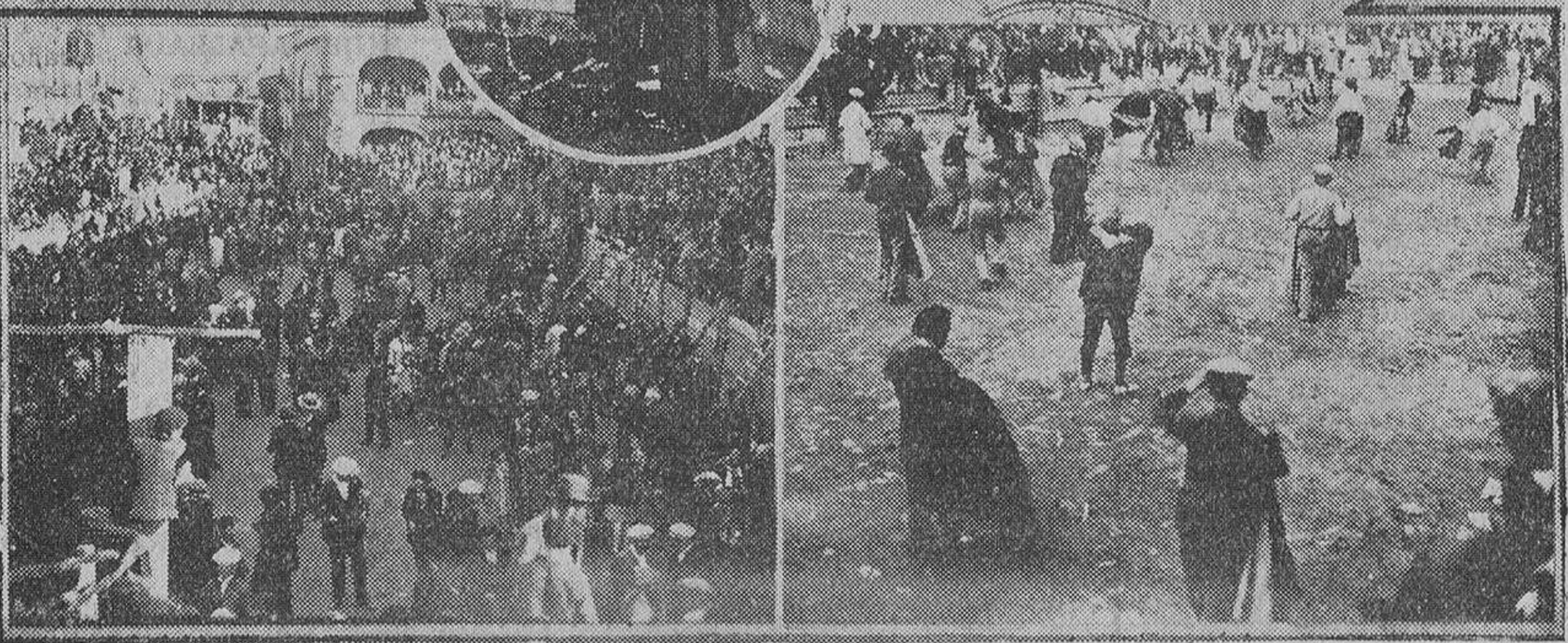
Con la misma animación que en años anteriores se han celebrado en Ciudad Rodrigo las fiestas taurinas tradicionales. Nuestro compañero Almaraz ha sorprendido diferentes momentos de la fiesta: los tendidos cuajados de personas, el palco presidencial—en una de las galerías del Ayuntamiento—, la animación en la plaza, momentos antes de dar comienzo la corrida y un momento interesante y emocionante de ésta. En el círculo, el matador de toros Manolo Bienvenida, que tomó parte en el festival, matando un novillo

Ampliando nuestra información de la fiesta americana, diremos que una vez más constituyó esta exótica noche mundana, el mayor atractivo de las viejas fiestas carnavalescas. La elegancia y la alegría, en discreto contraste, fueron las características de la fiesta. Aristocráticas familias salmantinas y zamoranas; distinguidos forasteros lusitanos y numerosos forasteros, alternaron durante unas horas de vertiginoso y fraternal culto a la danza con lo más selecto de nuestra buena sociedad. Es imposible dar nombres de los concurrentes, pues aparte de que entre ellos había muchísimas personas desconocidas para el cronista, el bullicio y el interrumpido ajetreo en los salones, hacían difícilísima la confección de una lista completa. Actuó con gran éxito en la fiesta el clarito Aragón, cuyo repertorio y magnífica ejecución cautivaron al público. Se sortearon botellas de champagne entre los caballeros y artísticos objetos de filigrana de plata entre las señoras. Otras mil atenciones y sorpresas dispensó la gerencia al Hotel a los concurrentes. Pazos, el popular fotógrafo, tomó muchos magníficos. Multitud de serpentinas y otros inflativos proyectiles, daban color y alegría a la gran fiesta, que será inolvidable.