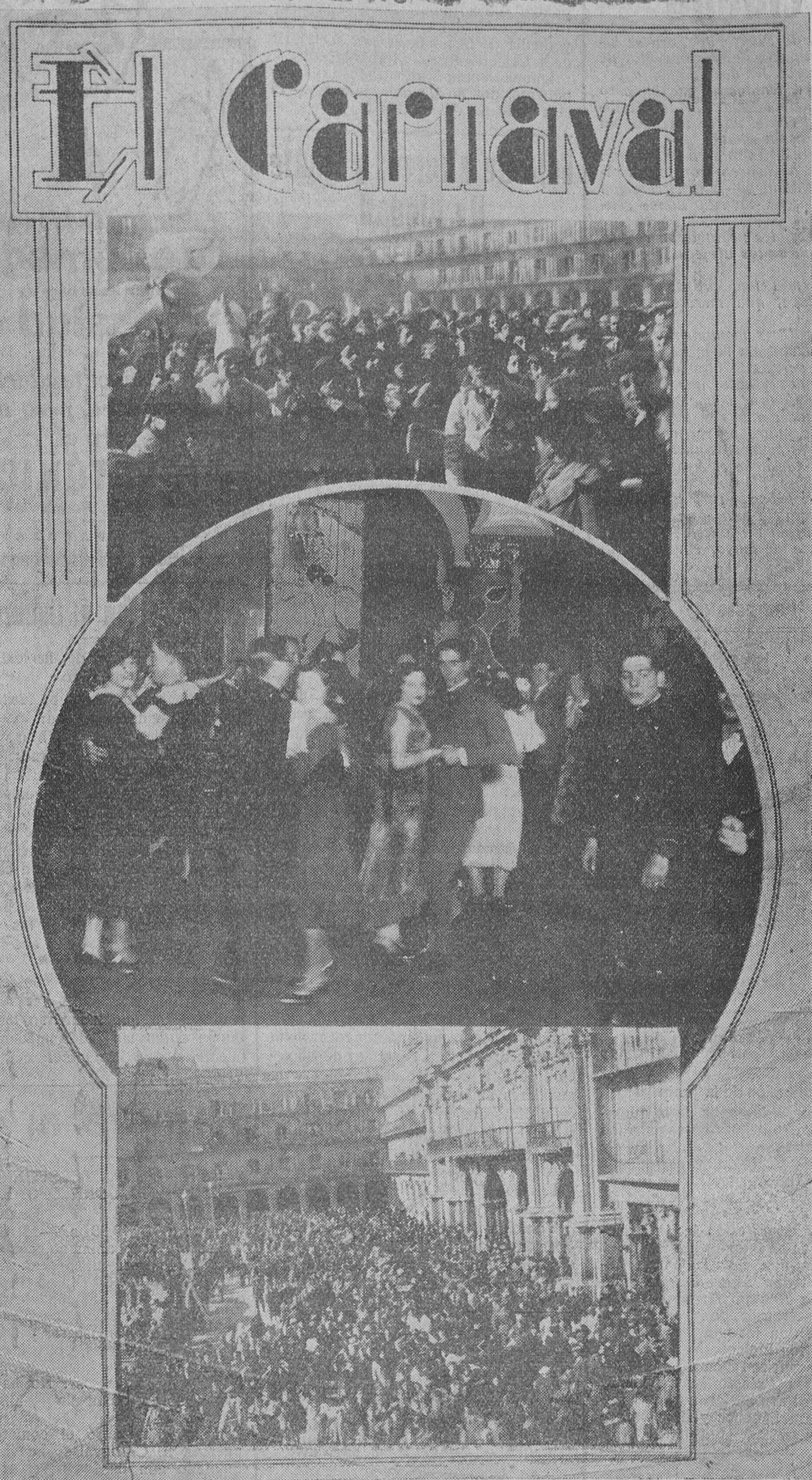
El Carnaval callejero ha revestido, este año, en Salamanca, gran animación. Estas fotos, lo demuestran bien a las claras. En el centro, un momento de la reunión de confianza celebrada en el Casino principal de nuestra ciudad.

La fiesta transcurrió medio de la mayor alegría, hasta que los niños se