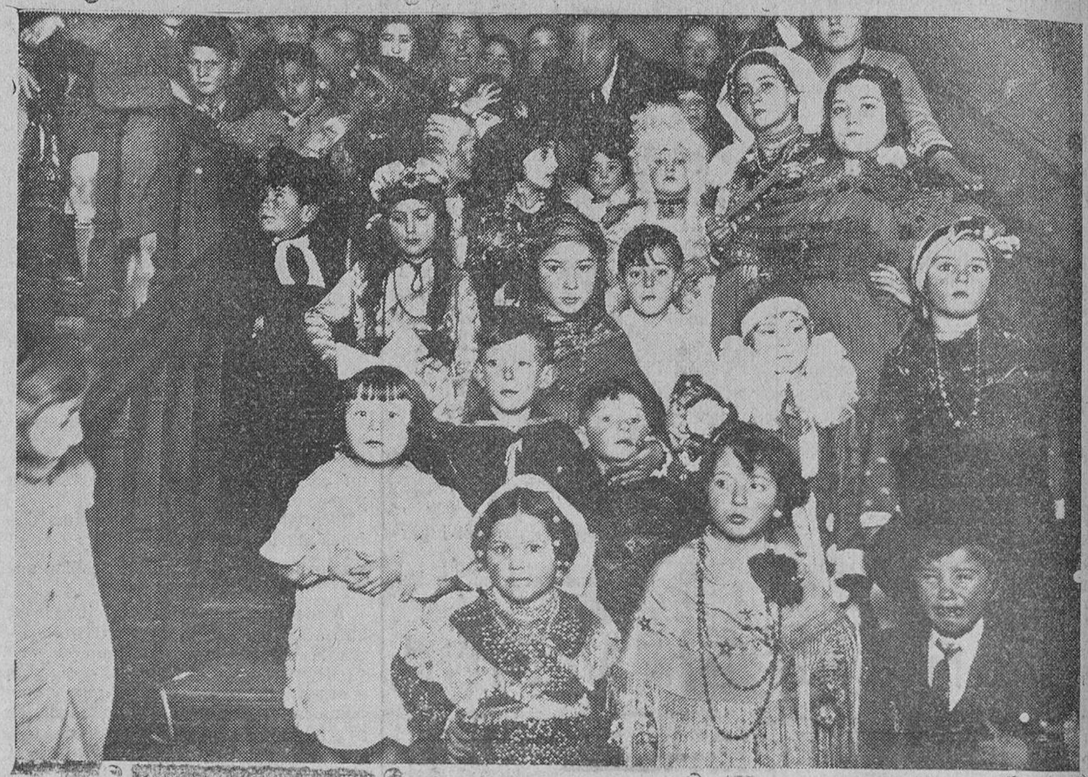
En el Casino del Pasaje