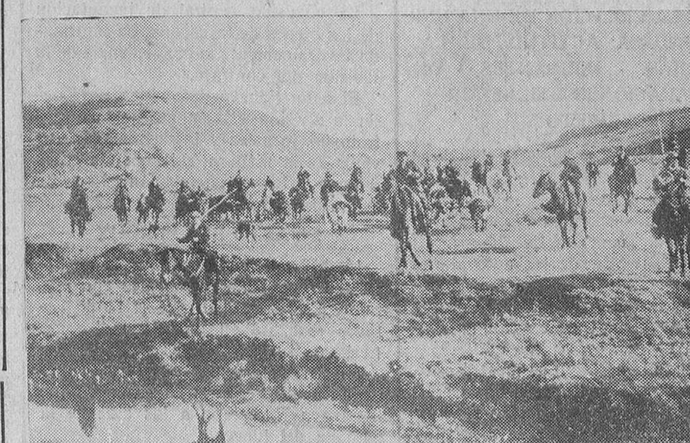
Un momento interesante del típico encierro de las reses que han de ser lidiadas en la plaza de Ciudad Rodrigo.