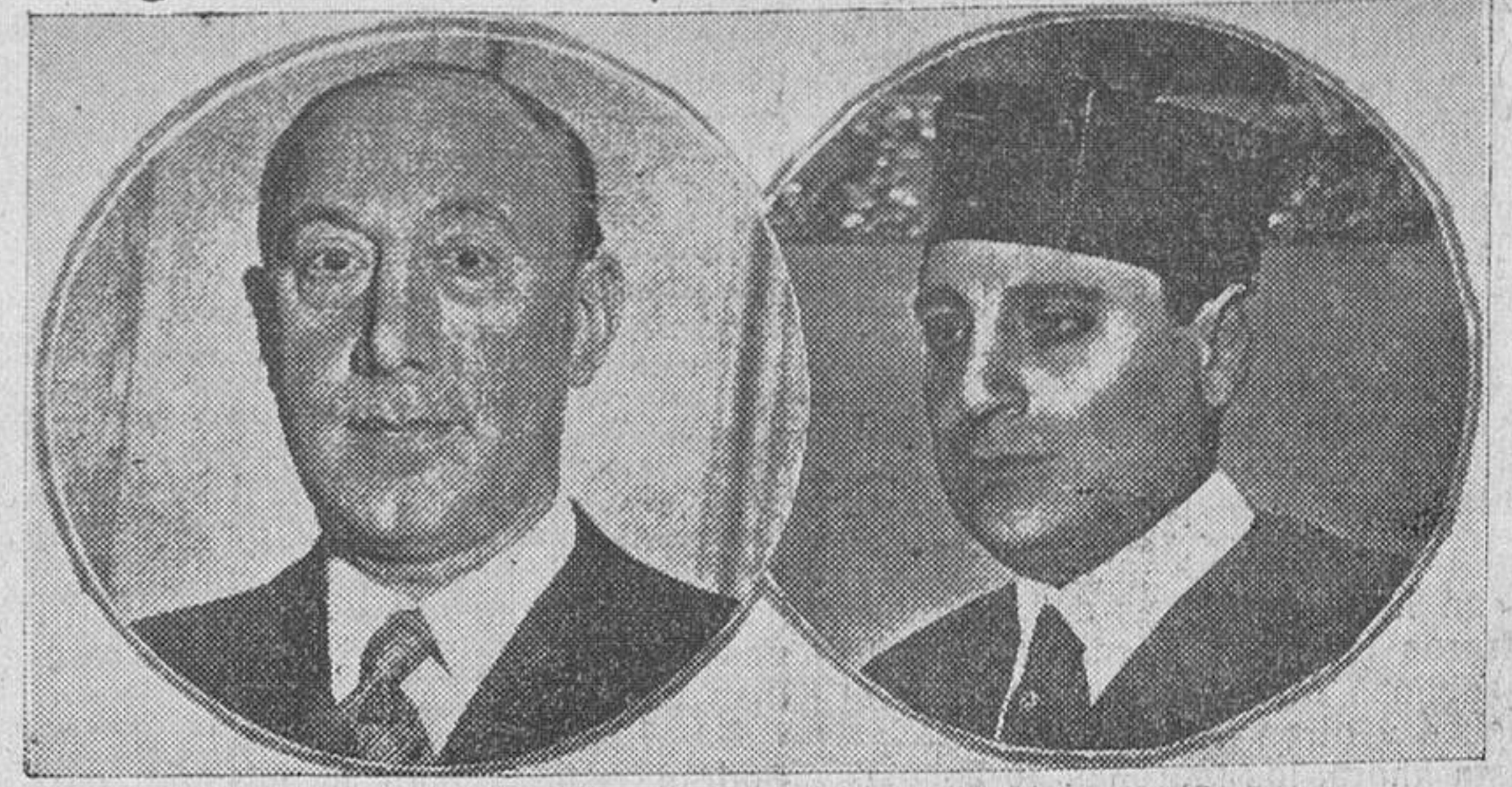
Don Teodomiro Menéndez, que ha sido nombrado subsecretario del Ministerio de Obras Públicas