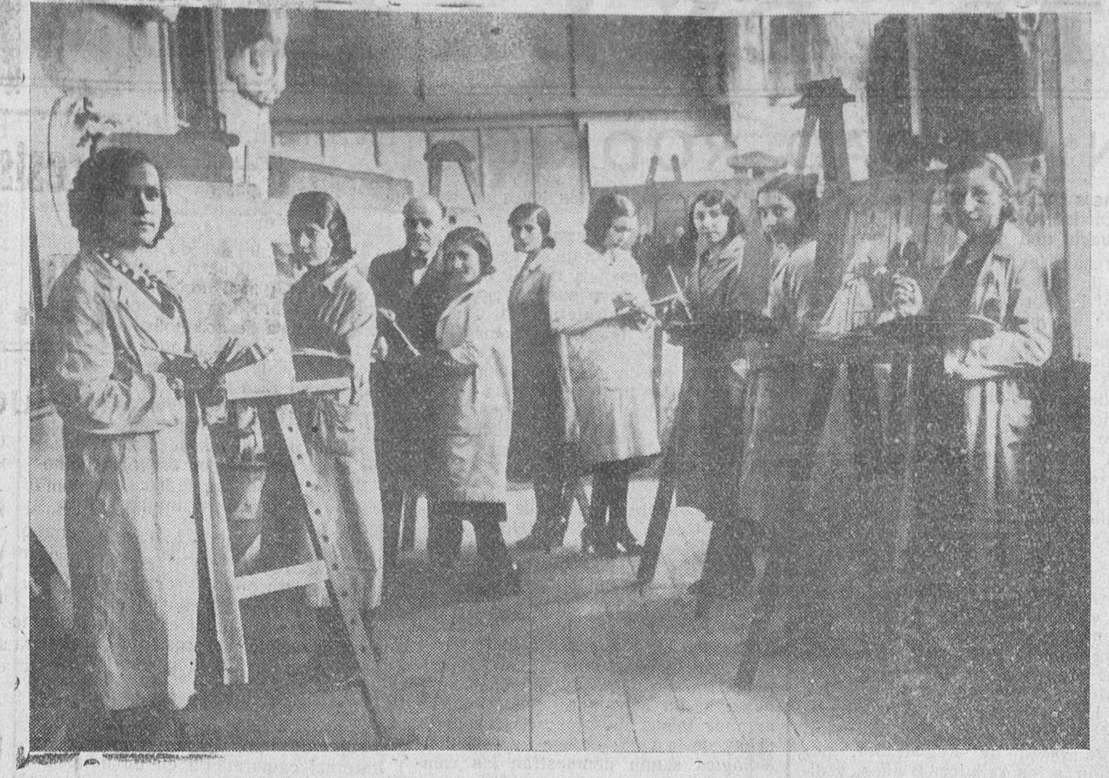
Señoritas que asisten a la clase de Pintura de la Escuela de San Eloy (Foto Almaraz).

Después—dijo—iré a Sevilla, y más tarde a Galicia, donde pronunciaré otro discurso. Pregunté al señor Lerroux si podría acompañarme a Valencia, confesándome que no le era posible, ni lo consideraba tampoco necesario.