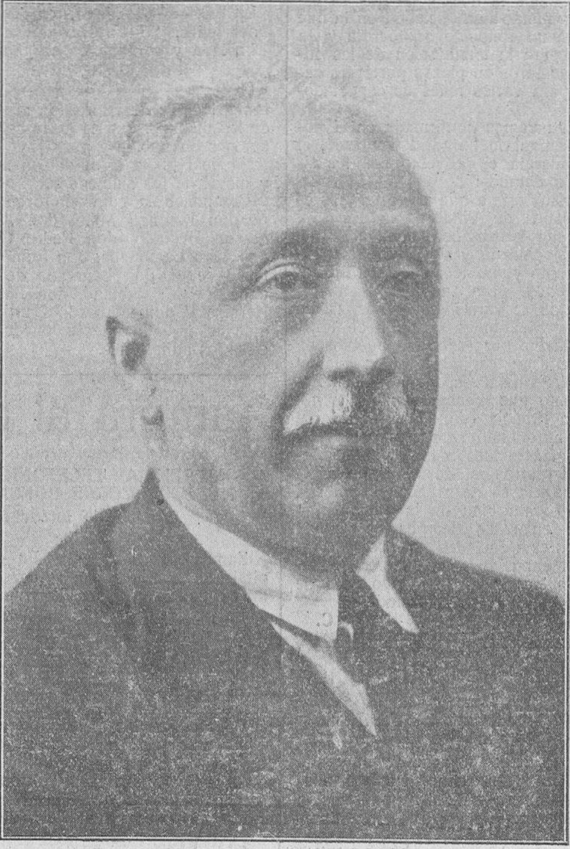
Don Niceto Alcalá Zamora, que ayer fue elegido presidente de la segunda República Española