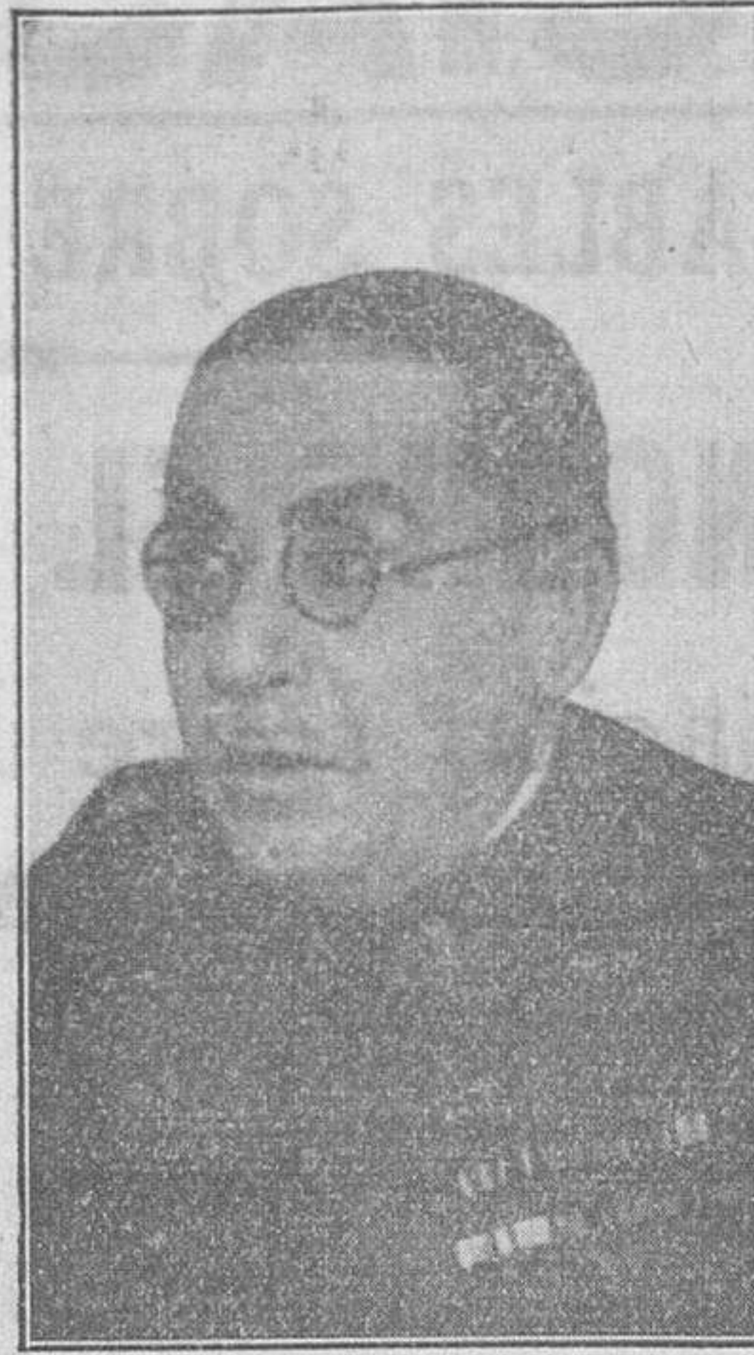
El general don Rafael Villegas, comandante general de la primera división (Madrid), que ha tomado posesión de su cargo