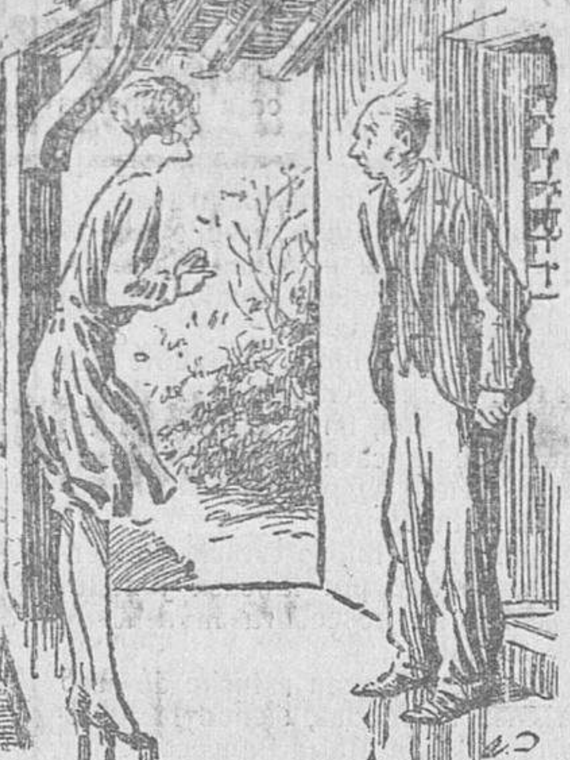
La vecina.—Señor López: Tenemos invitados hoy en casa. ¿Puede usted prestarme el fonógrafo y los discos?... Yo pondré las agujas.