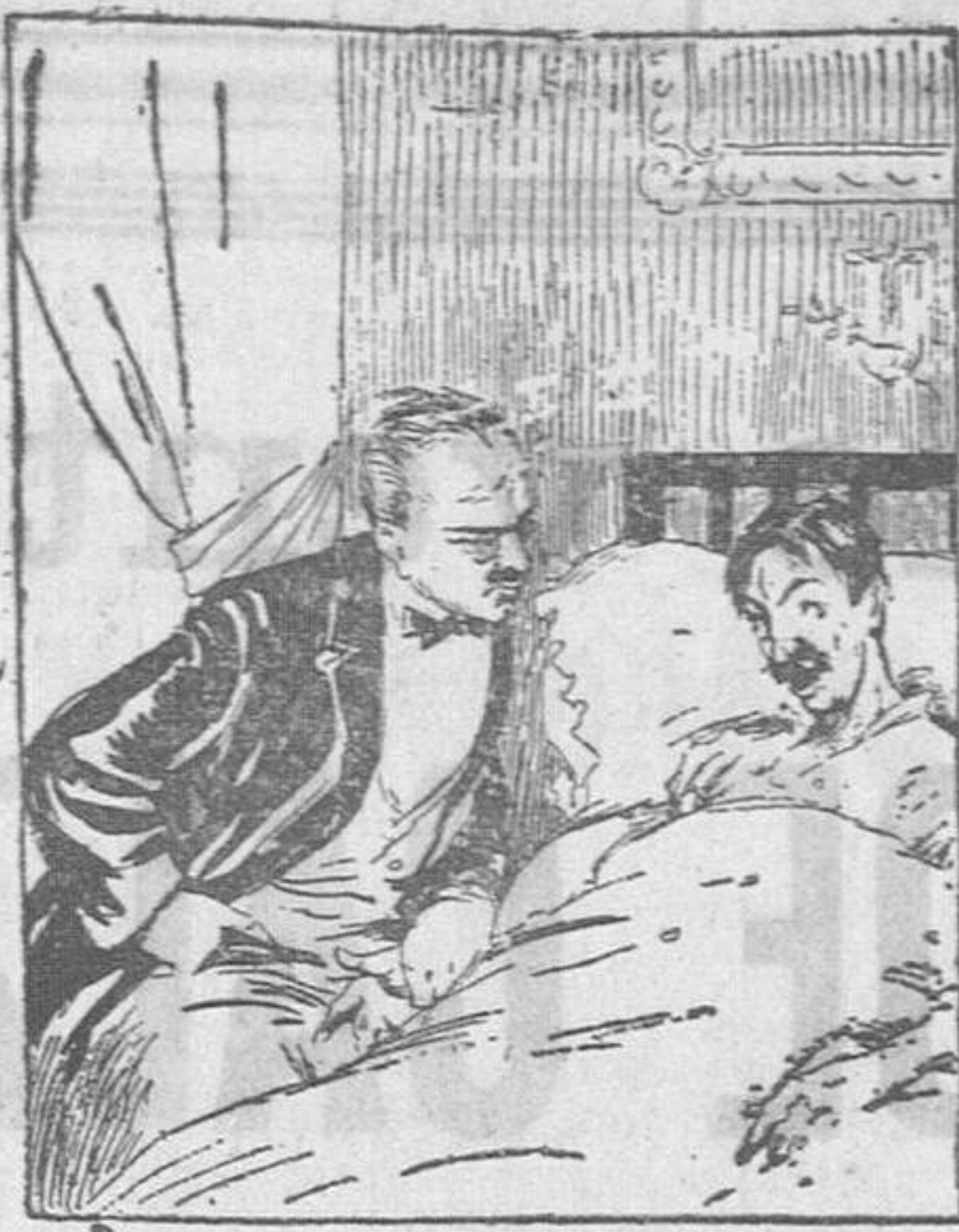
—Contra el insomnio no hay nada mejor, ¿y hasta qué número ha contado usted? —Hasta el cuarenta y cinco mil. —Y entonces... —Entonces ya era hora de levantarme.

Para ser más bonita consulte nuestro Catálogo ilustrado de la belleza. Lo recibirá gratis pidiéndolo a INTEA, Apartado 82, Santander.