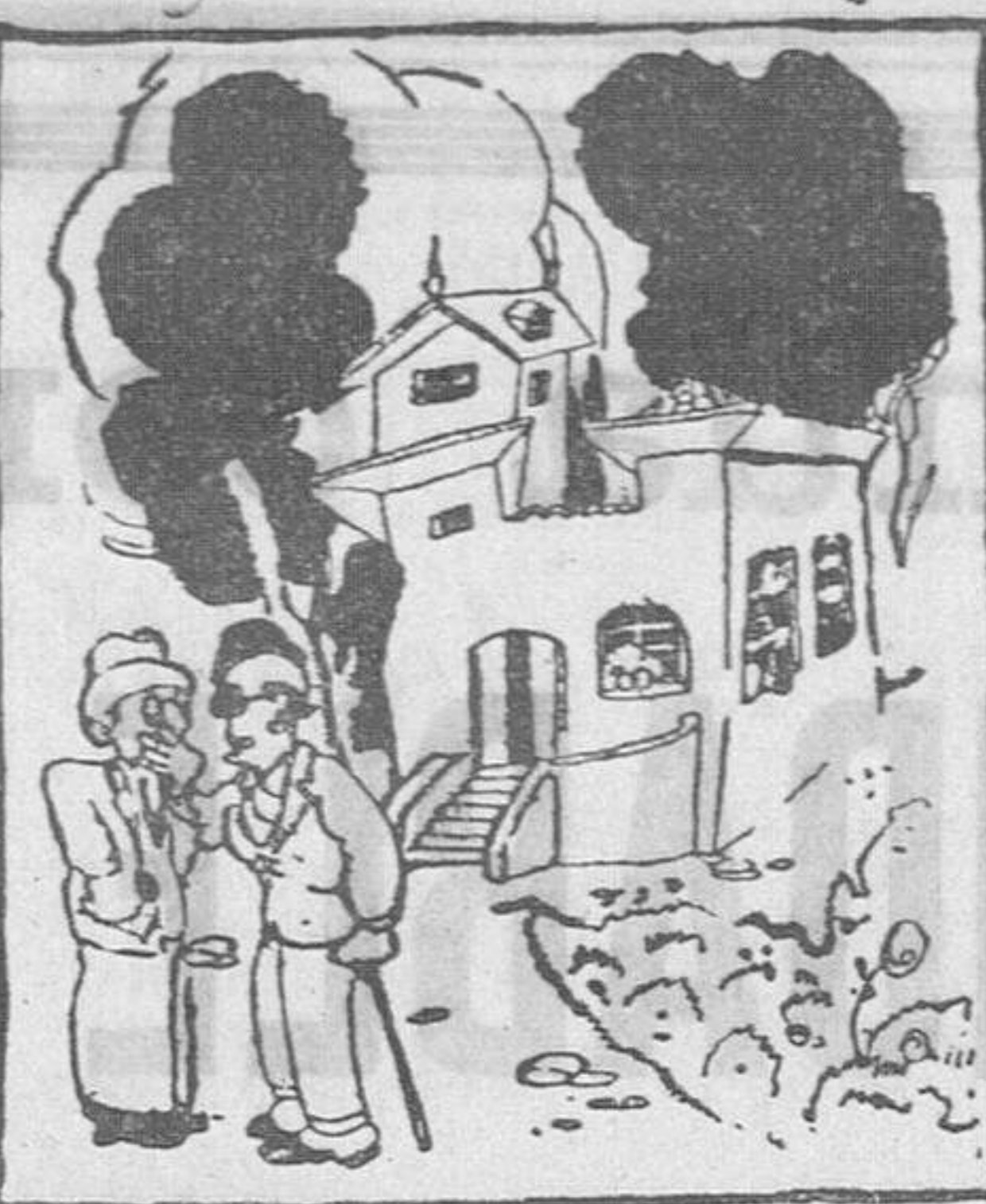
—La casa me gusta mucho, pero es muy chica. —Y qué quiere, si aún no tiene tres años!

Es peligroso el combate contra el franco-italiano gigantesco. Más peligroso que difícil. De ahí que todas las bravatas en visperas de habérselas con Griselle, deban ser reservas ahora.