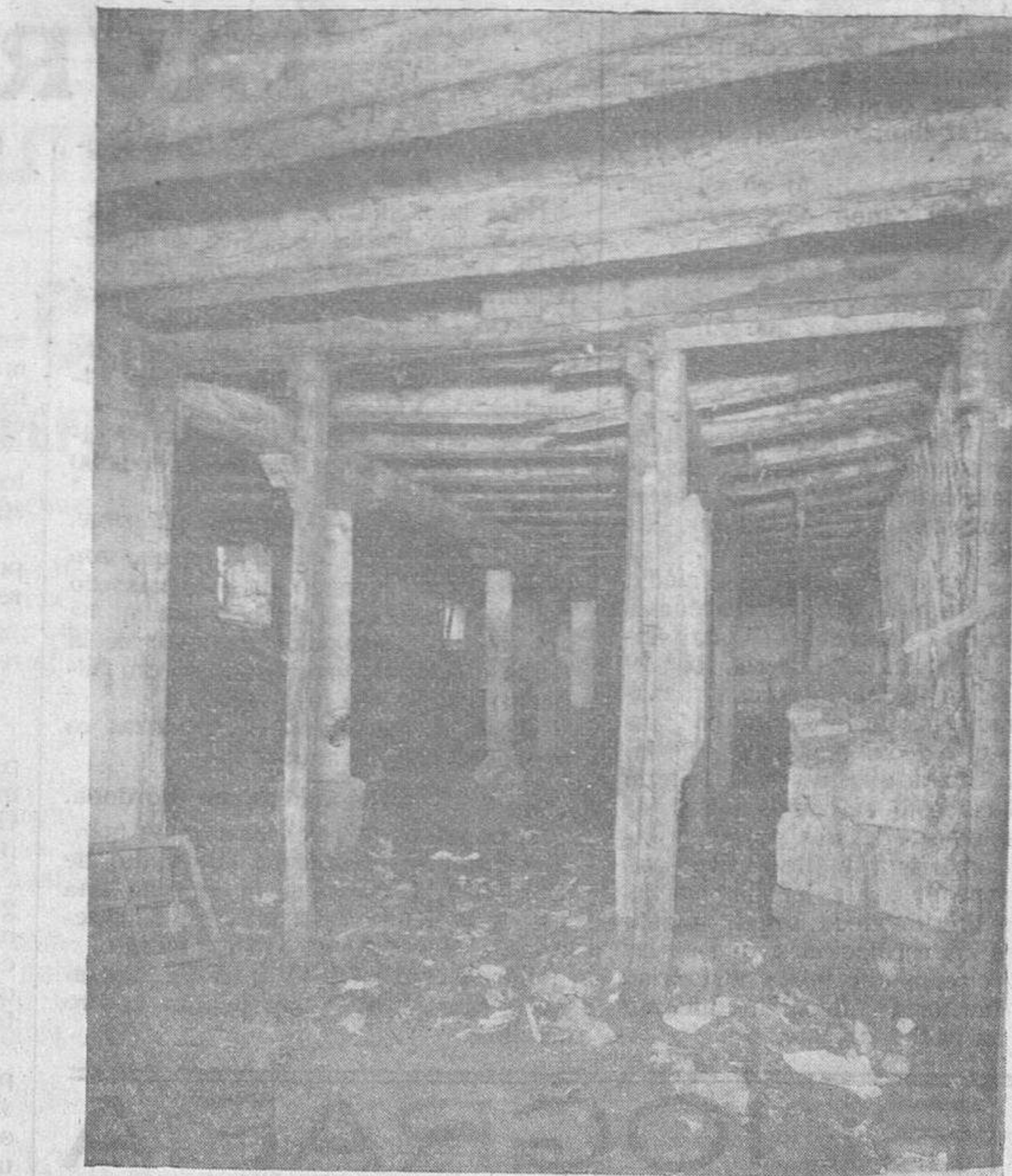
Una de las cuerdas del Parador, que a dos pasos de la Plaza Mayor, constituían un verdadero foco de infección.

La saludable piqueta, que en Salamanca no ha respetado, a veces, cosas dignas de estimación y de ser conservadas, entra esta vez sobre seguro, realizando una gran obra, que será cuando se construya el nuevo edificio,