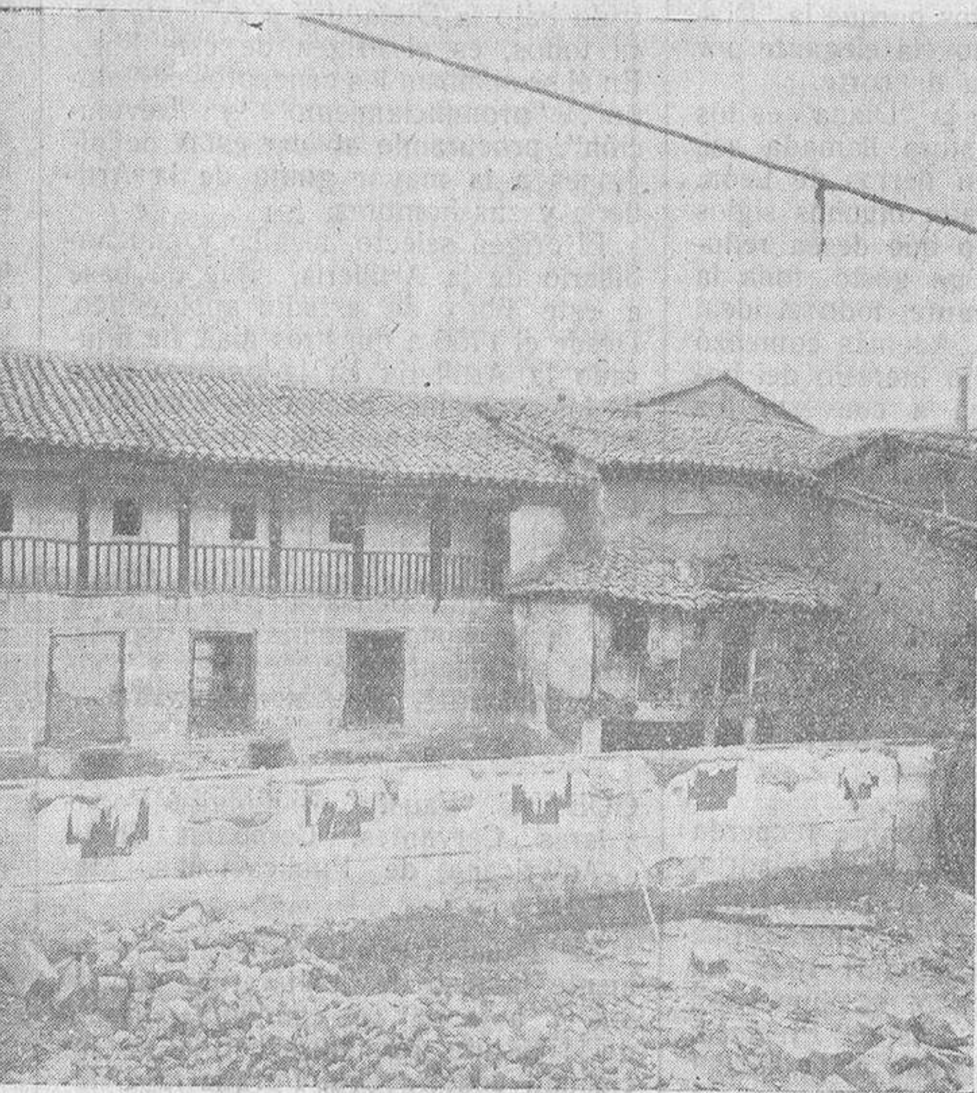
La "suntuosa" galería del citado parador, en la parte de la calle de Espoz y Mina.

Hemos de hablar, con más calma que hoy, de lo que será el nuevo teatro de Salamanca. El proyecto es sencillamente suntuoso, un proyecto de más de un millón y medio de pesetas. Será un teatro capaz, elegante y confortable. No luchará el espectador con