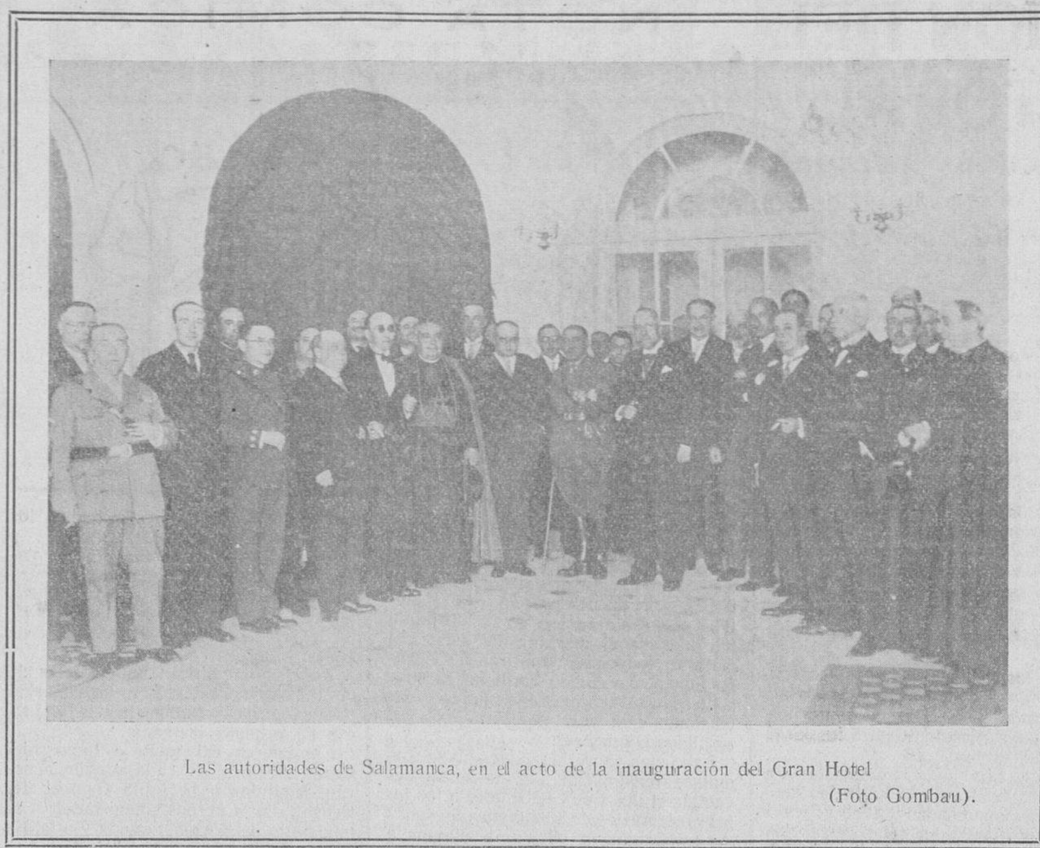
Las autoridades de Salamanca, en el acto de la inauguración del Gran Hotel

Mañana hace un año que falleció en Salamanca, rodeado del cariño de los