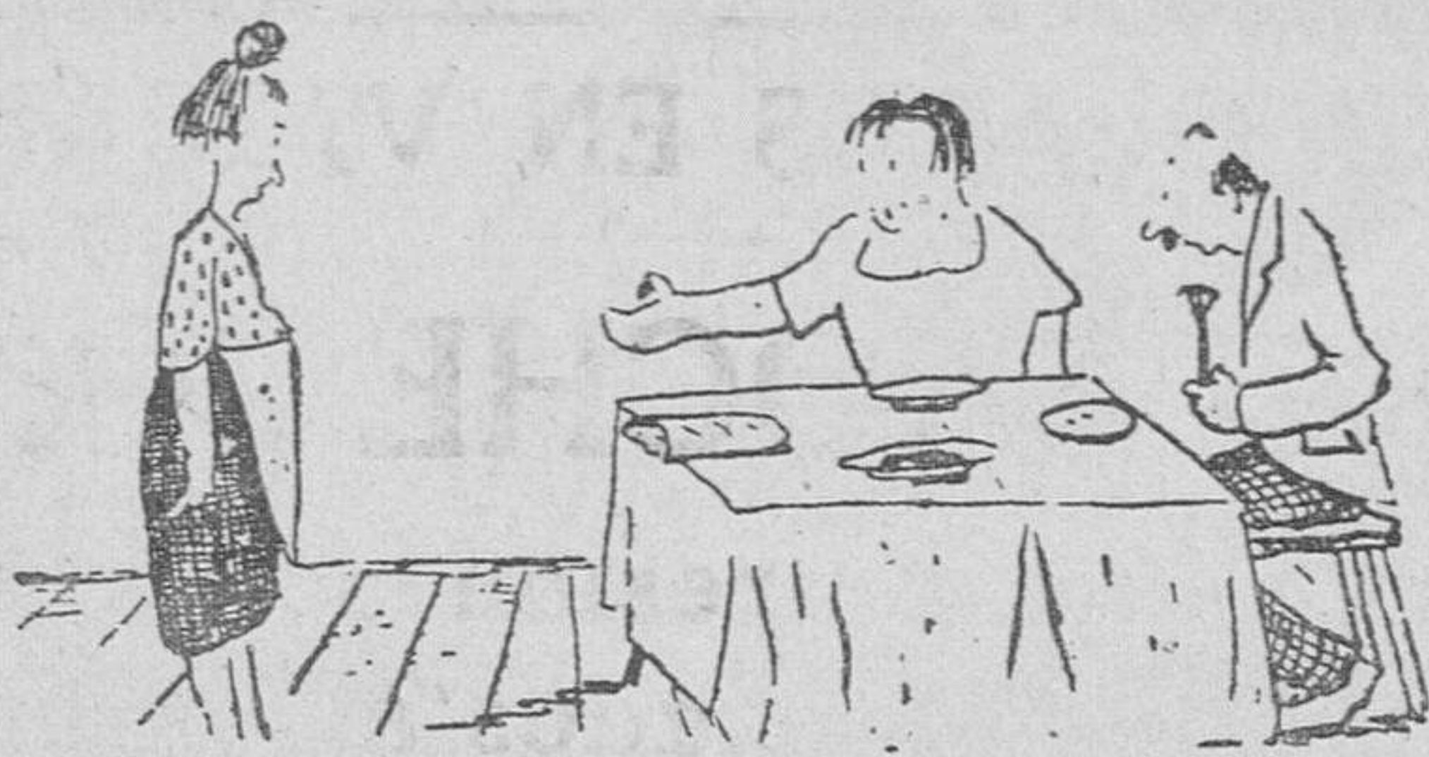
—¿Y los macarrones? —Los he tirado, señora. Estaban todos huecos.

de la lista 20 del citado mes al 3 de Septiembre, ambos inclusive.