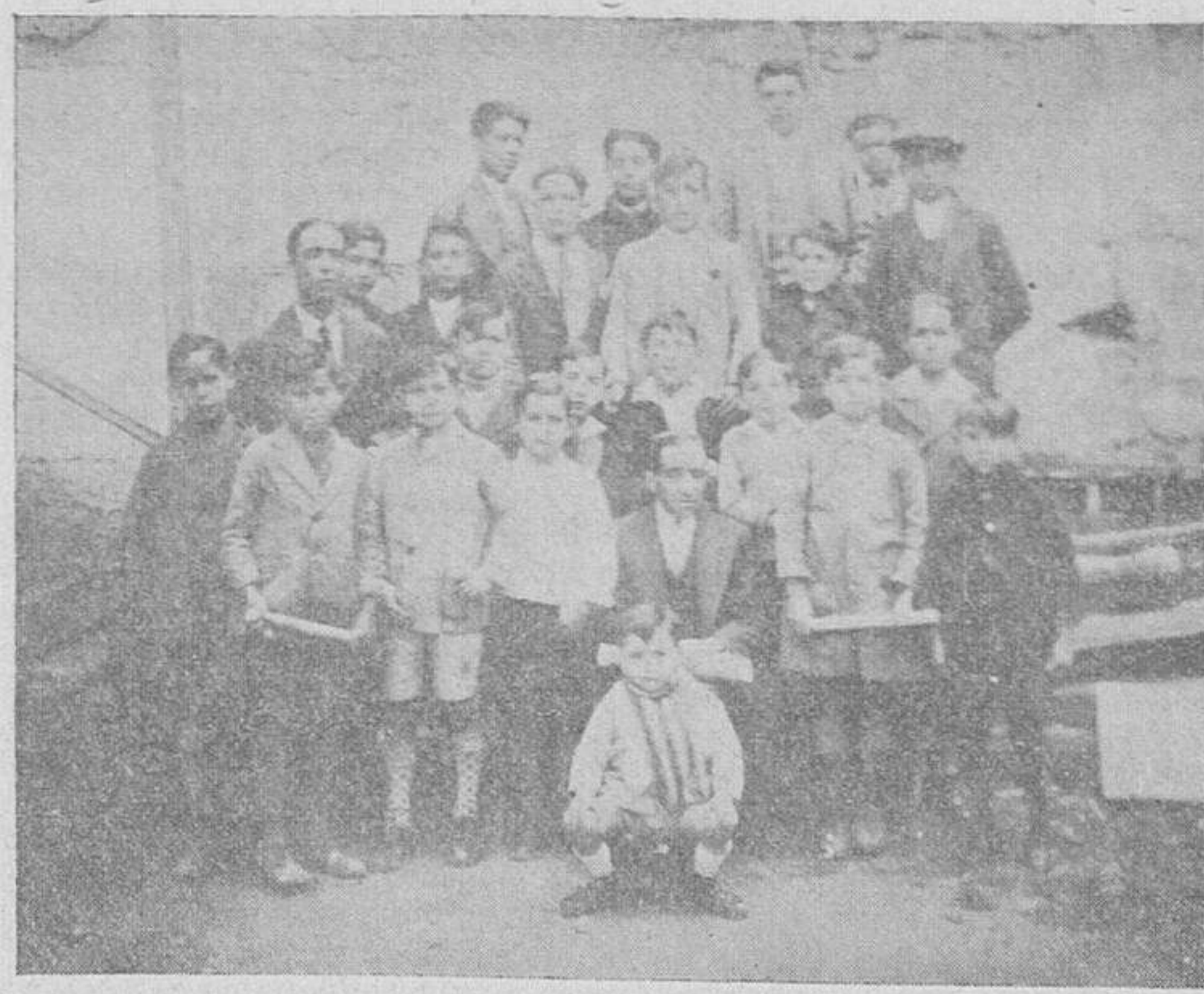
EN LA CASA DEL PUEBLO

Santiago.—La Universidad ha recibido una invitación para que vayan profesores y alumnos durante las vacaciones de verano a realizar una visita a la Universidad de Oporto.