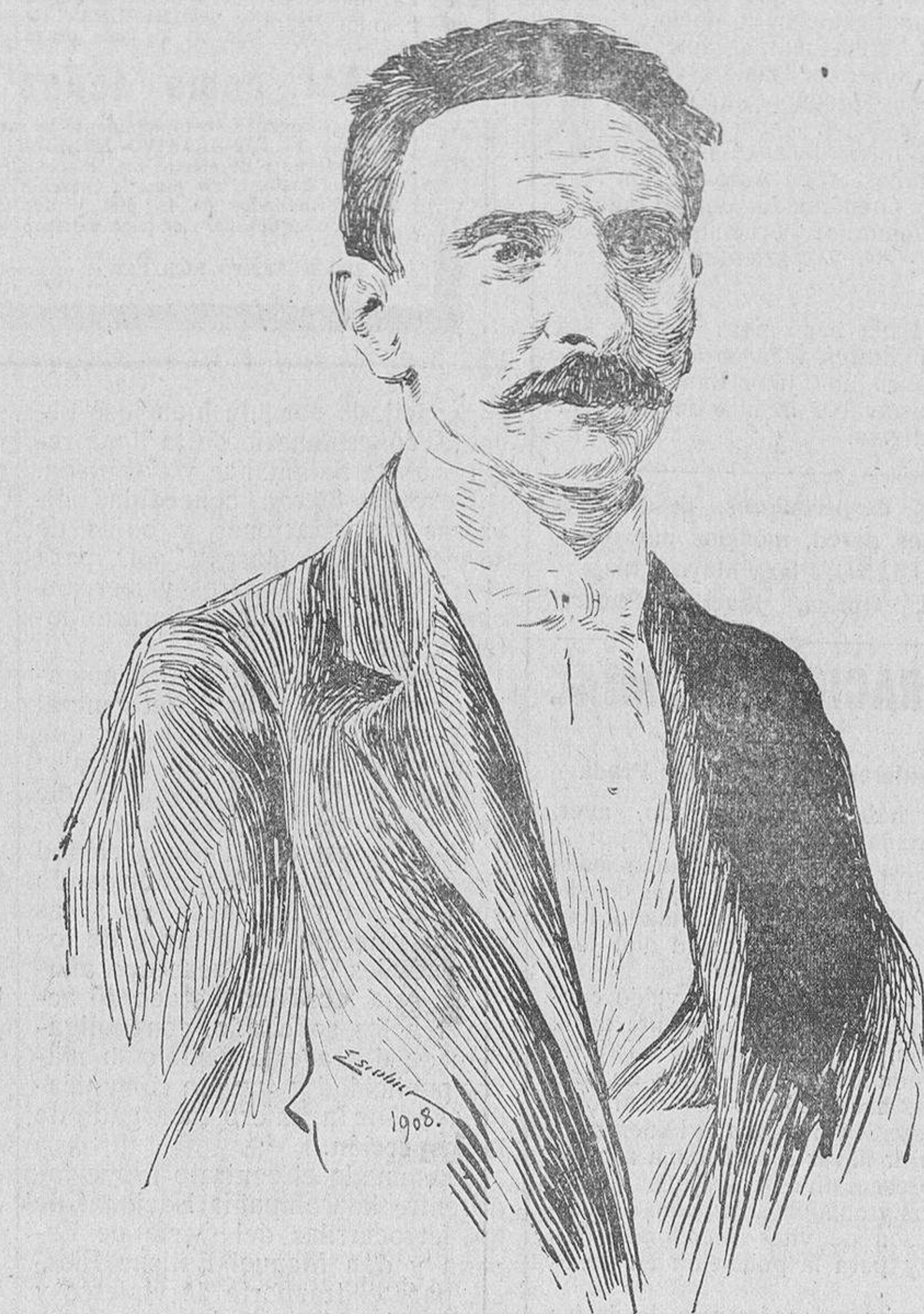
DON MELQUIADES ALVAREZ

undo de lo pasado. Por ser resignada España ha sufrido lo que ha sufrido a lo largo del calvario de su historia. Nosotros no podemos olvidar. Responsabilidades. ¿Qué responsabilidades? Todas. Pero las responsabilidades comprenden las llamadas de gestión y las llamadas políticas, que no deben limitarse a los ministros y a los servidores de la dictadura, sino a todos los que hayan contraído culpa, incluso a las magistraturas más altas y más augustas. Ya sé que a muchos monárquicos de la derecha y de la izquierda es indignante esta campaña y afirman que la majestad está siempre a cubierto por el refrendo de sus ministros. La doctrina, lo reconozco, es impecable; pero a ver si nos entendemos. Es indudable que en un régimen constitucional, los mandatos del rey no tienen efecto sin el refrendo, porque es claro, que cuando la Corona es esclava de la Constitución, a penas si le queda libertad para obrar. Esos monárquicos no se dan cuenta de que se trata ahora de unas responsabilidades derivadas de actos de la dictadura sin Constitución.