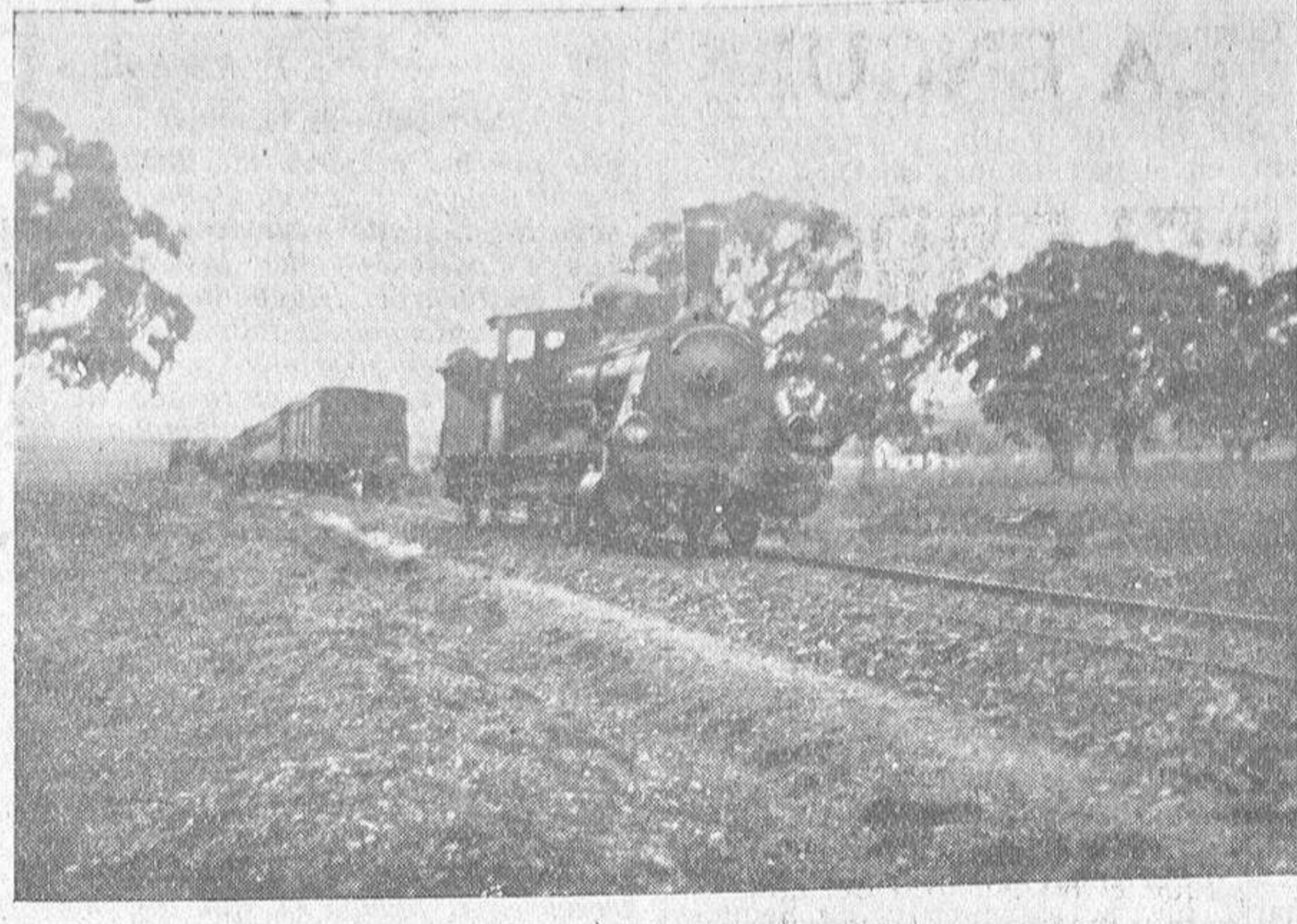
Al fondo de este fotografiado se ven los coches descarrilados y el personal trabajando en la vía.