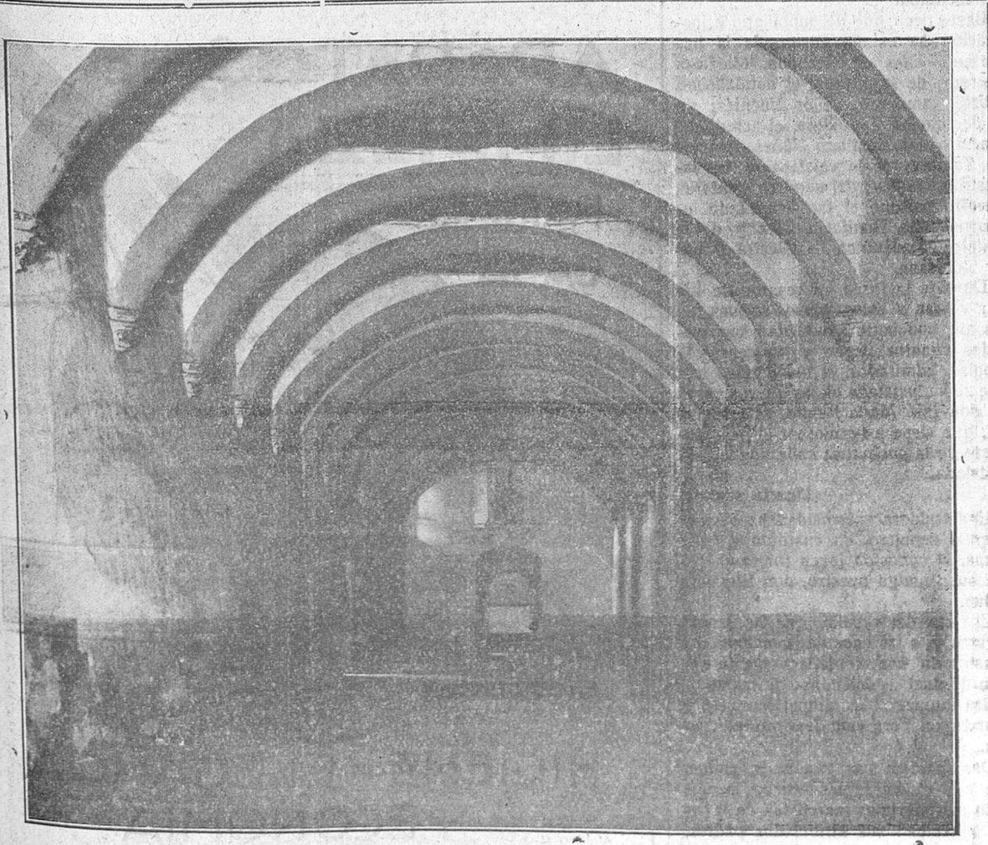
Claustro de Colón, en el Convento de San Esteban, de esta ciudad, donde se supone conferenció el navegante genovés con los Padres Dominicos