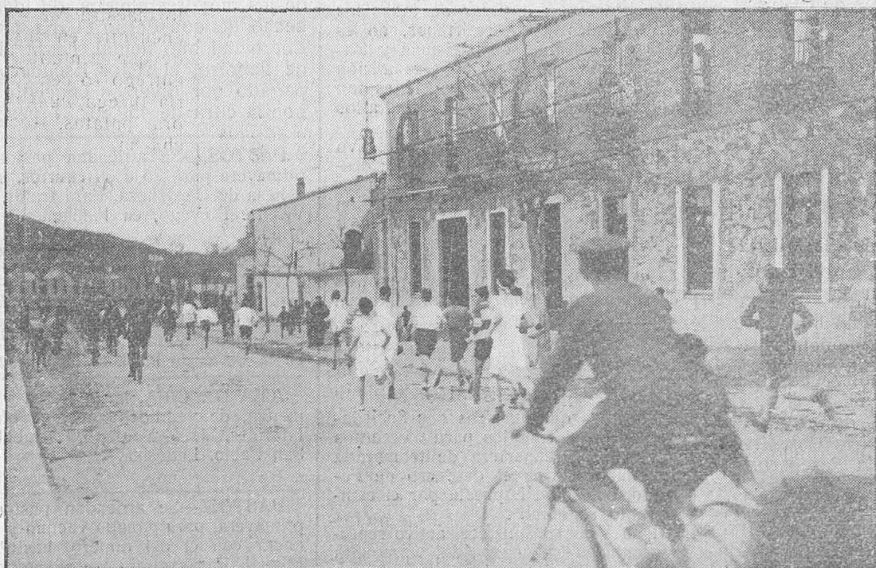
Grupo de corredores en la cuesta del paseo del Rector Esperabé.

No termina el "Ciclo deportivo organizado por EL ADELANTO, con la "Carrera ciclista campeonato de velocidad" y la "Segunda vuelta pedestre a Salamanca", que hemos realizado, por cierto, en menos de un mes de tiempo, sino que prometemos otros muy interesantes concursos deportivos, los que oportunamente daremos a conocer a nuestros lectores.