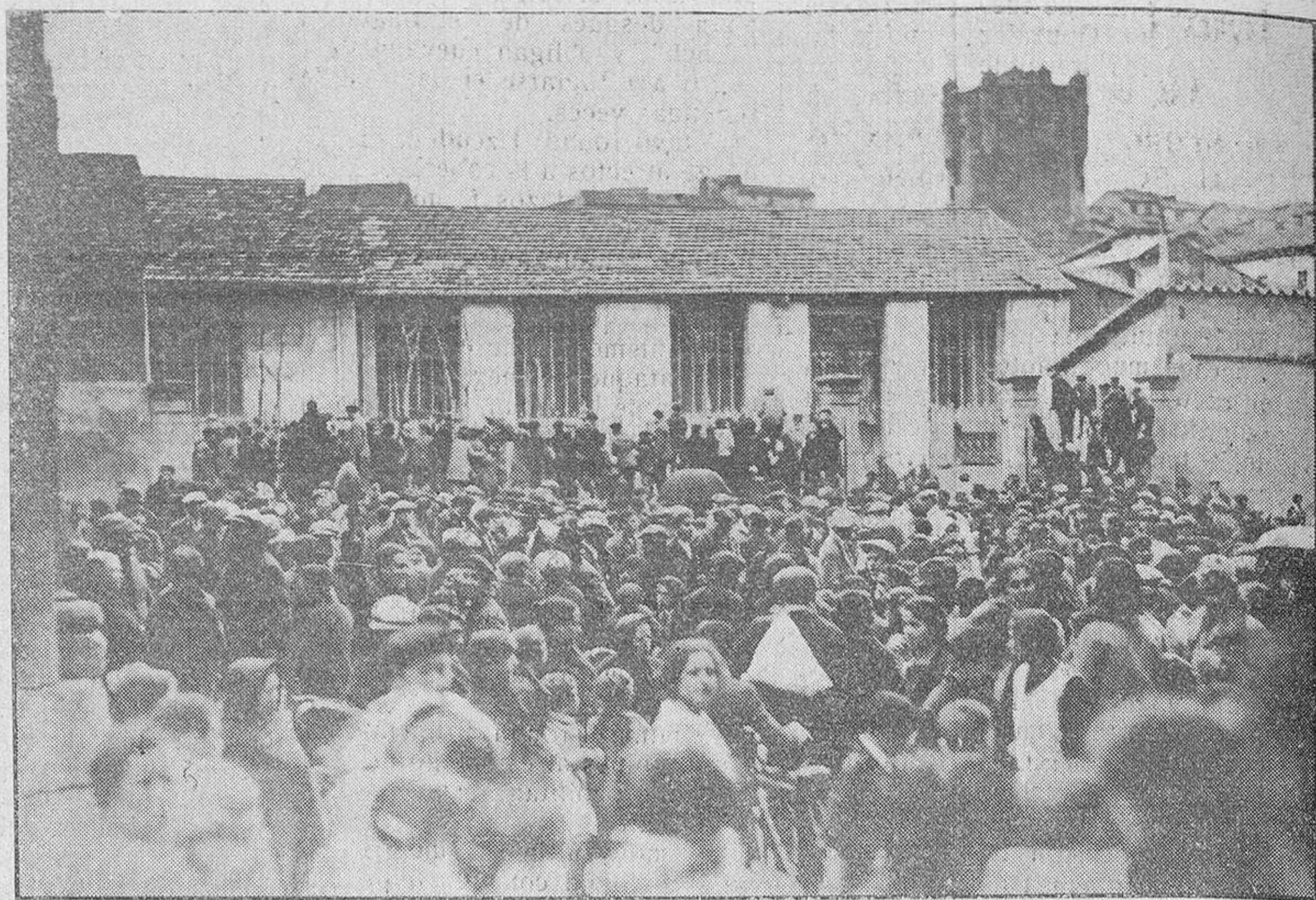
El público frente a nuestros talleres, momentos después de empezar la carrera.

Como prometimos en nuestro número de anteayer, publicamos las presentes fotografías, por las que nuestros lectores podrán apreciar que hemos sido parcos al decir, reseñando la "Carrera segunda vuelta pedestre a Salamanca, organizada por EL ADELANTO", que había constituido un éxito.