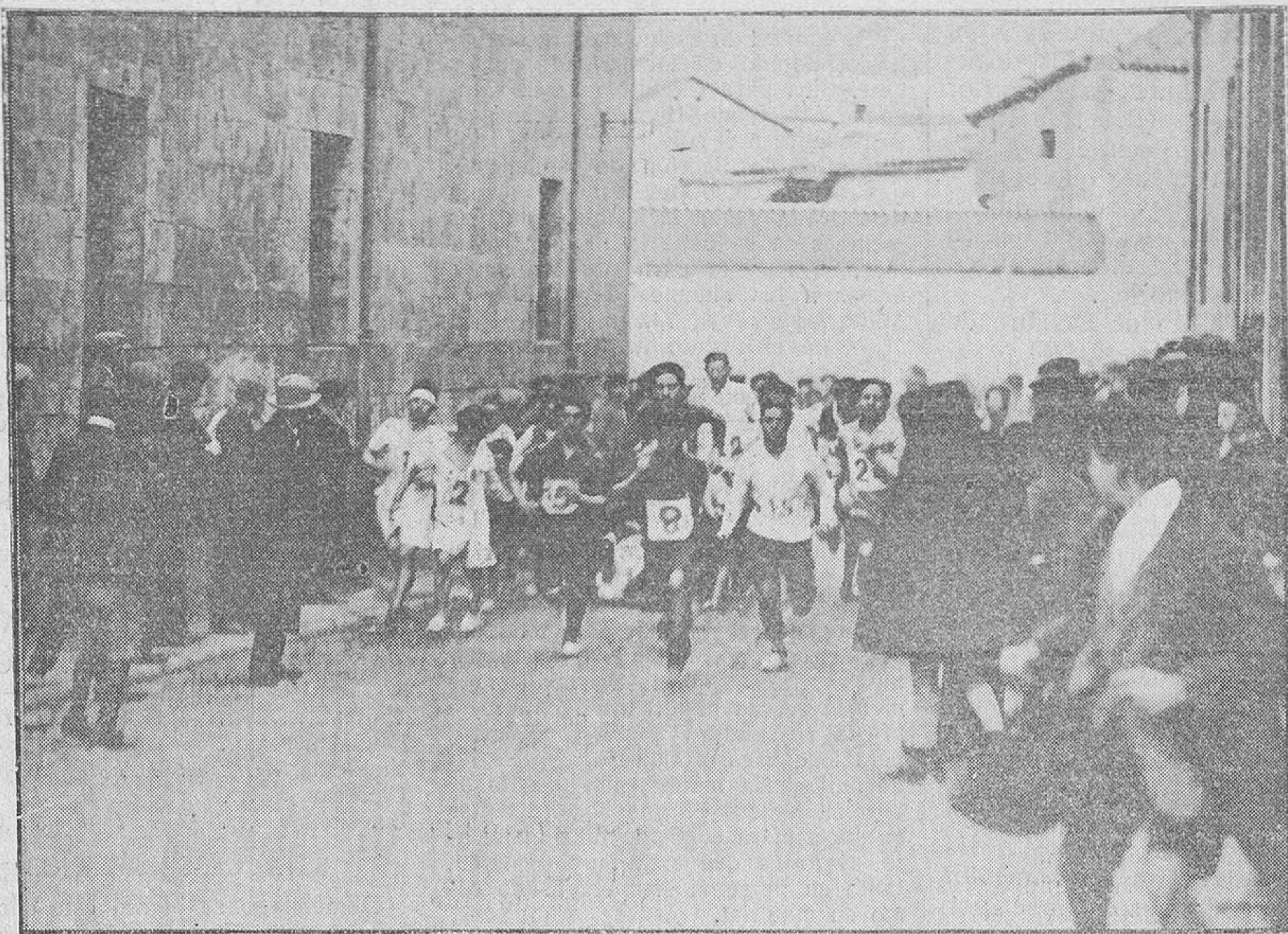
Interesante momento de la salida de los corredores.