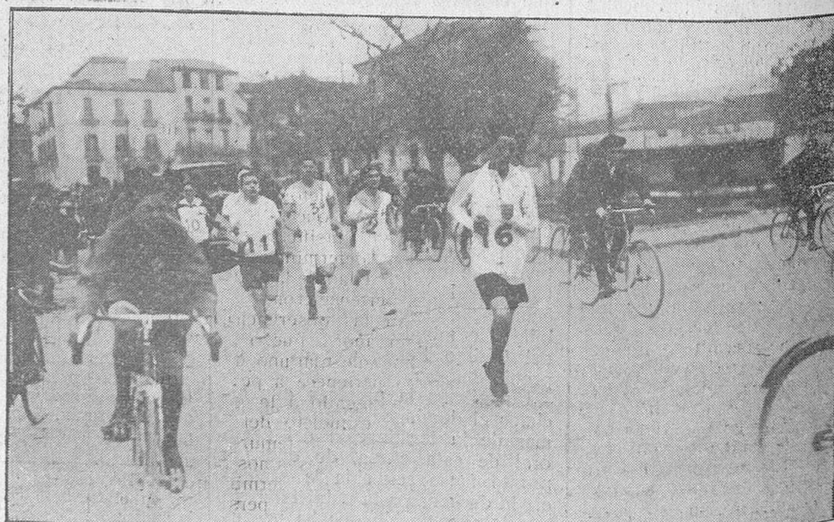
Otro grupo de corredores a su paso por la Puerta de Toro, junto a la Alamedilla.