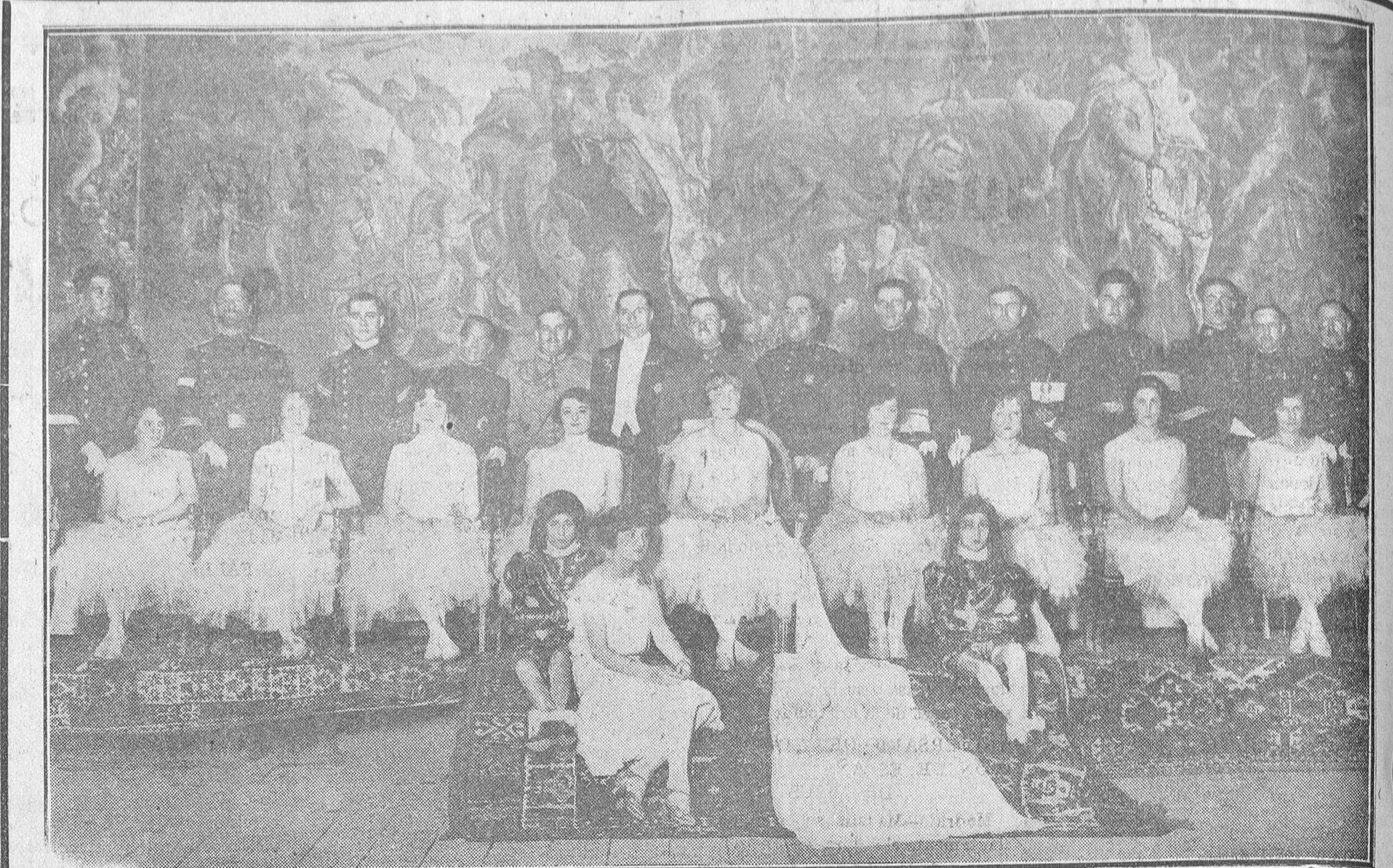
La reina de la fiesta y sus damas de honor, en los Juegos Florales celebrados en el teatro de la Zarzuela, organizados por el Casino de Clases del Ejército.

Se arriendan, juntos o separados, los amplios locales, con sus bodegas, de la plazuela de Santa Eulalia número 9. Para tratar, Doctor Riesco 56.