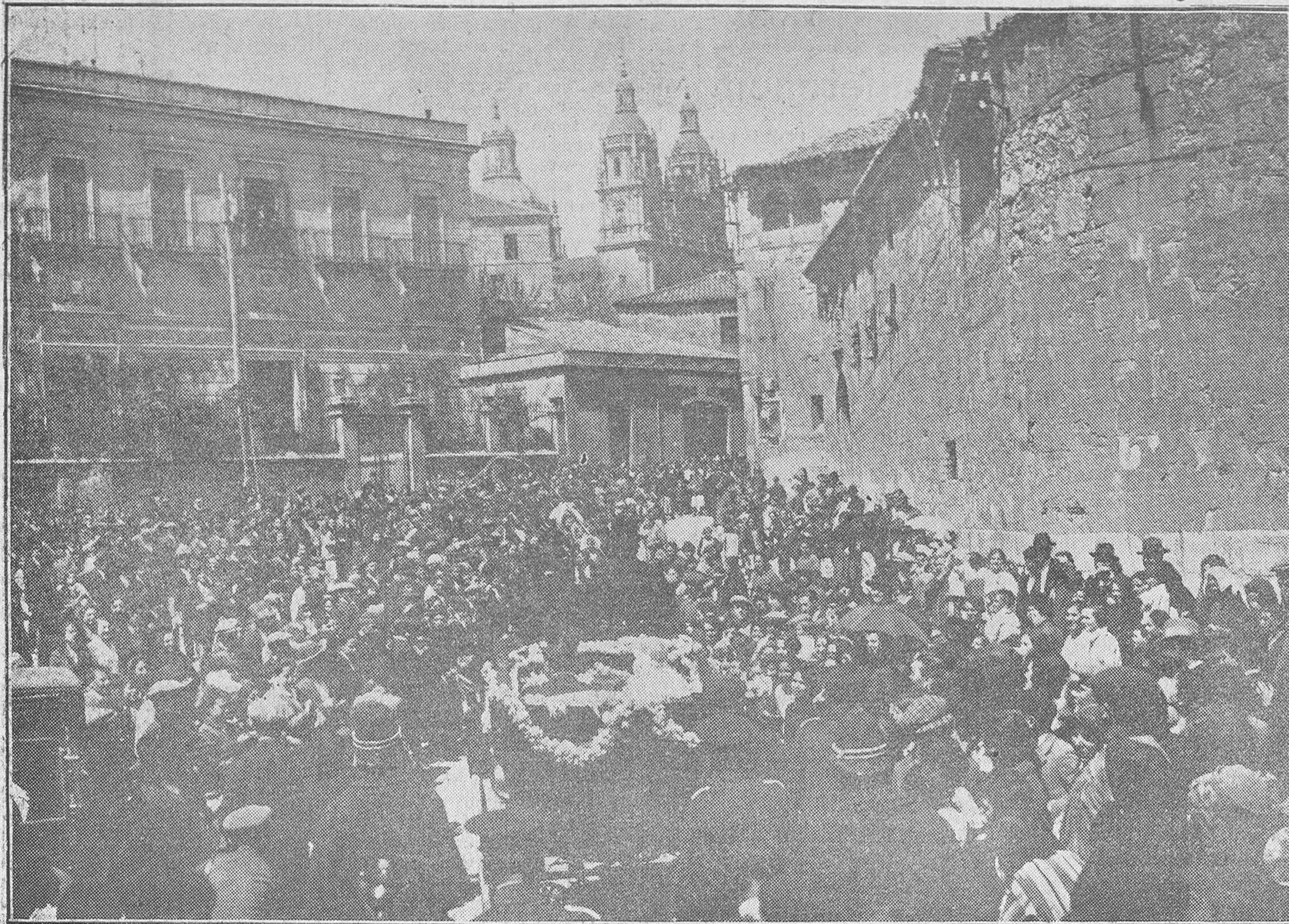
La amplia plaza situada frente al Convento de San Esteban, llena de gente, que espera el paso de la comitiva.