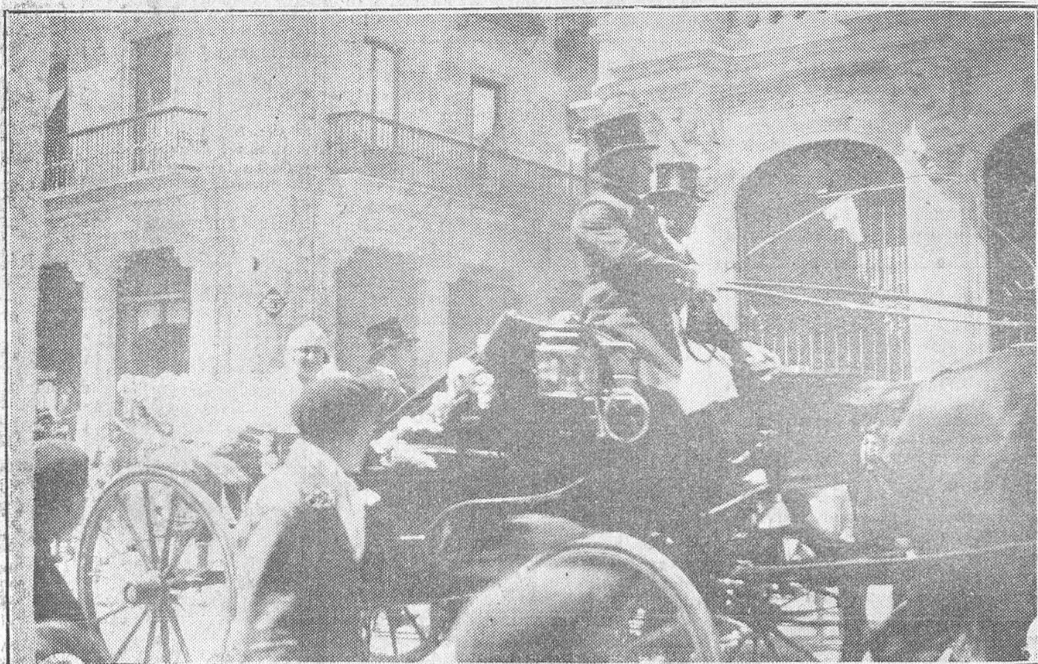
Los novios, en coche, después de casados.