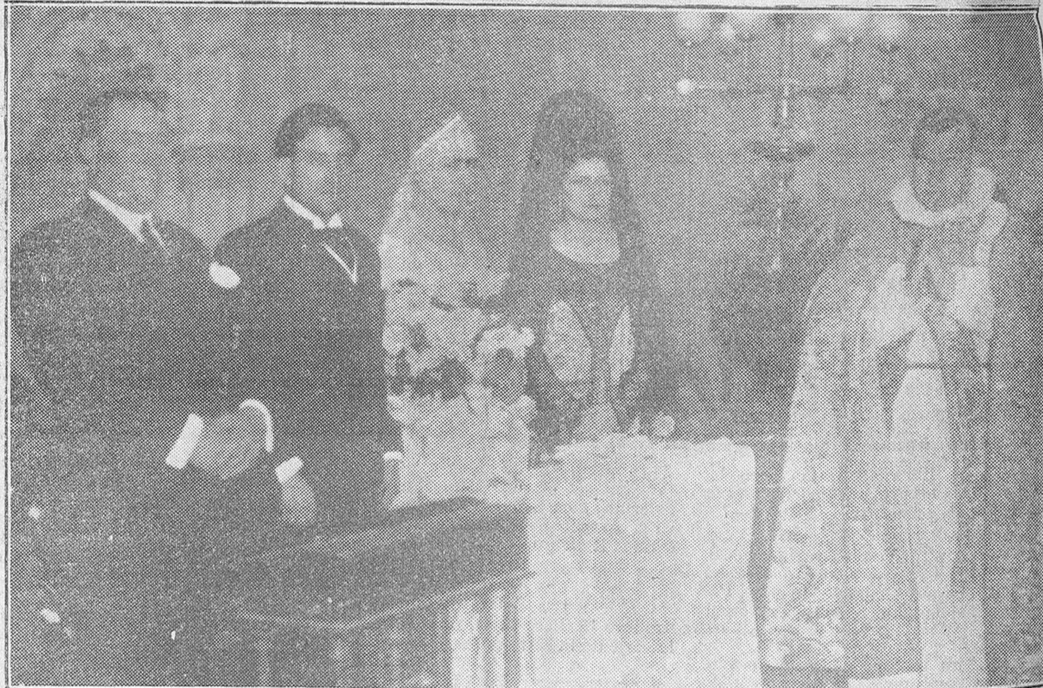
Los novios, sus padrinos y el reverendo padre prior de los Dominicos, que casó a los contrayentes.