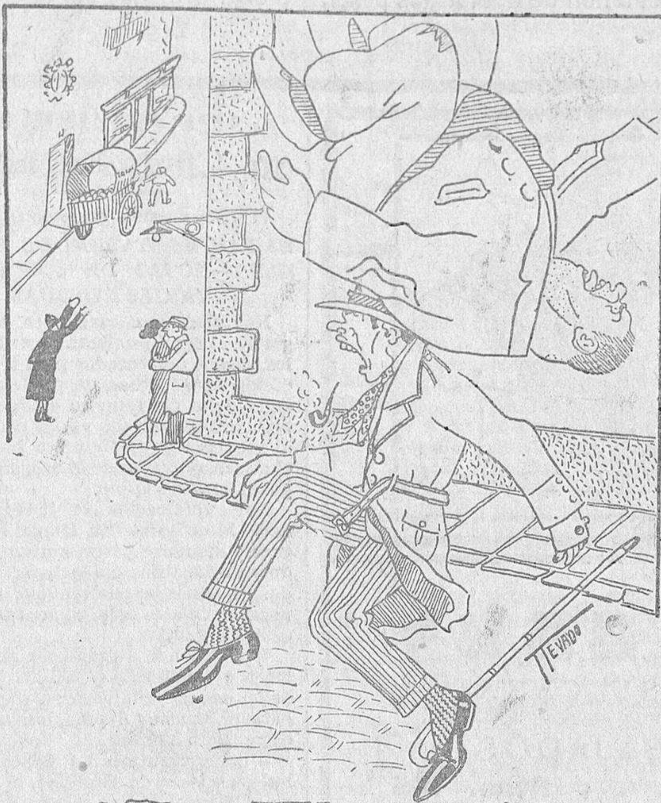
No se lamenten ustedes de su mala suerte, porque es pronto la caída del gordo y una «aprasimación».