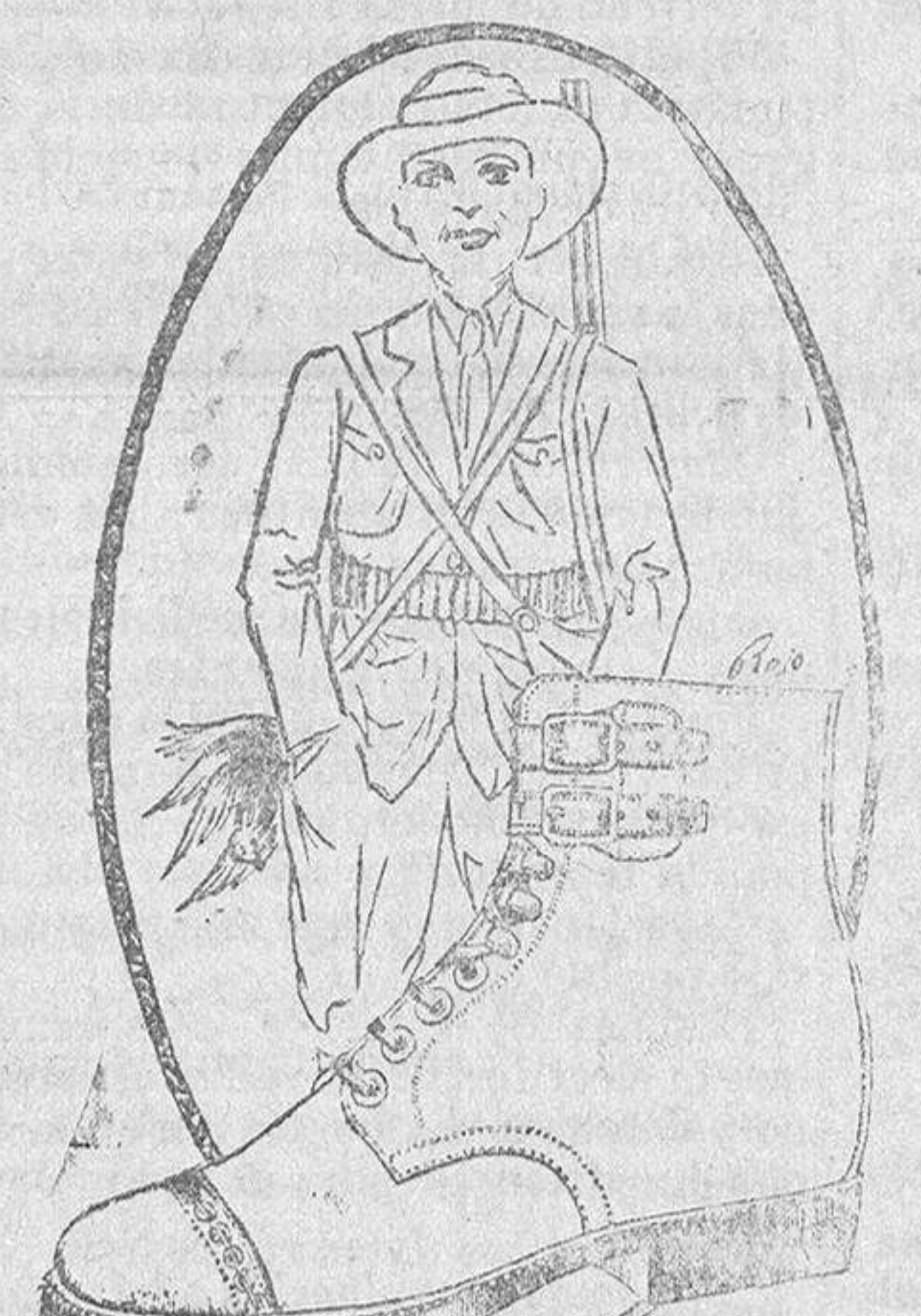
El mayor surtido y las mejores calidades en calzados fuertes para el invierno.

Continúa haciendo elogios de Veloz, cuya declaración examina, para decir que cuando la vida le ha permitido desenvolverse con independencia, ha dicho la verdad, como en todas las ocasiones.