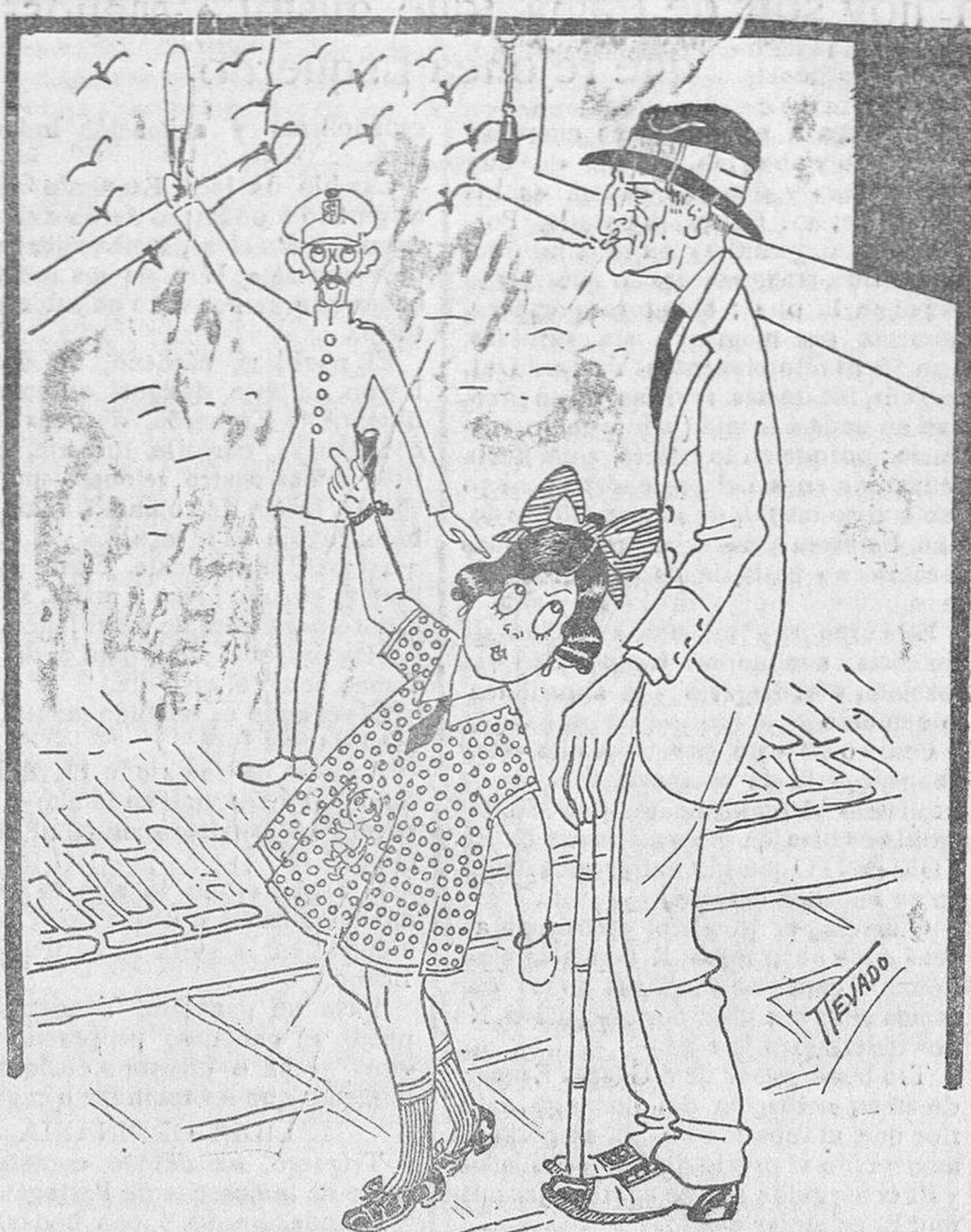
—Papá, ¿qué hace ese hombre con la gorra en alto? —Hijita, está ahí puesto para indicar la dirección de las cosas.

es el diario más antiguo y de mayor circulación de la provincia. Administración, calle de la Rúa, 25. Redacción y talleres, calle de Ramos del Manzano, núm. 42