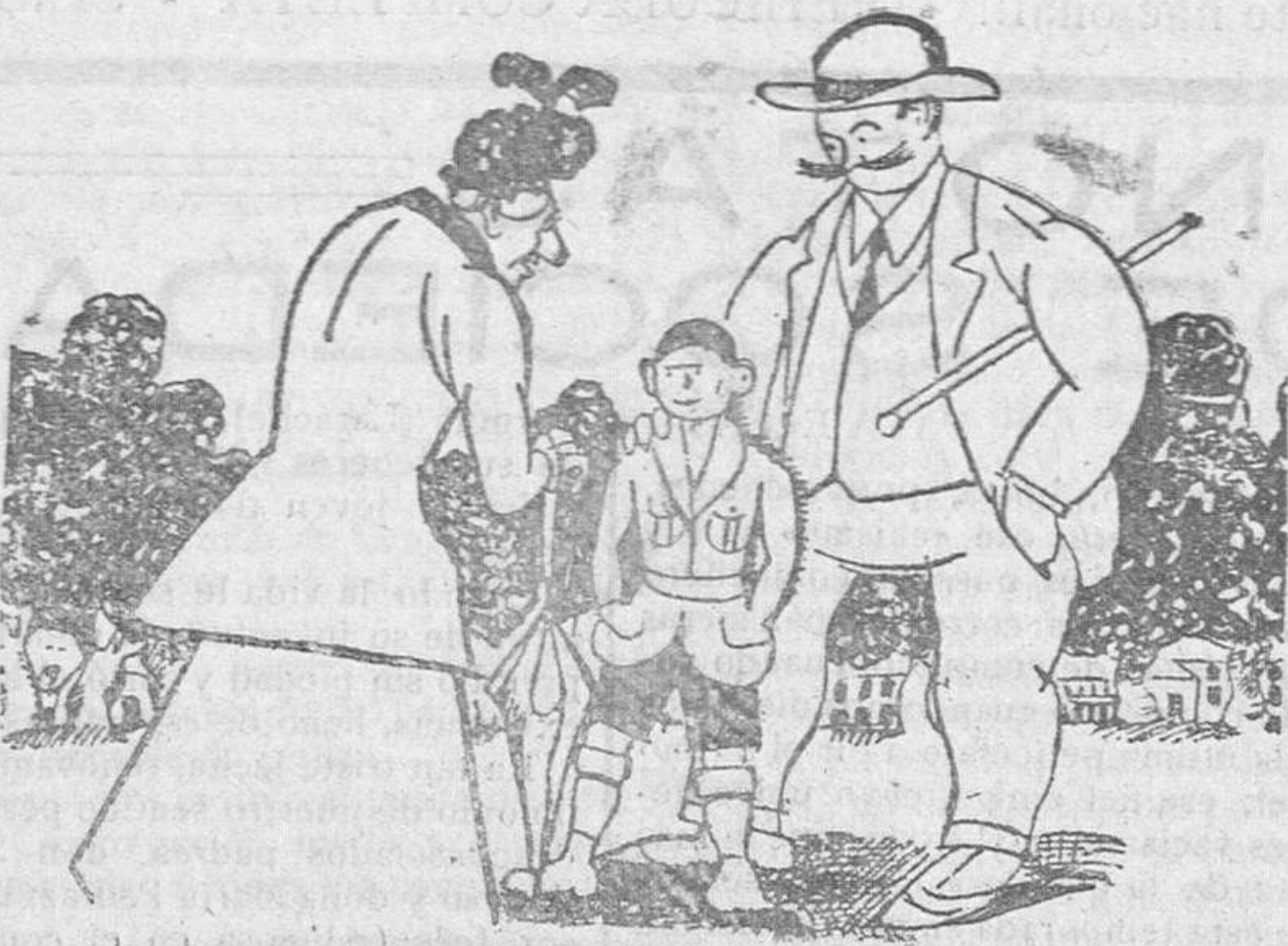
—El año pasado, ganó premio en latín. Este año quisiera que ganase un premio atlético. Hay que irse cuidando del porvenir de la criatura...