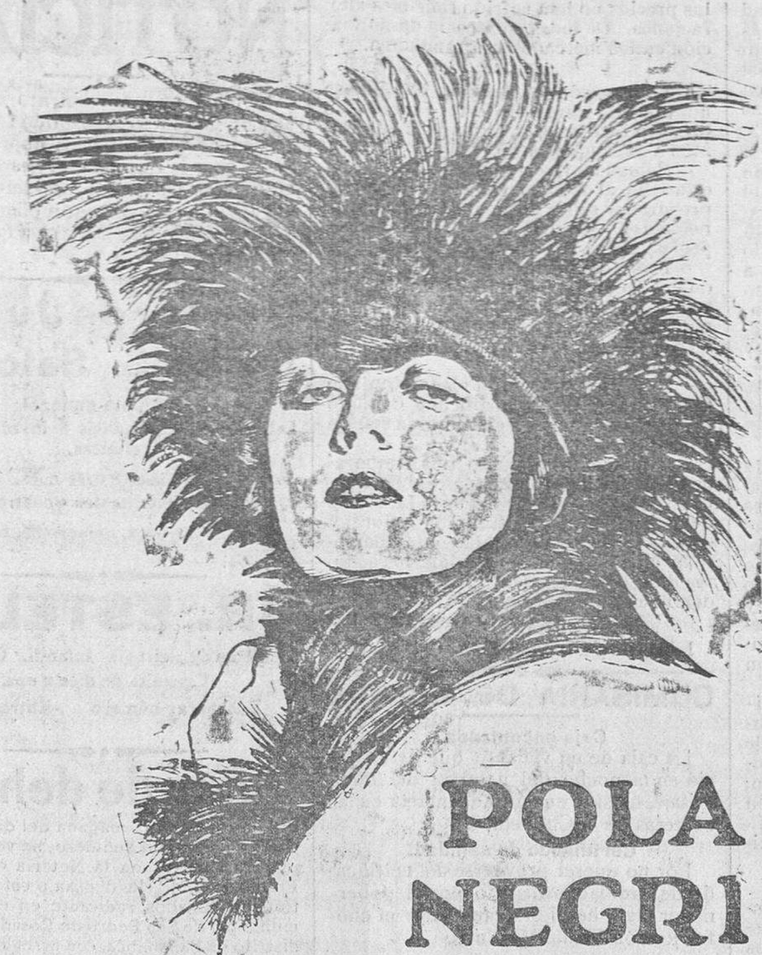
célebre y escultural estrella de la pantalla, protagonista de la hermosa cinta titulada SAPHO, que se proyecta hoy en el teatro Bretón.

Finalmente, comprendiendo que, a los médicos, como a todas las clases de la