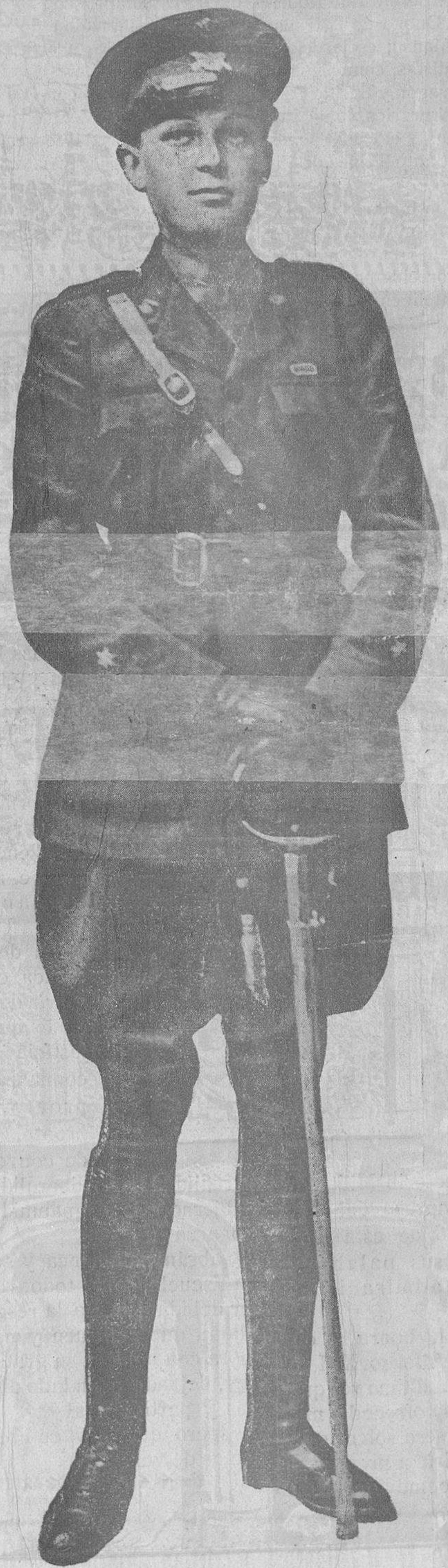
S. A. R. el Príncipe de Asturias.